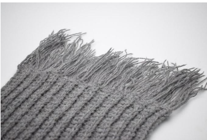
7. Gjenta hele veien bortover.