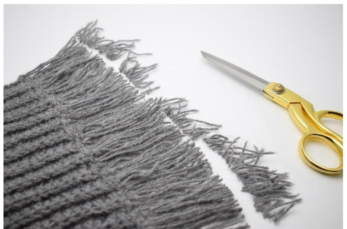
8. Klipp av ca. 1 cm slik at de blir like lange.