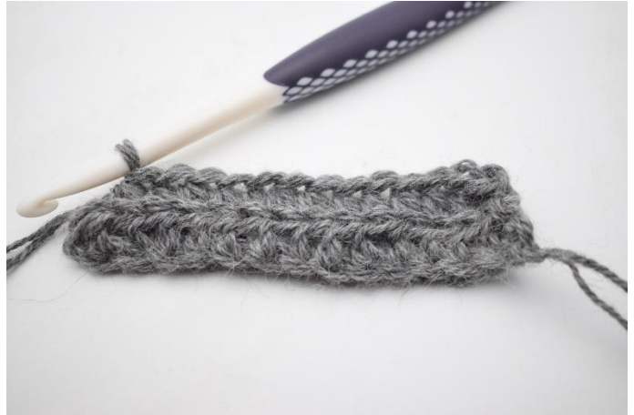
4. Hekle hstv i bml raden ut. I siste m kan man med fordel hekle igjennom begge lenker for å unngå huller i kanten.