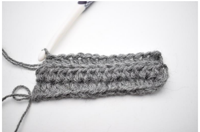
4. Gjenta raden ut. Siste hstv hekles igjennom begge lenker på masken.