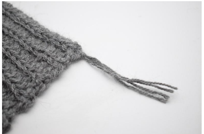
6. Stram lett til.