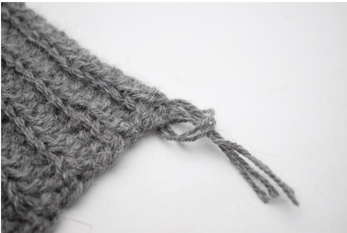
5. Trekk nå garn-endene i gjennom løkken.