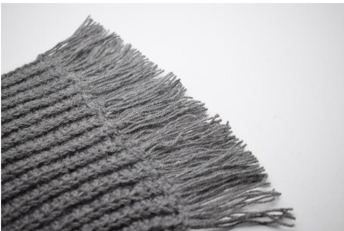
9. Gjenta dette i motsatt ende av ditt skjerf.