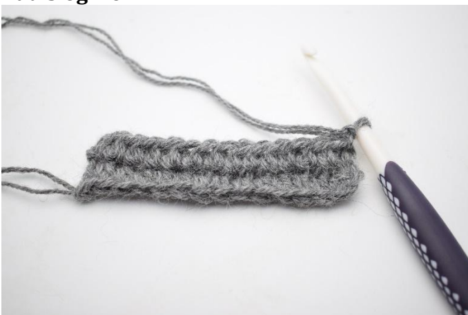
1. Gjenta fremgangsmåten som rad 2. Snu med 1 lm.