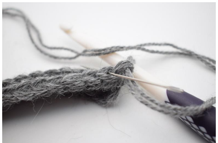
2. Hekle hstv i bml. Nålen markerer her den lenke din hstv skal hekles i.