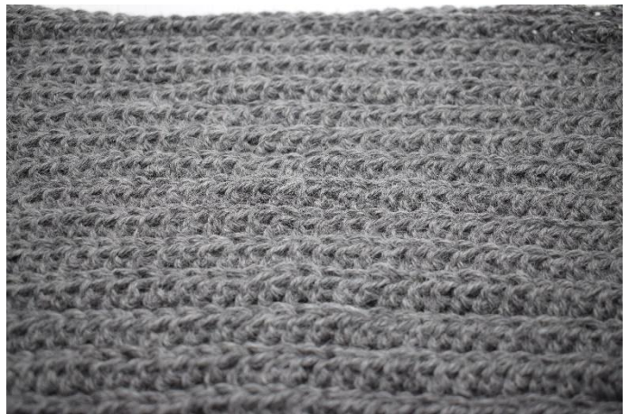
6. Gjenta fremgangsmåten som rad 2 i alt 27 ganger.