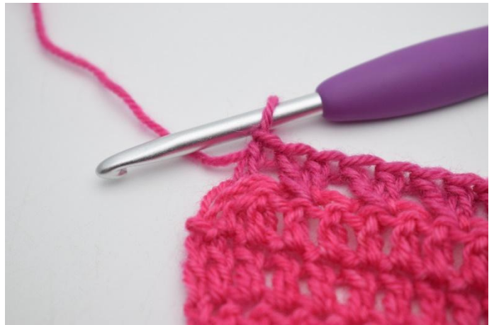
8. hekle 1 stv i siste m.

100. Vend med 3 lm. Hekle de 2 neste m sm. Hekle stv raden ut. (=93)