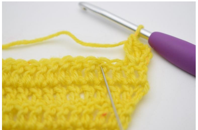
6. Hopp over 1 m,