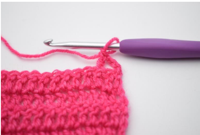
3. Hekle 1 stv.