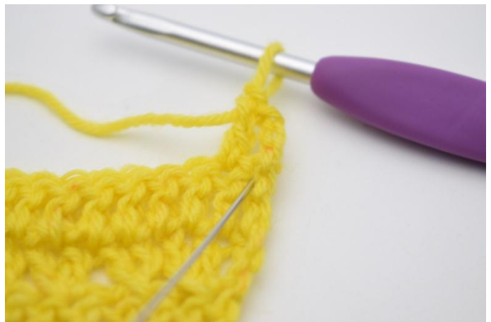
4. Nå hekles det 1 stv i den masken som nettopp er blitt hoppet over.