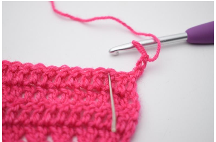
2. Hopp over 2 m.