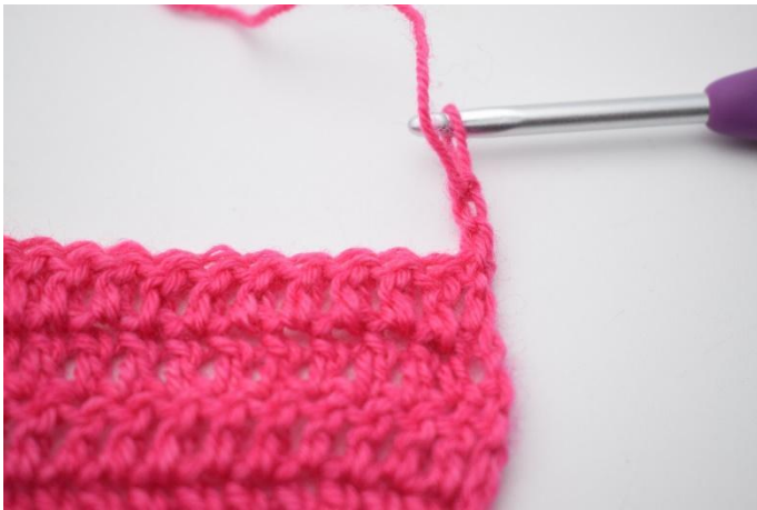
1. Vend med 3 lm.