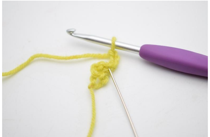
2. Økningen lages ved at det hekles 1 stv i første m. Den masken som nålen her markerer.