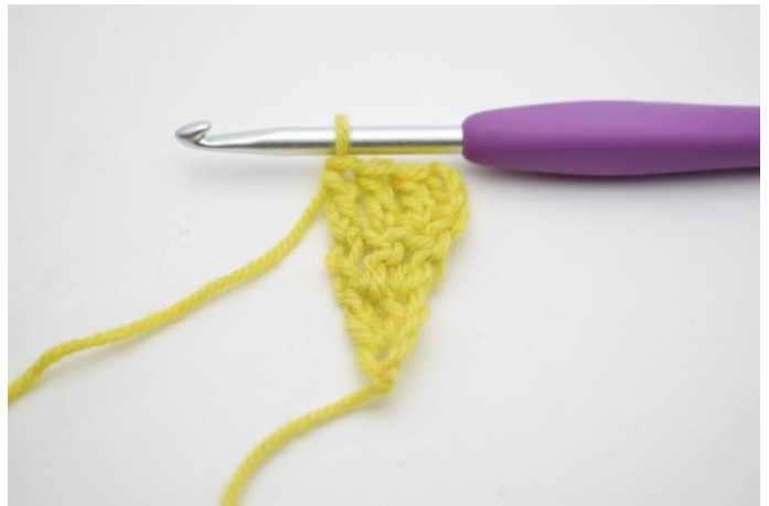
4. Hekle 1 stv i de siste 2 m.

4. -20. Gjenta fremgangsmåten *Vend med 3 lm. Hekle 1 stv i første m. Hekle 1 stv raden ut.* til du har 20 rader. (=21)