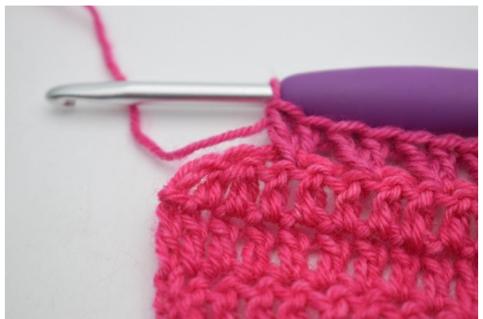
6. Hekle nå mønster som normalt. *Hopp over 1 m og hekle 1 stv i neste m. Hekle 1 stv i m som nettopp er blitt hoppet over*. Gjenta *til* raden ut og det er 2 m igjen.