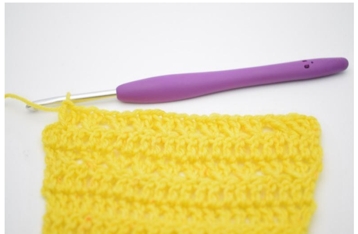
10. Gjenta med krysset stv til det er 1 m igjen.