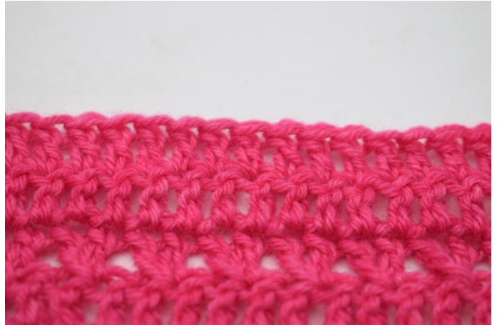
4. Hekle stv raden ut.

98. Vend med 3 lm. Hekle de 2 neste m sm. Hekle stv raden ut. (=95)