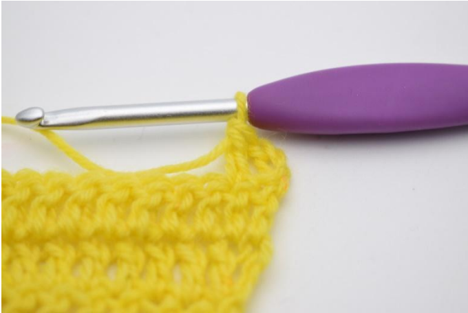
3. Hekle 1 stv.