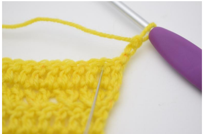
2. Hopp over 1 m,