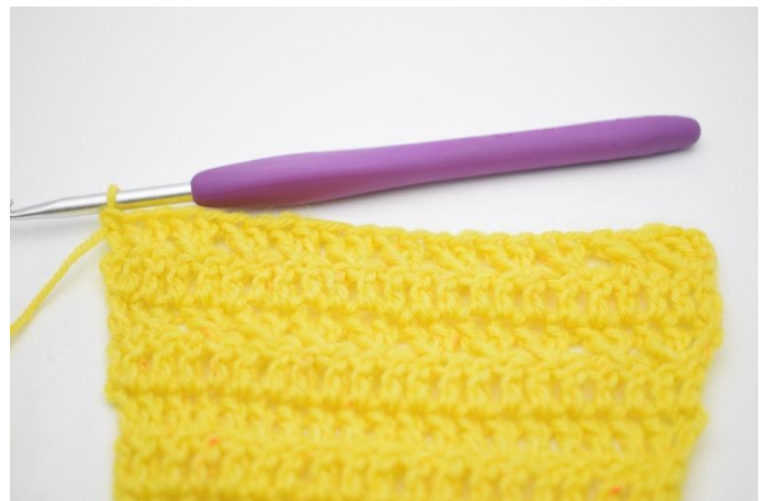
12. Det er nå heklet 1 rad med mønster.

24. Vend med 3 lm. Hekle 1 stv i første m. Hekle 1 stv raden ut. (=25)