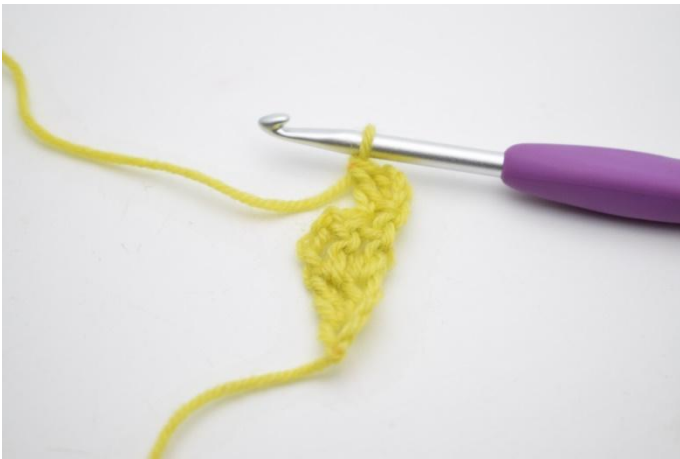
3. Slik. Det er nå heklet 1 økning.