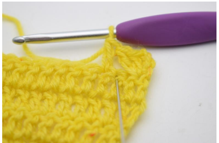
8. Nå hekles det 1 stv i den maske som nettopp er blitt hoppet over.