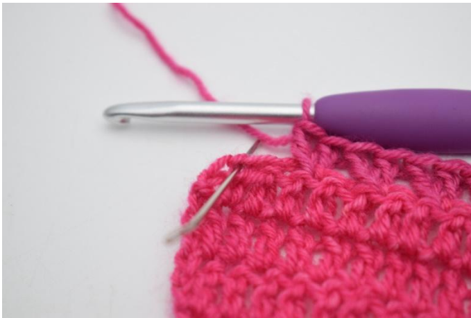
7. Hopp over 1 m,