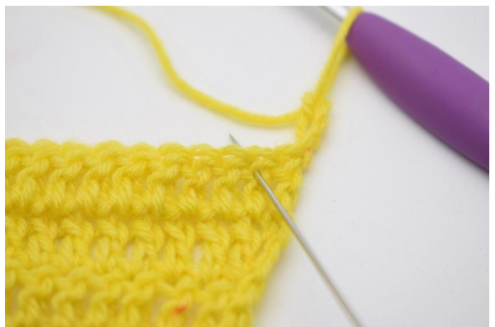
2. Hopp over 1 m,