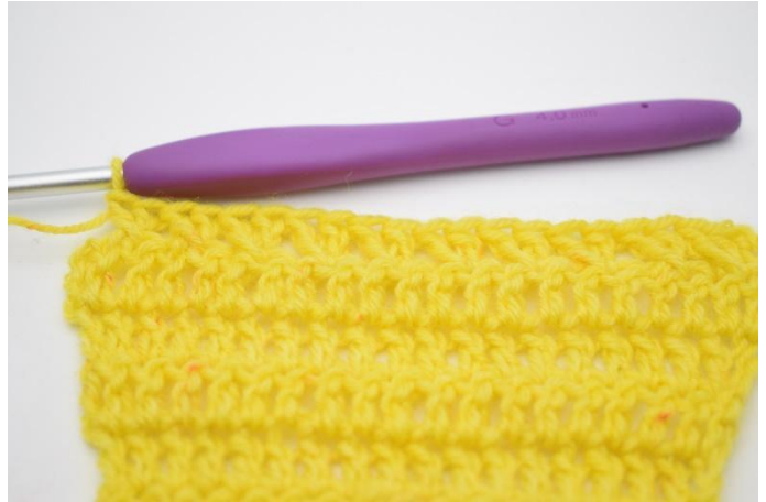
10. Gjenta med krysset stv til det er 1 m igjen.