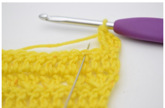
6. Hopp over 1 m,