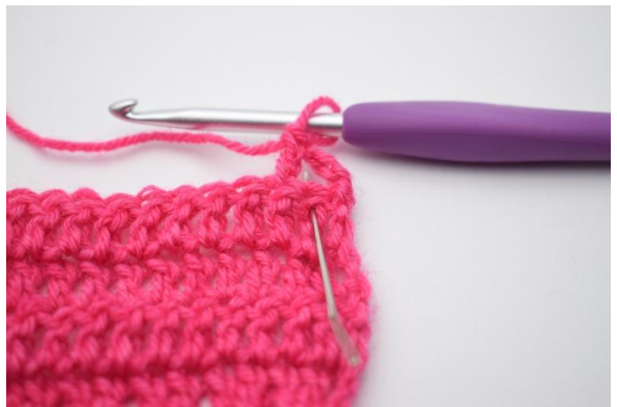
4. Hekle 1 stv i den 2.maske som ble hoppet over.