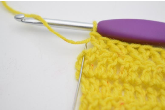
11. Hekle 1 stv i siste m.