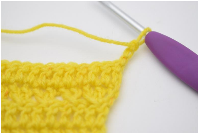
1. Vend med 3 lm.

Vend med 3 lm. ”Hopp over 1 m og hekle 1 stv i neste m. Hekle 1 stv i m som nettopp er blitt hoppet over* 1 . Gjenta *til* raden ut og det er 1 m igjen. Hekle 1 stv i siste m. (=24)