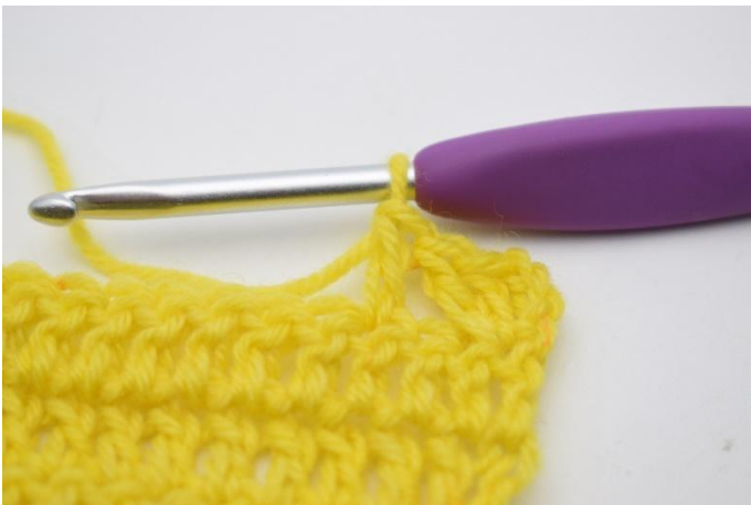
7. hekle 1 stv.