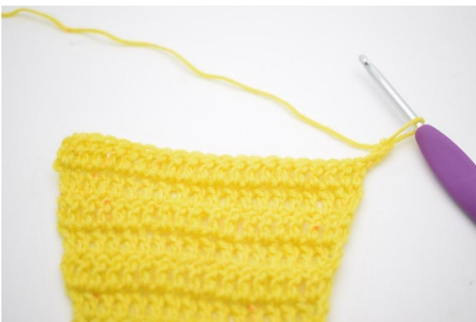
1. Vend med 3 lm.

21. Nå skal det hekles en mønster rad med økning. Disse rader hekles på følgende måte: Vend med 3 lm. *Hopp over 1 m og hekle 1 stv i neste m. Hekle 1 stv i m som nettopp er blitt hoppet over*. Gjenta *til* raden ut og det er 1 m igjen. Hekle 1 stv i siste m. (=22)