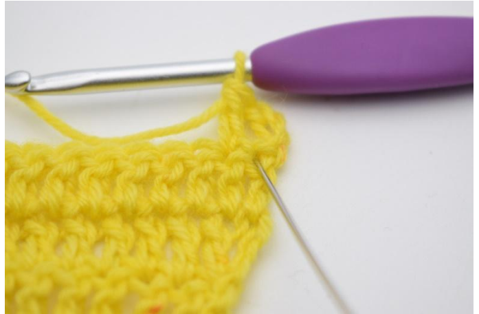
4. Nå hekles det 1 stv i den masken som nettopp er blitt hoppet over.