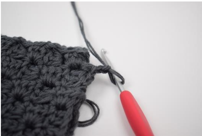
5. Lag 2 lm.