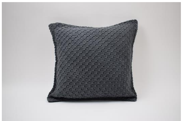
12. Klipp av garnet og fest ender.