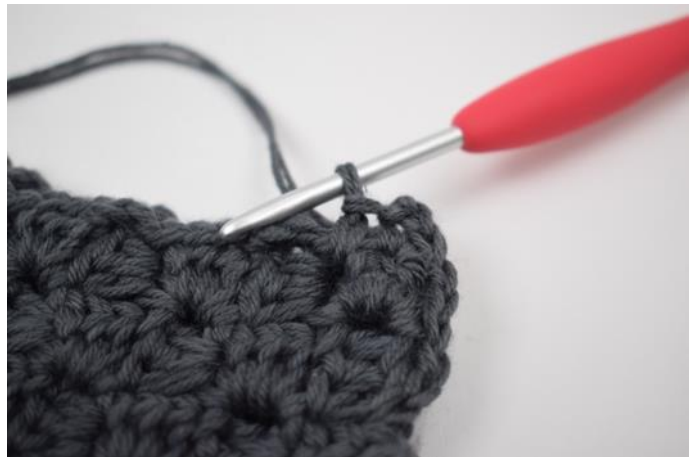
8. Hekle 1 fm imellom de neste 2 "firkanter".