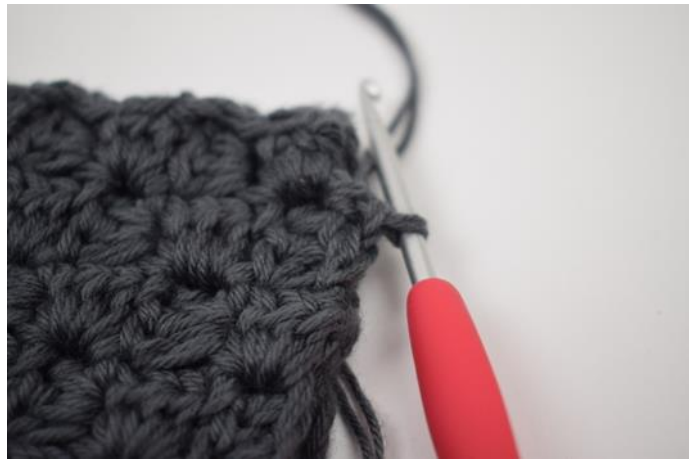
4. Hekle 1 fm imellom de neste 2 "firkanter".