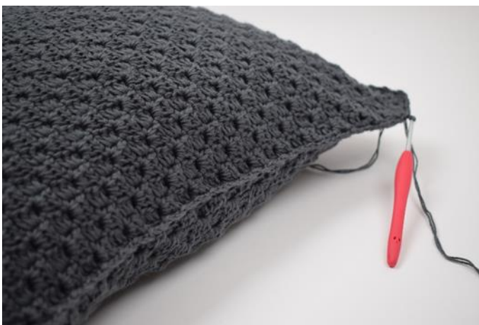
11. Fortsett til du er hele veien rundt. Avslutt med 1 km.