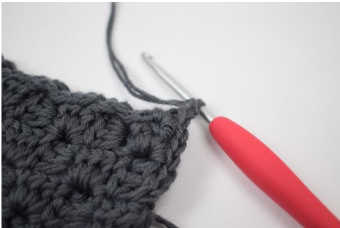
7. Lag 2 lm.