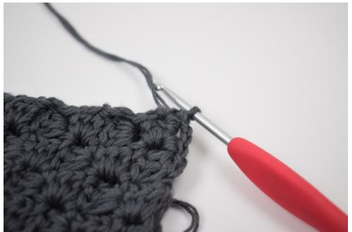
6. Hekle 1 fm i hjørnet.