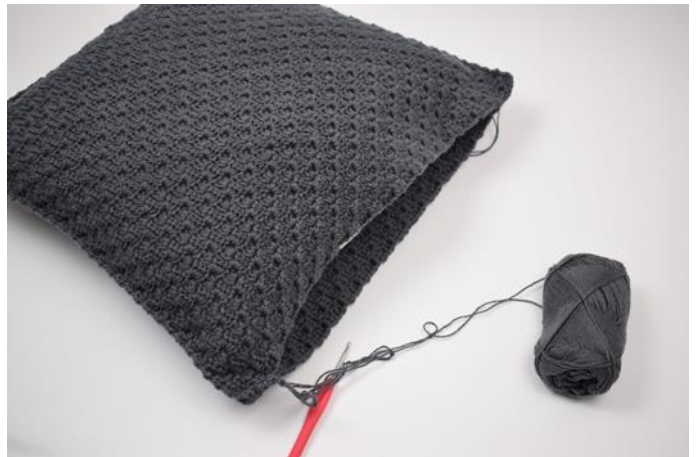
10. Sett inn puten innen den lukkes helt igjen.