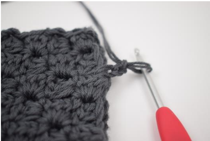
3. Lag 2 lm.