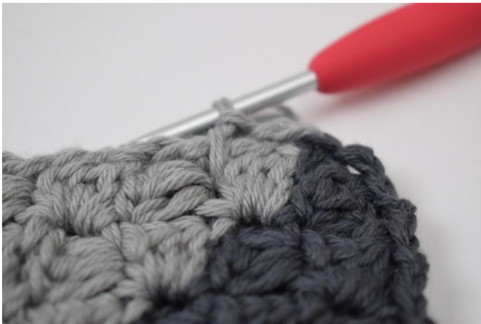
9. Fortsett rundt om puten med fg. B.