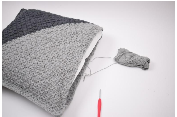
10. Sett inn puten innen den lukkes helt igjen.