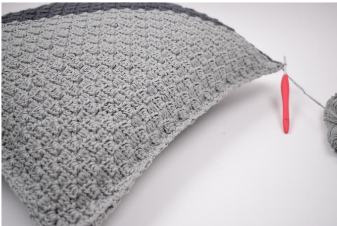
11. Fortsett til du er hele veien rundt. Avslutt med 1 km.