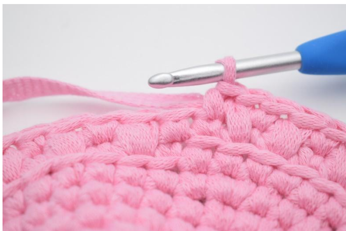
11. Gjenta skiftevis fm og lfm omgangen rundt. Avslutt med 1 fm.