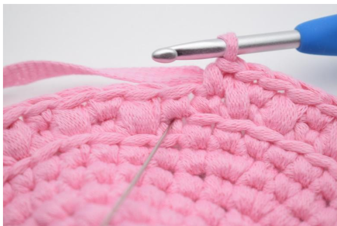
12. Nå skal det hekles 1 lfm. Nålen viser hvor din lfm skal hekles.