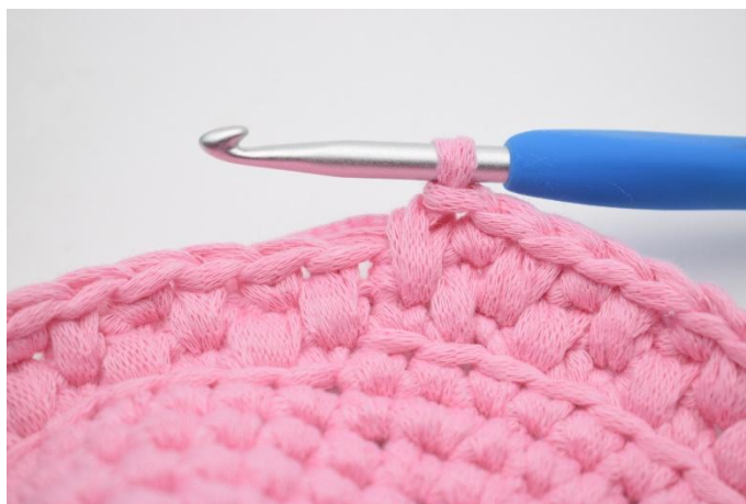
18. Gjenta skiftevis lfm og fm omgangen rundt. Avslutt med 1 lfm.