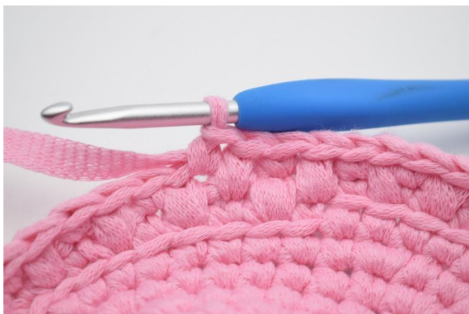
17. Hekle 1 fm i neste m.