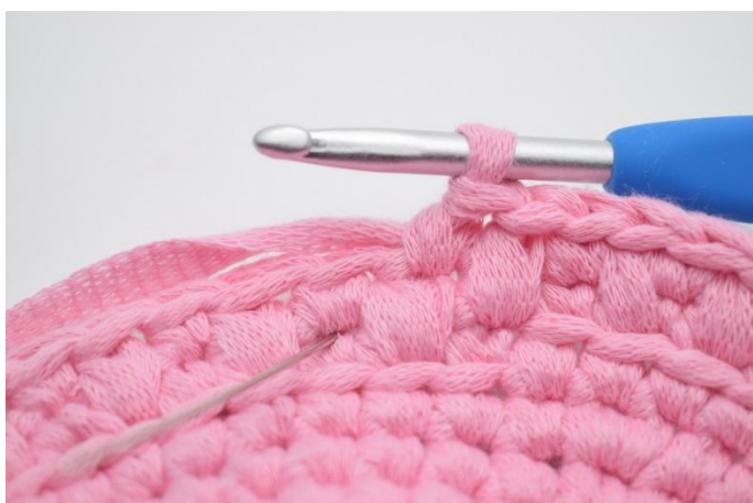
15. Hekle 1 lfm i neste m. Nålen viser hvor din lfm skal hekles.