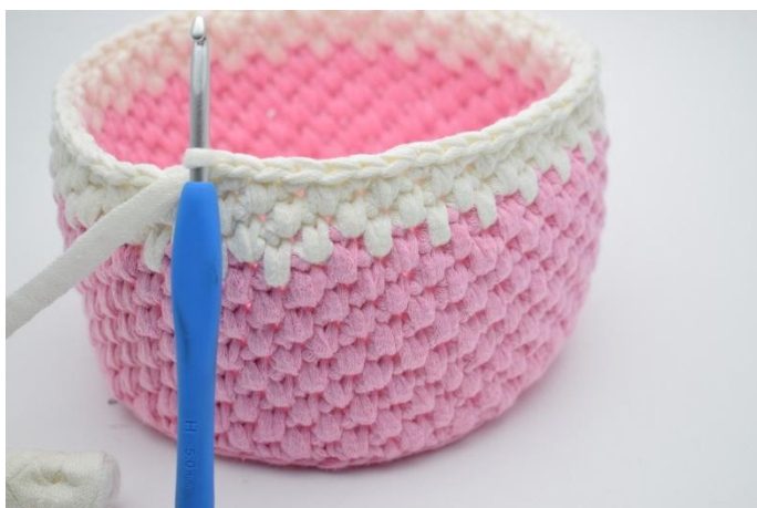
19. Gjenta omgangene som beskrevet i oppskriften.