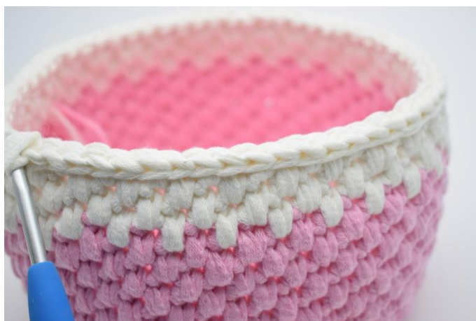
20. Avslutt med 1 omgang km. Klipp av tråden og fest endene.