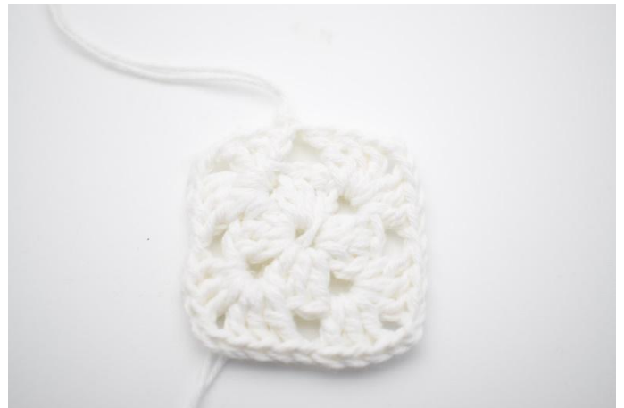
8. Klipp av garnet.