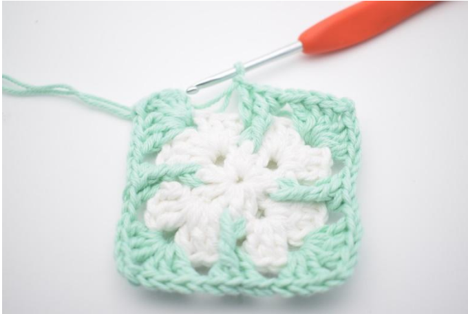
11. Genta *til* i alt 3 ganger.