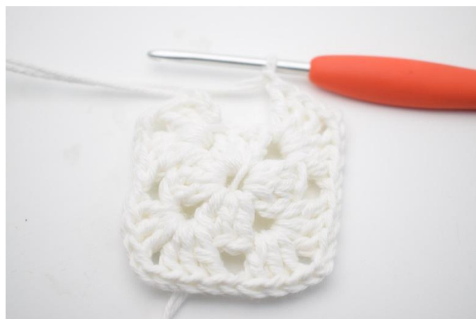
6. Gjenta *til* i alt 3 ganger.