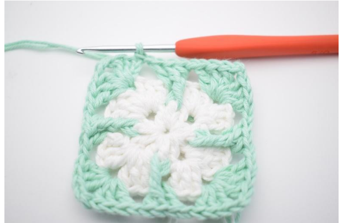
12. Avslutt med 1 km.