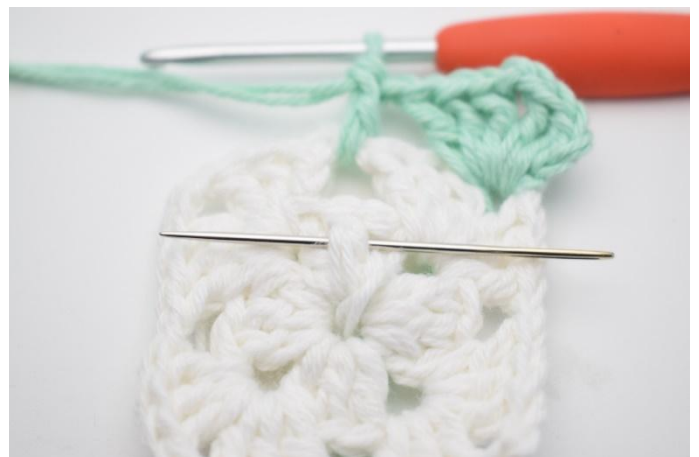
4. Det er nå heklet 1 stv i lm-mellomrommet. Nå skal det hekles 1 D-RstR. Det er en alm. dobbelstav men som hekles på forsiden omkring stv-stolpen i den midterste stv fra omgang 1. Nålen her markerer den stolpe din D-RstR skal hekles omkring.