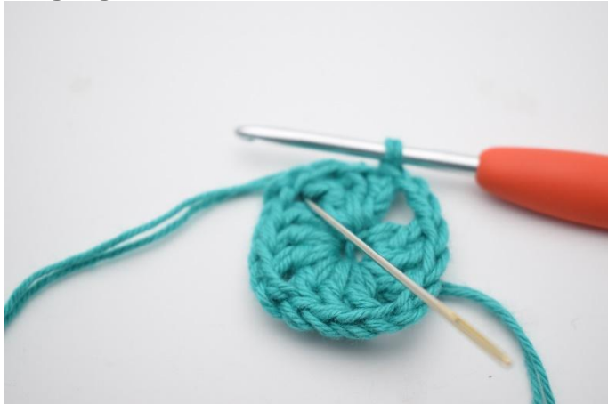
1. Lag km bort til lm-buen.