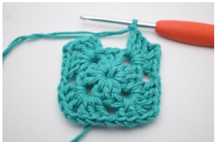
6. Gjenta *til* i alt 3 ganger.