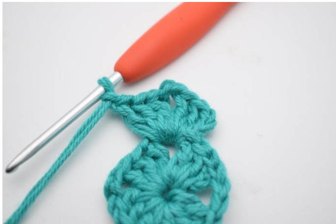
3. Lag 3 lm, hekle 2 stv, 2 lm, 3 stv og 1 lm i lm-buen.