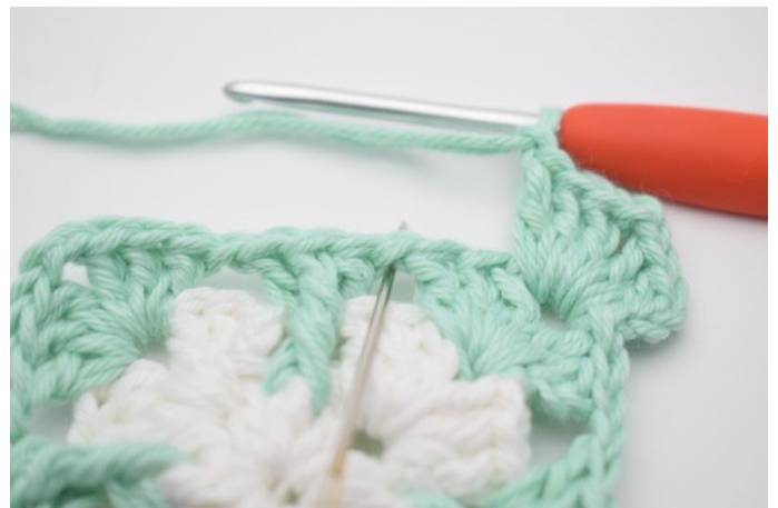
4. I neste lm-mellomrom hekles 1 stv, 1 D-RstR omkring den midterste m i stv-gruppen fra omgang 2, 1 stv og 1 lm.