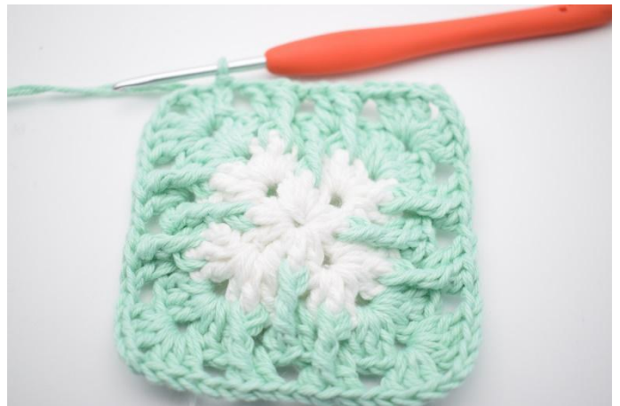
8. Avslutt med 1 km.