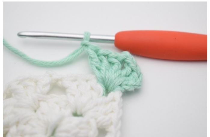
2. Lag 3 lm, hekle 2 stv, 2 lm, 3 stv og 1 lm i lm-buen.