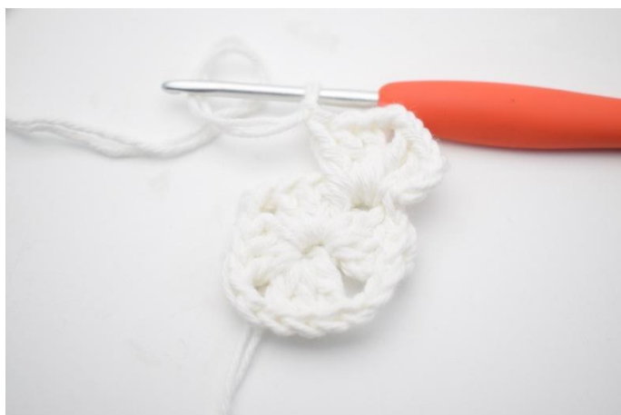
3. Lag 3 lm, hekle 2 stv, 2 lm, 3 stv og 1 lm i lm-buen.