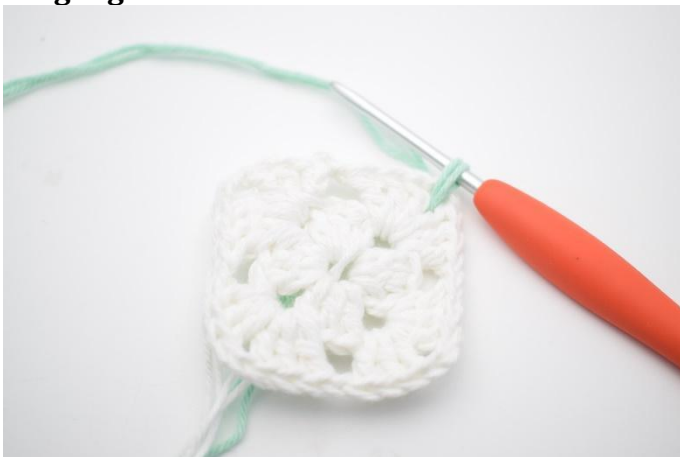
1. Med farge B. Sett inn garnet i en lm-bue.