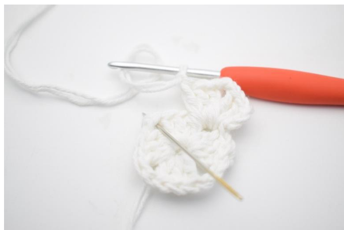
4. Hekle * 3 stv, 2 lm, 3 stv og 1 lm i neste lm-bue*.