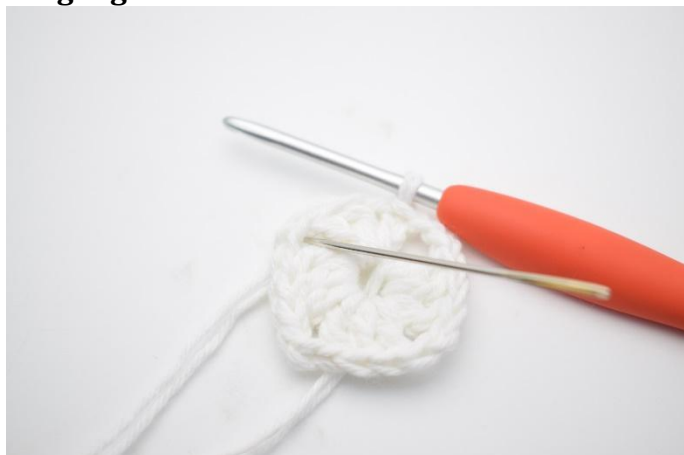
1. Lag km bort til lm-buen.