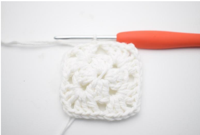
7. Avslutt med 1 km.