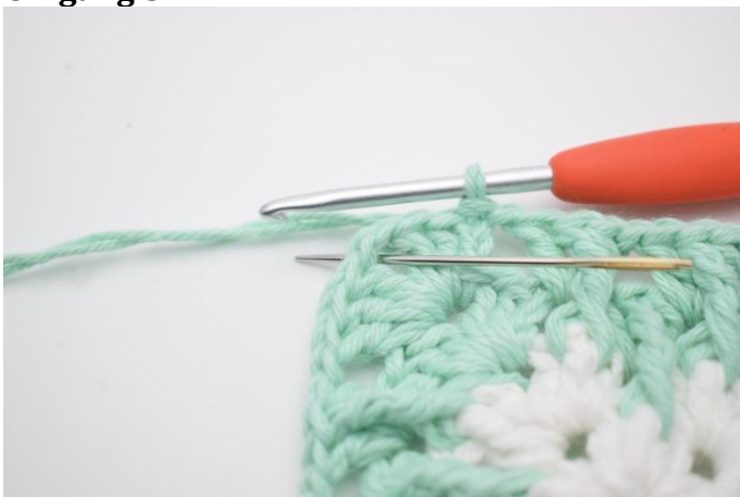
1. Lag km bort til lm-buen.