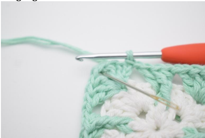
1. Lag km bort til lm-buen.