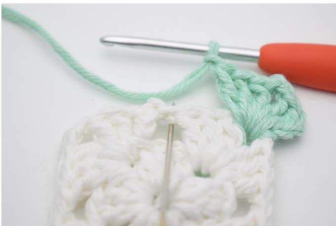
3. I neste lm-mellomrom hekles 1 stv, 1 D-RstR omkring den midterste m i st-gruppen fra omgang 1, 1 stv og 1 lm.