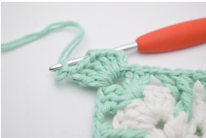
3. Lag 3 lm, hekle 2 stv, 2 lm, 3 stv og 1 lm i lm-buen.