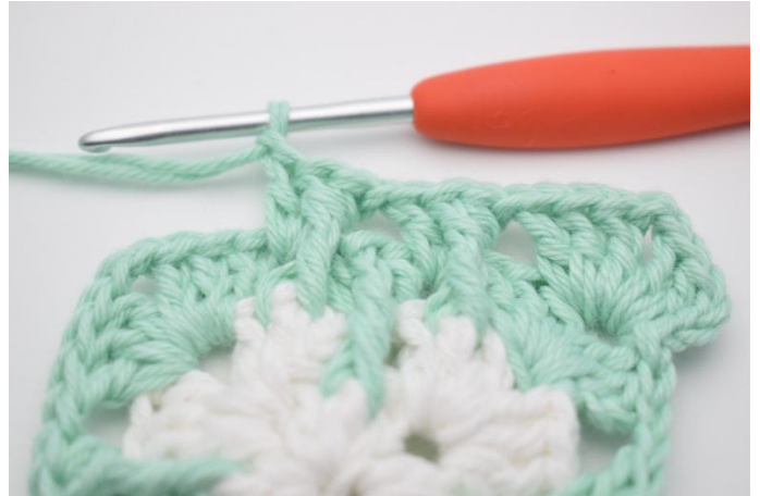
6. Gjenta i neste lm-mellomrom.