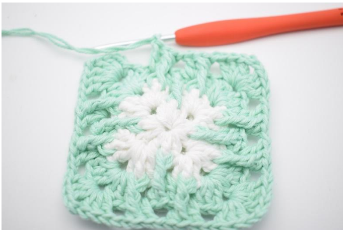
7. Hekle *3 stv, 2 lm, 3 stv og 1 lm i neste lm-bue. I de neste 2 lm-mellomrom hekles 1 stv, 1 D-RstR omkring den midterste m i stv-gruppen fra omgang 2, 1 stv og 1 lm*. Gjenta *til* i alt 3 ganger.