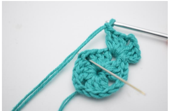
4. Hekle * 3 stv, 2 lm, 3 stv og 1 lm i neste lm-bue*.