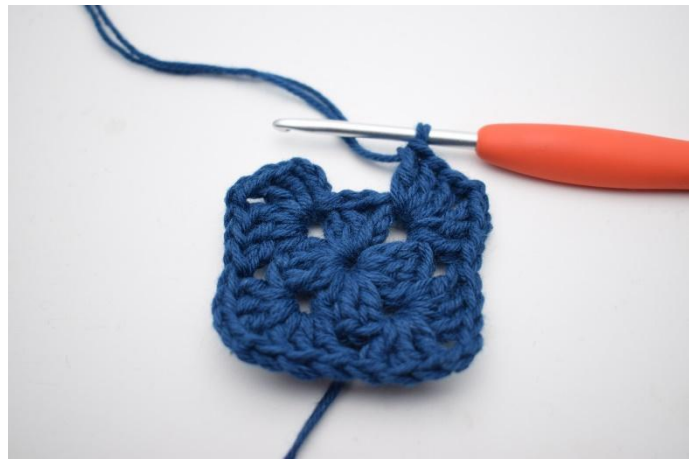
6. Gjenta *til* i alt 3 ganger.