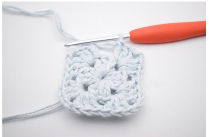
6. Gjenta *til* i alt 3 ganger.