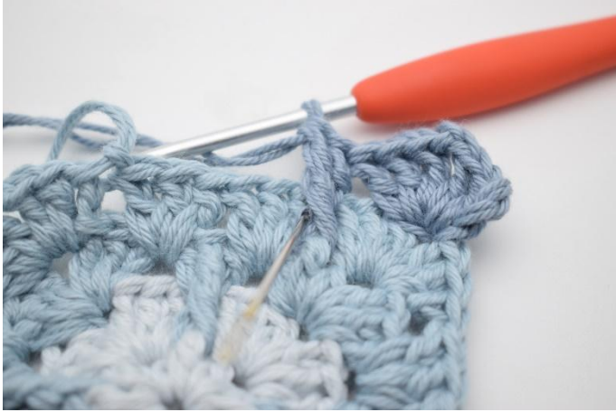
7. Hekle 1 stv til i samme mellomrom.