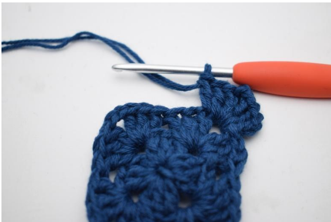
3. Lag 3 lm, hekle 2 stv, 2 lm og 3 stv i lm-buen.