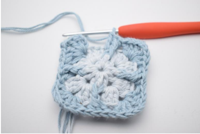
11. Gjenta *til* i alt 3 ganger.