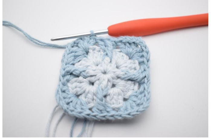
12. Avslutt med 1 km.