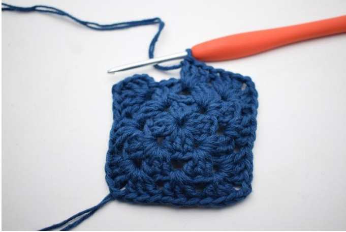
7. Gjenta *til* i alt 3 ganger.