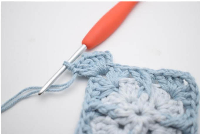
3. Lag 3 lm, hekle 2 stv, 2 lm og 3 stv i lm-buen.