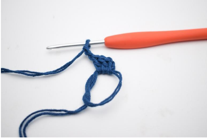
3. og lag 2 lm.