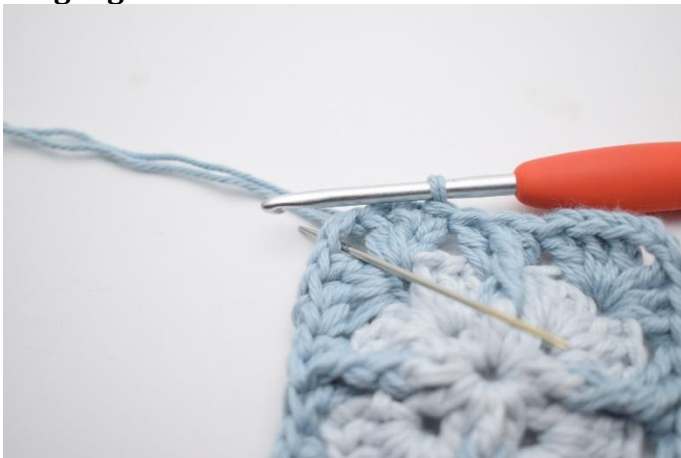
1. Lag km bort til lm-buen.