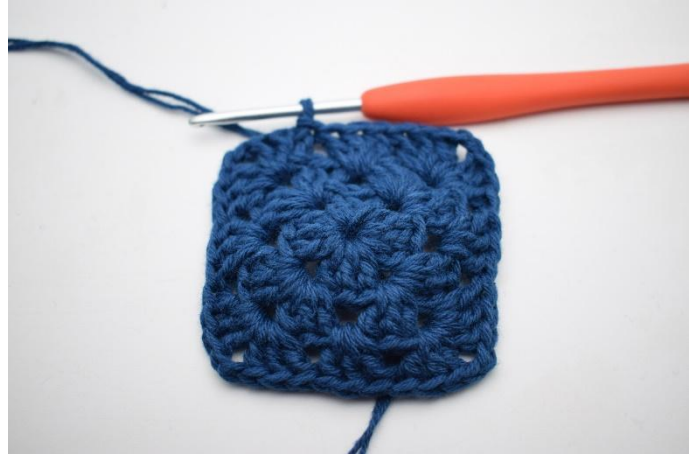
8. Avslutt med 1 km.