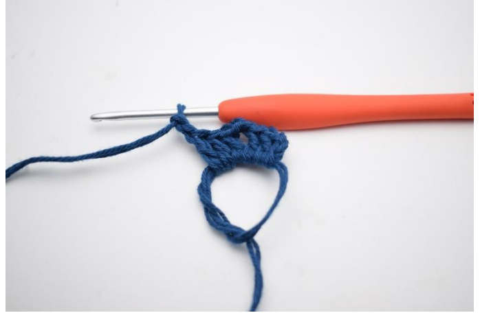
4. Hekle *3 stv og 2 lm*.