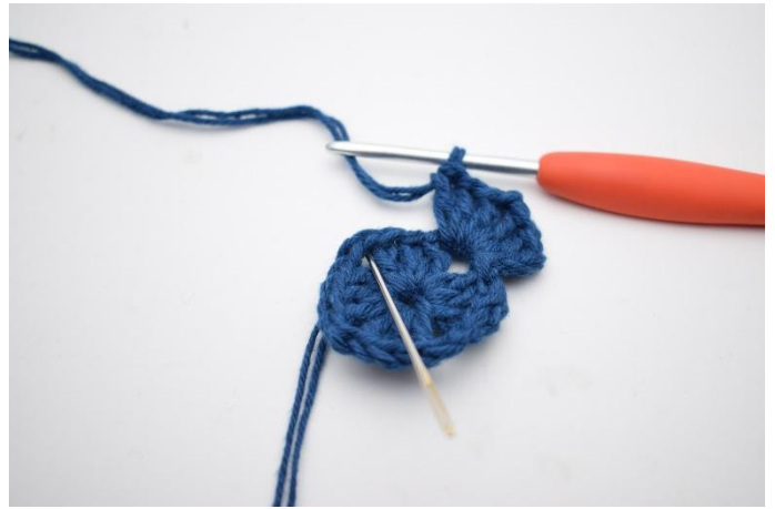
4. Hekle *3 stv, 2 lm og 3 stv i neste lm-bue*.