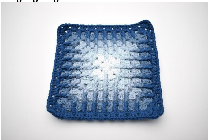
1. Gjenta fremgangsmåten som beskrevet i oppskriften.