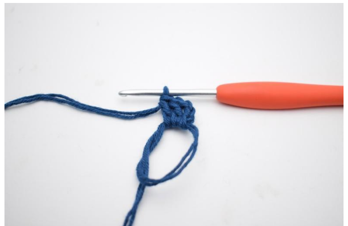
2. hekle 2 stv,