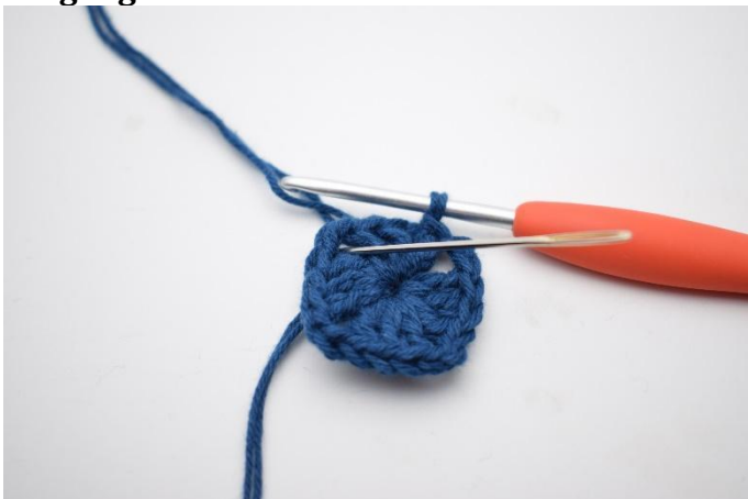
1. Lag km bord til lm-buen.