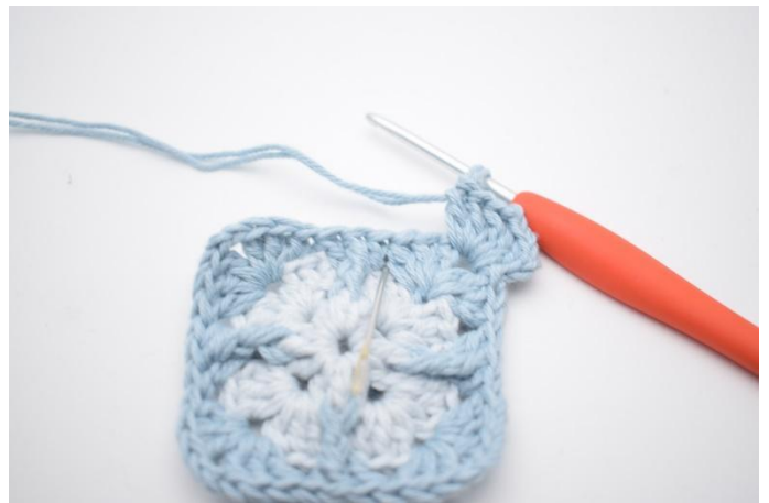
4. I neste mellomrom hekles 3 stv.