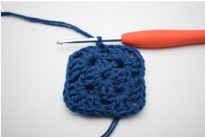
7. Avslutt med 1 km.