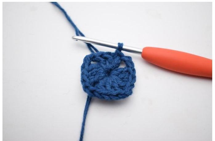
6. Avslutt med 1 km.