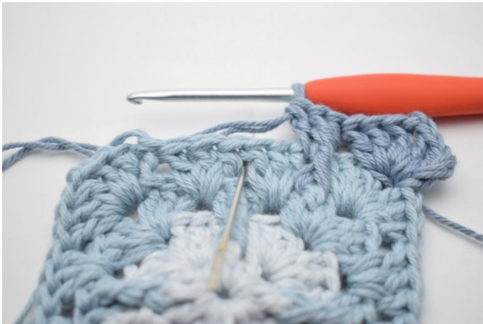
9. Gjenta dette i neste mellomrom.