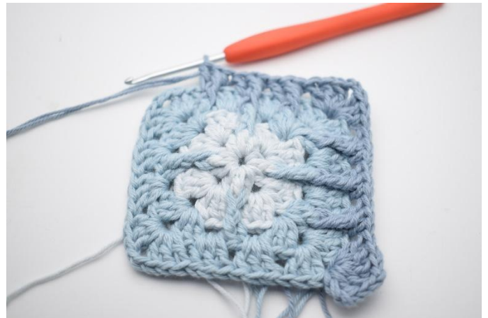
12. Hekle *3 stv, 2 lm og 3 stv i neste lm-bue. I de neste 3 mellomrom hekles 1 stv, 1 D-RstR omkring den midterste m i stv-gruppen fra omgang 3 og 1 stv”.