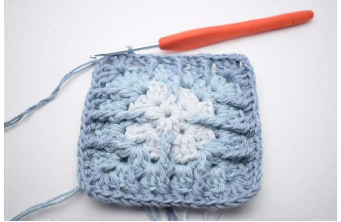
14. Avslutt med 1 km.