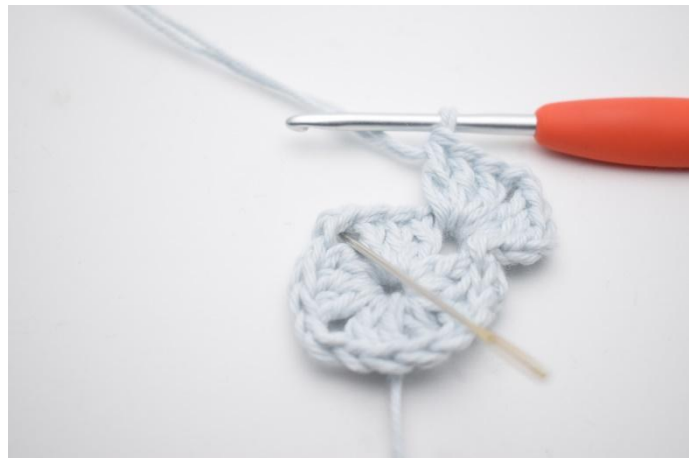
4. Hekle *3 stv, 2 lm og 3 stv i neste lm-bue*.