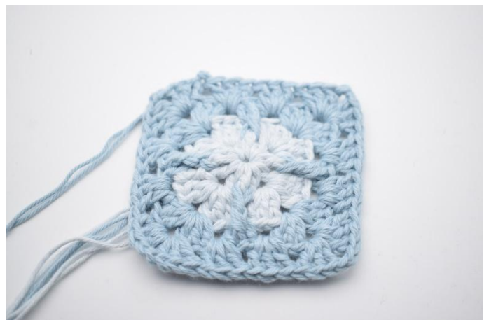
10. Avslutt med 1 km. Klipp av tråden.