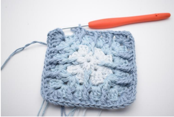
13. Gjenta *til* i alt 3 ganger.