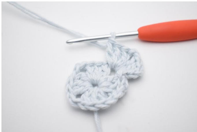
3. Lag 3 lm, hekle 2 stv, 2 lm, 3 stv i lm-buen.