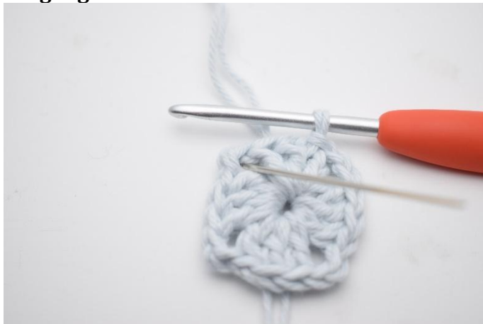
1. Lag km bort til lm-buen.