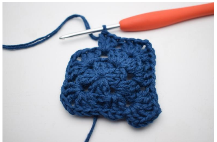
6. Hekle *3 stv, 2 lm og 3 stv i neste lm-bue. Hekle 3 stv i neste mellomrom*.