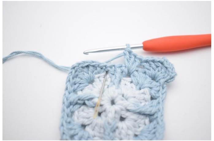
6. Hekle 3 stv i neste mellomrom.