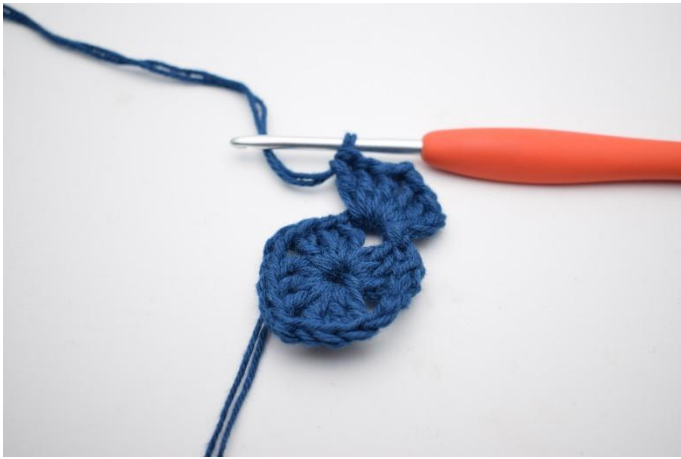
3. Lag 3 lm, hekle 2 stv, 2 lm og 3 stv i lm-buen.