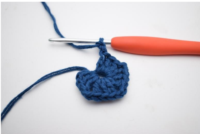
5. Gjenta *til* i alt 3 ganger.