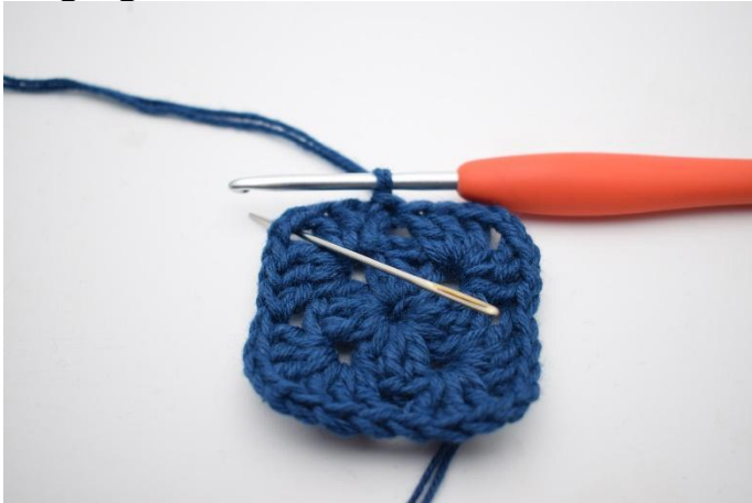
1. Lag km bort til lm-buen.