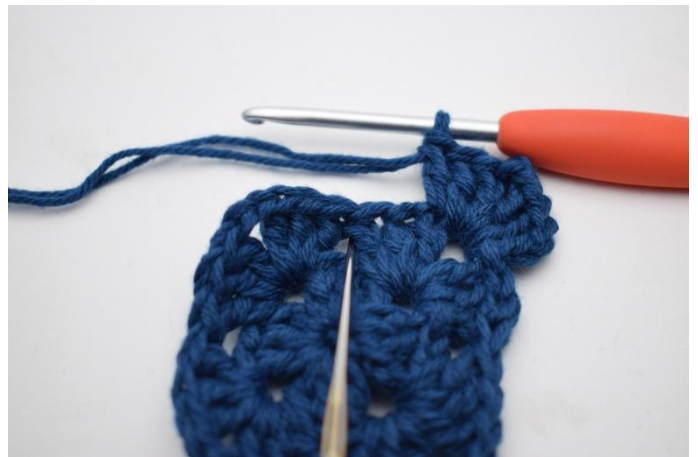
4. Hekle 3 stv i neste mellomrom.