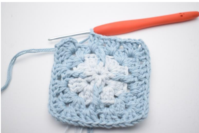
9. Gjenta *til* i alt 3 ganger.