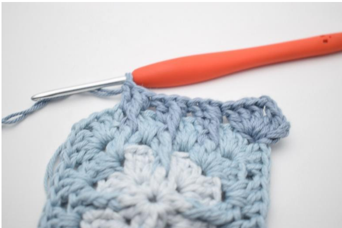
11. Gjenta i det etterfølgende mellomrom.