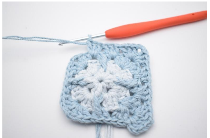
8. Hekle *3 stv, 2 lm og 3 stv i neste lm-bue. I de neste 2 mellomrom hekles 3 stv i samme mellomrom*.