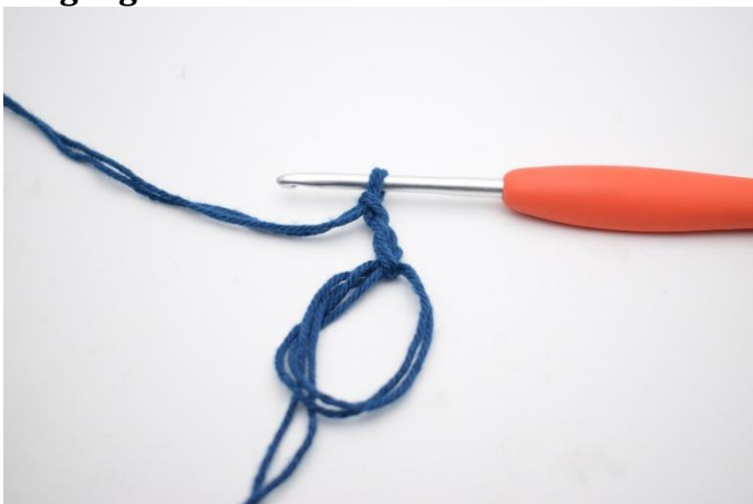
1. Lag en mr. Lag 3 lm,