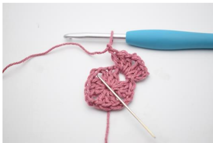
4. Hekle *3 stv, 2 lm, 3 stv og 1 lm i neste lm-bue*.