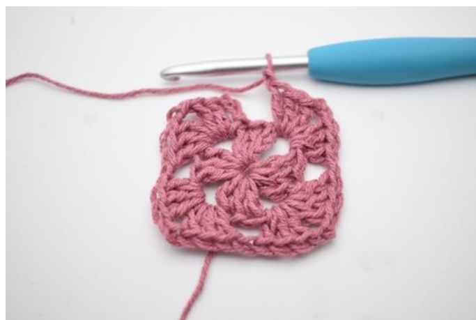
6. Gjenta *til* i alt 3 ganger.