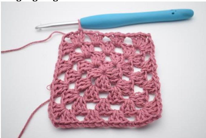
1. Gjenta med denne fremgangsmåten som beskrevet i oppskriften.