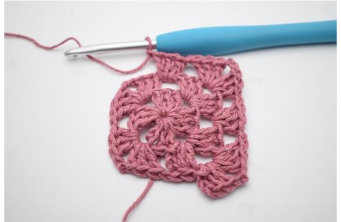
6. Hekle *3 stv, 2 lm, 3 stv og 1 lm i neste lmbue. Hekle 3 stv og 1 lm i neste lmmellomrom*.