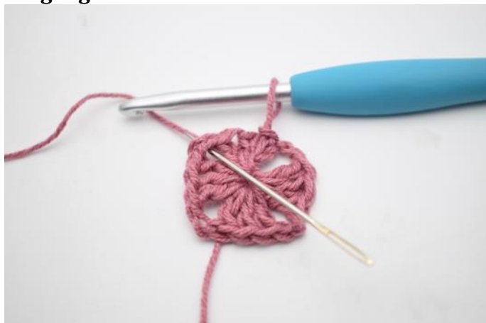
1. Lag km bort til lm-buen.