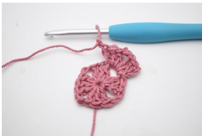
3. Lag 3 lm, hekle 2 stv, 2 lm, 3 stv og 1 lm i lm-buen.