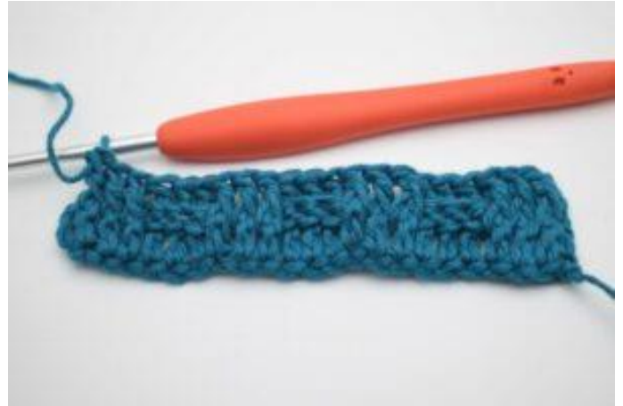
10. Gjenta 3 RstR og 3 RstV vekselvis ut raden. Raden slutter med 3 RstR.