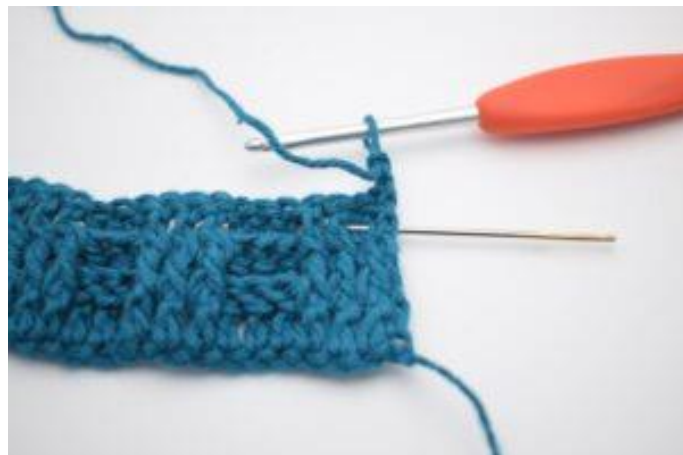
2. Hekle 1 RstV rundt første stv-stolpe.