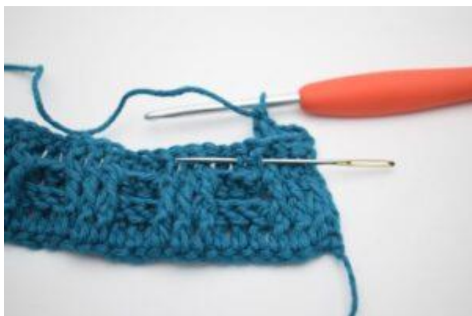
5. Hekle 1 RstR rundt neste stv-stolpe.