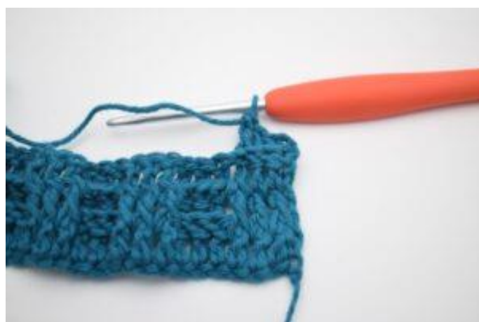
4. Hekle 1 RstV rundt de neste 2 stv-stolpene.