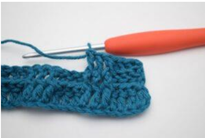
7. Hekle 1 RstR rundt de neste 2 stv-stolpene.