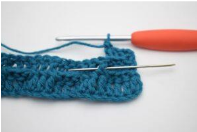
5. Hekle 1 RstR rundt neste stv-stolpe.