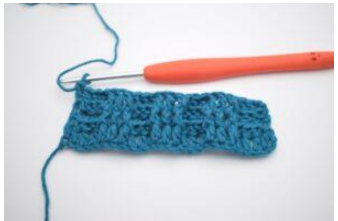
8. Gjenta 3 RstV og 3 RstR vekselvis ut raden. Raden slutter med 3 RstV. I siste m hekles 1 alm. stv.