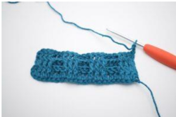
1. Snu med 2 lm.