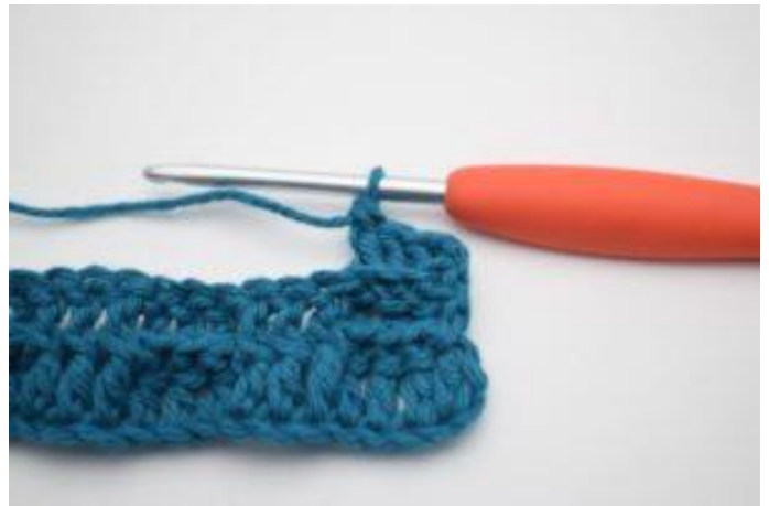
4. Hekle 1 RstV rundt de neste 2 stv-stolpene.