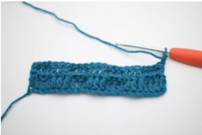
1. Snu med 2 lm.