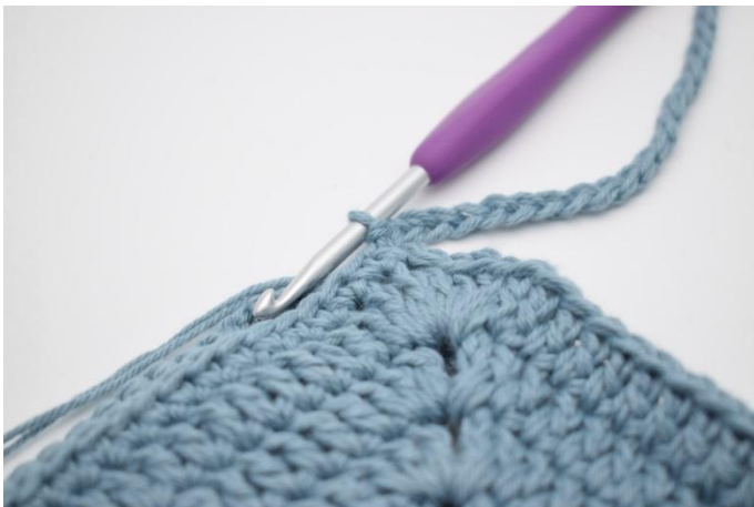
9. Avslutt med 1 km i lm fra omgangens start.