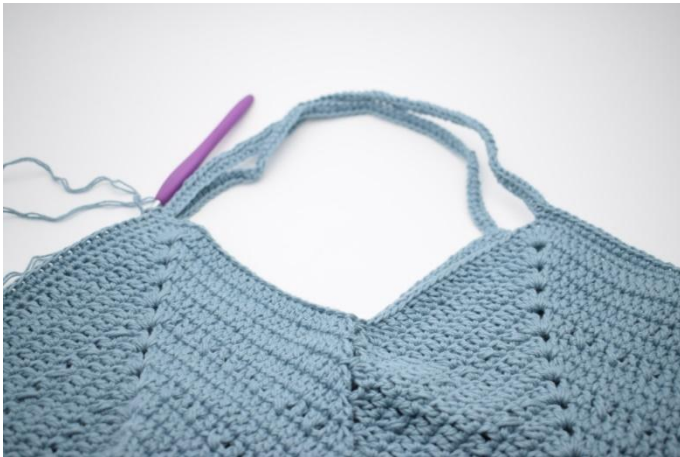
3. Avslutt med 1 km.