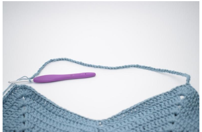
8. Lag 70 lm og hopp over til neste "spiss".