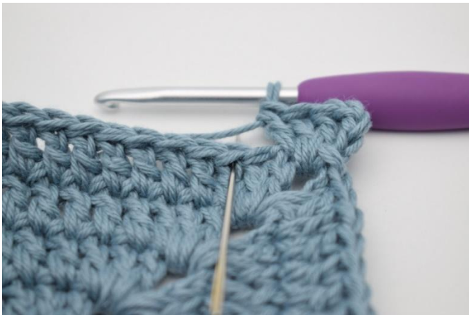
3. Hopp over 1 m og hekle 1 stv i neste m.