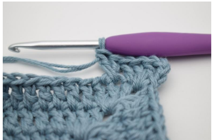
6. Slik. Det er nå dannet et "kryss".