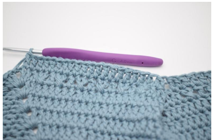
6. Hekle 1 stv i de neste 19 m.