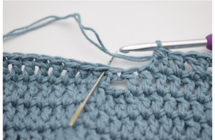
10. Hopp over 2 m.