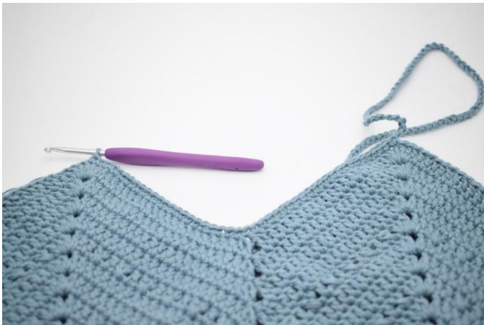
7. Hekle fm i de neste 46 m.