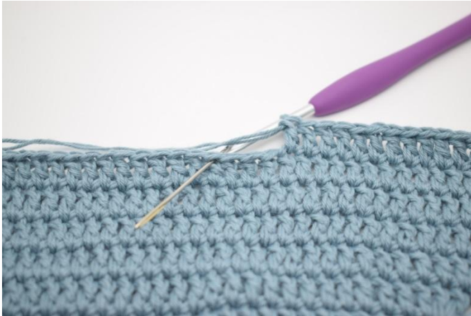
3. Hopp over 3 m,