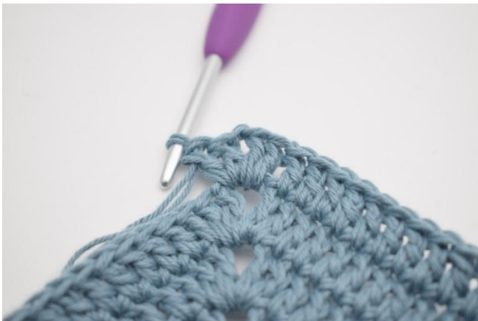
5. Hekle 2 stv, 2 lm og 2 stv i neste lm-bue*.