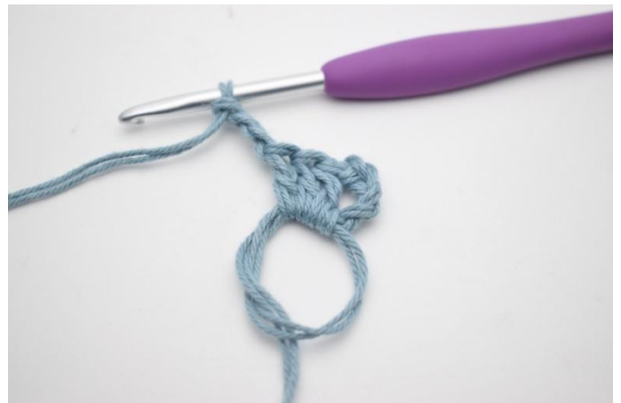
2. Hekle *3 stv og 3 lm*.