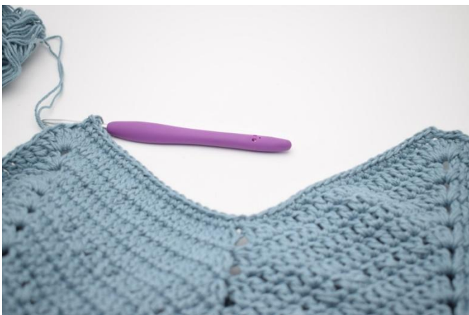
3. Lag 1 lm. Hekle fm i de neste 47 m.