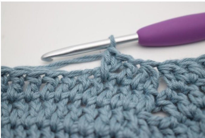
13. Hopp over 1 m og hekle 1 stv. Hekle 1 stv i m som nettopp ble hoppet over.