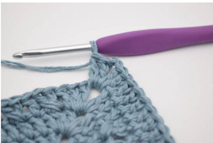
7. Hekle 2 stv, 2 lm og 2 stv i neste lm-bue.