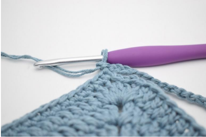
1. Lag 1 lm.