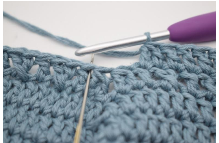
4. Hopp over 2 m og hekle 2 stv sm.