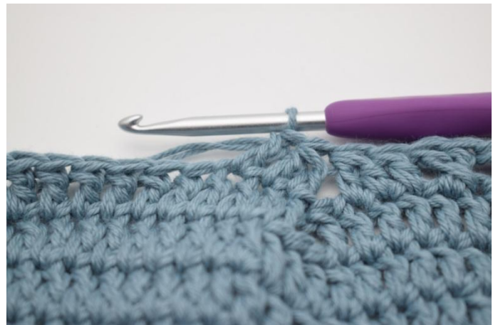
12. Hekle 1 stv i neste m.