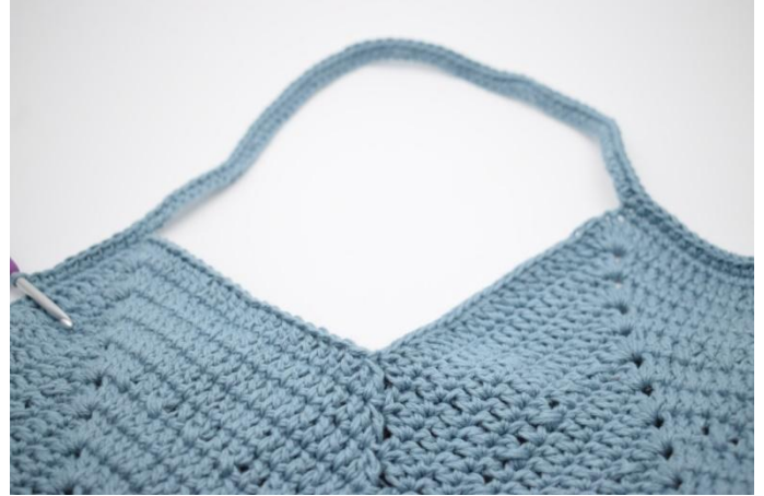
2. Hekle fm i alle masker og luftmasker omgangen rundt.