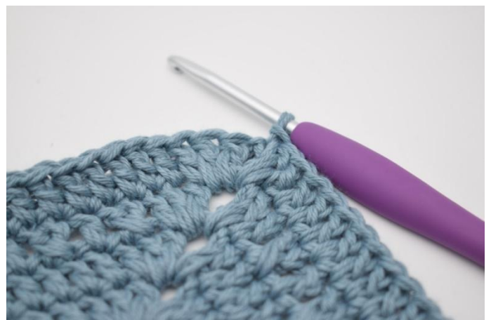
8. Gjenta på alle 4 sider. Hekle 1 stv i lm-buen fra omgangens start. Avslutt med 1 km i 3. lm.