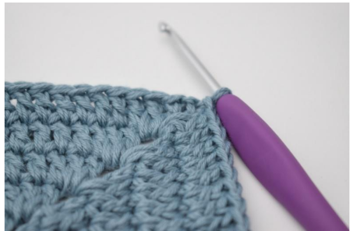
6. Gjenta på alle 4 sider. Hekle 1 stv i lm-buen fra omgangens start. Avslutt med 1 km i 3. lm.