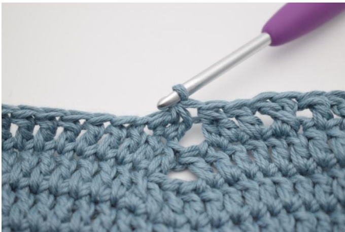
11. Hekle 2 stv sm.