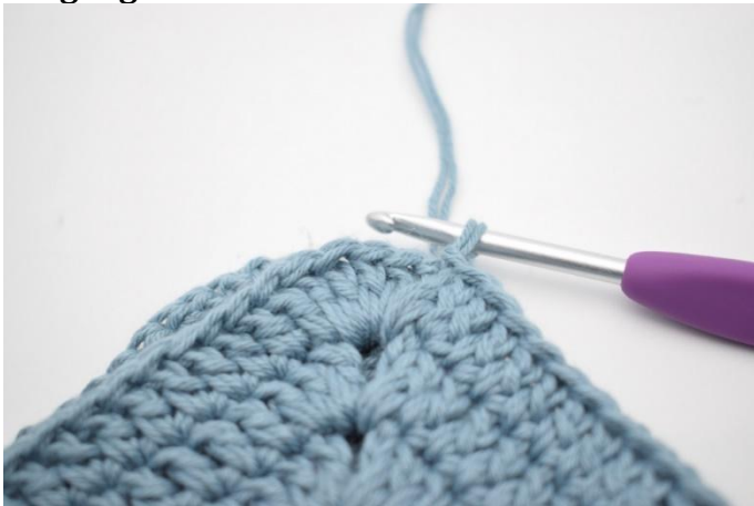
1. Lag km i de 3 neste m.