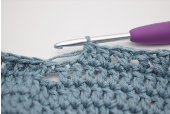
9. Hekle 2 stv sm.