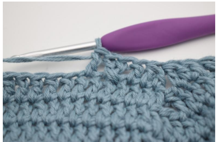
14. Hekle 1 stv i neste m.