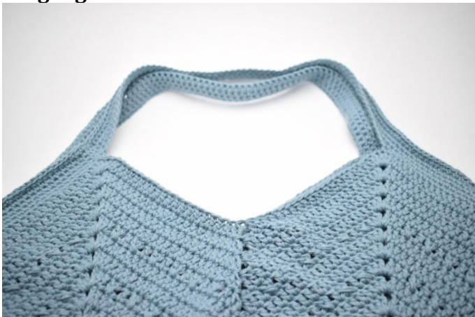
1. Lag 1 lm og hekle fm omgangen rundt. Avslutt med 1 km. Gjenta dette i alt 3 ganger.