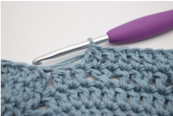
3. Hekle 2 stv sm.