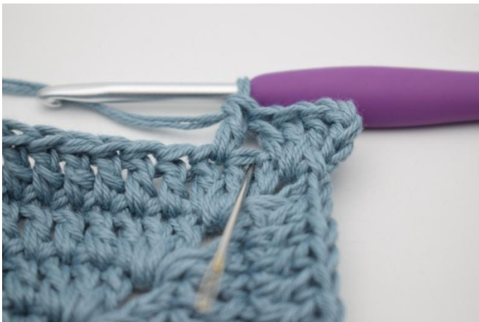
5. Hekle 1 stv i m som nettopp ble hoppet over.