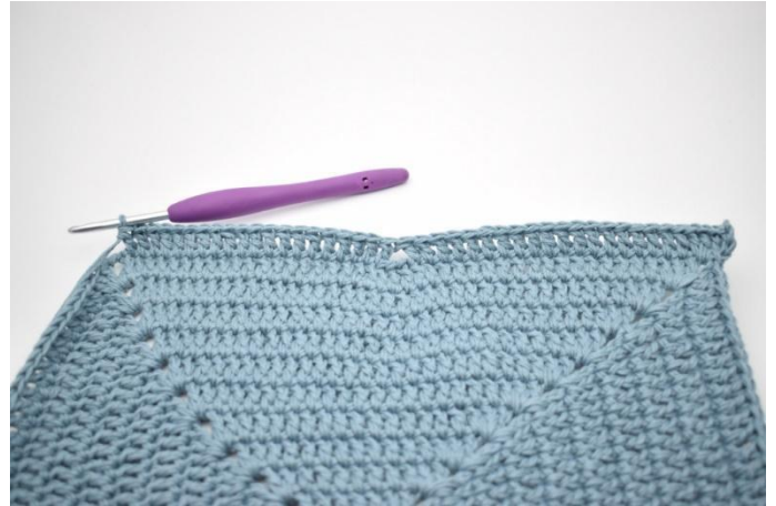
4. og hekle 1 stv i de neste 20 m.