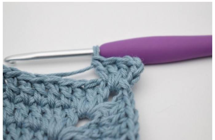
2. Hekle 1 stv i første m.