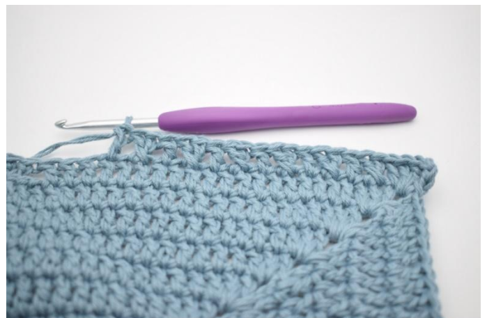
8. *Hopp over 1 m og hekle 1 stv. Hekle 1 stv i m som nettopp ble hoppet over. Hekle 1 stv i neste m*. Gjenta *til* 6 ganger.