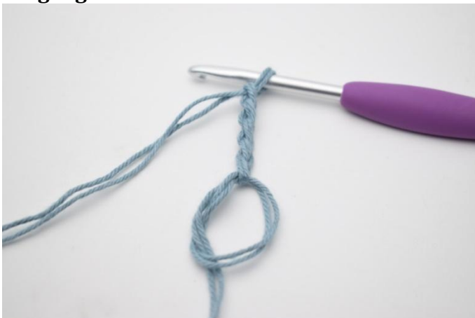
1. Lag en mr. Lag 5 lm.