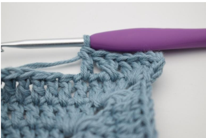
7. Hekle 1 stv i neste m.