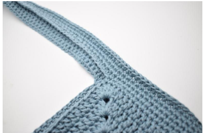
2. Klipp av garnet og fest ender.