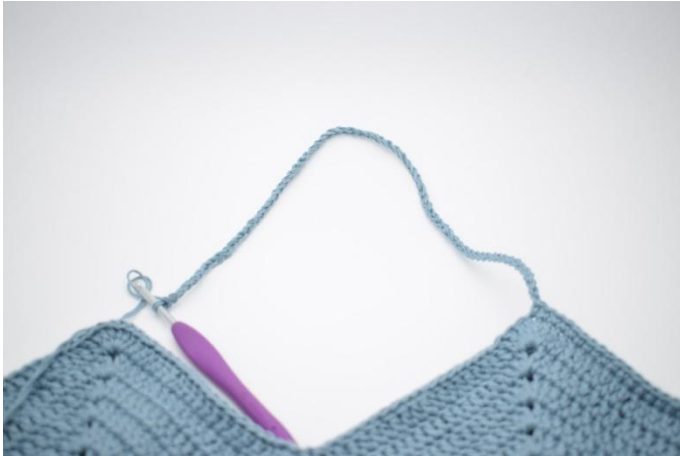
5. Lag 70 lm og hopp over til neste "spiss". I den 4. stv av de 6 stv i lm-buen hekles 1 fm.