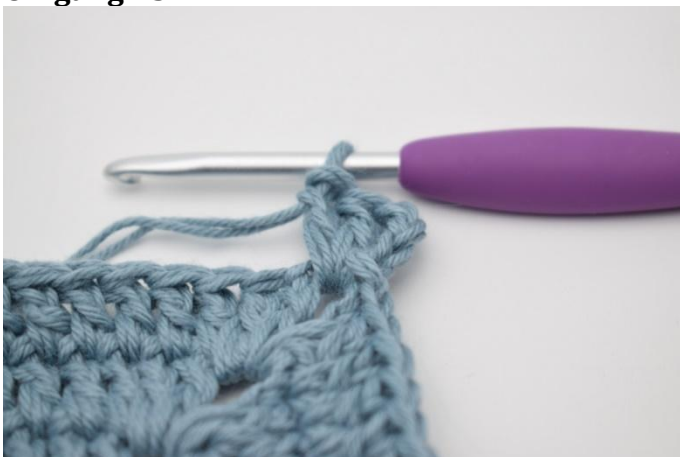
1. Lag 1 km i lm-buen. Lag 4 lm. Hekle 2 stv i lm-buen.