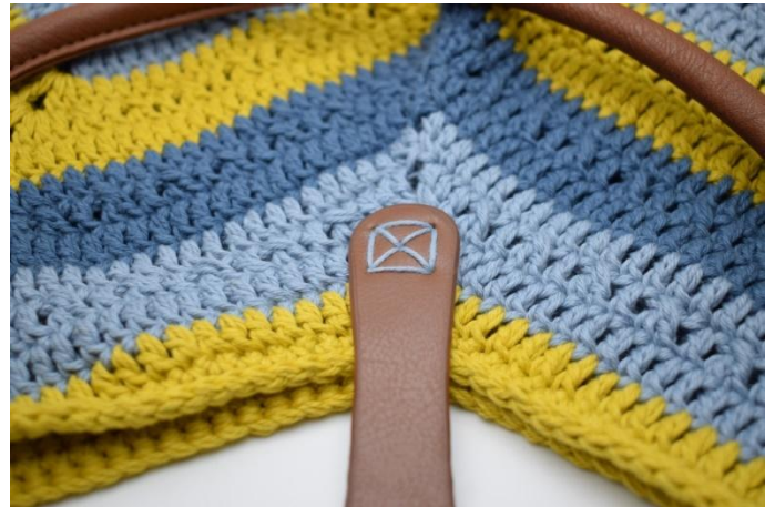
Sy "flappen fast på den ene side på midten.