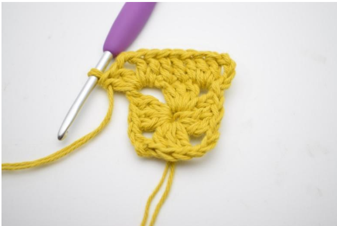
3. Hekle *1 stv i de neste 3 m, 2 stv, 2 lm og 2 stv i neste lm-bue”.