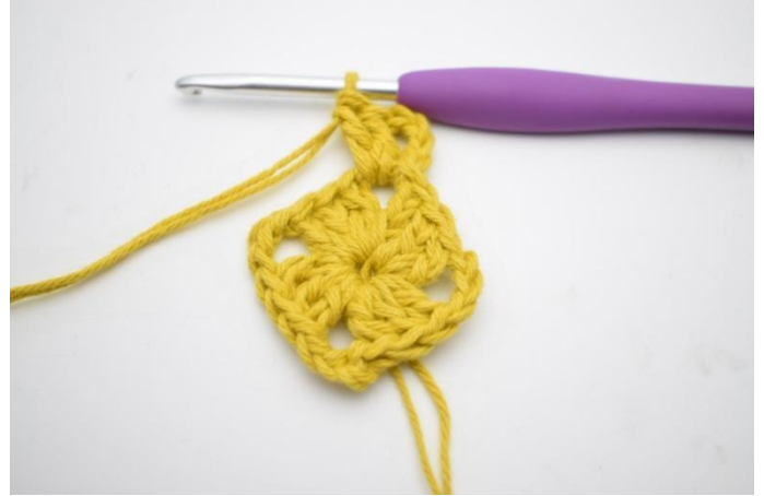
2. Lag 4 lm. Hekle 2 stv i lm-buen.