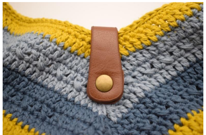
Vesken kan nå lukkes med knappen.