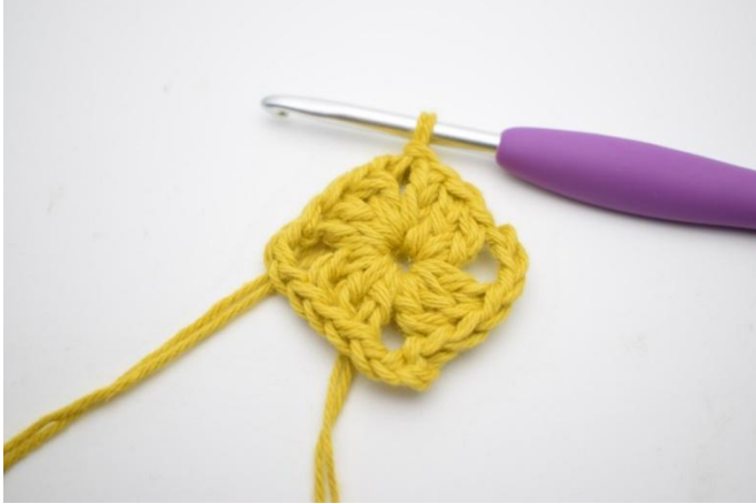
1. Lag 1 km i lm-buen.