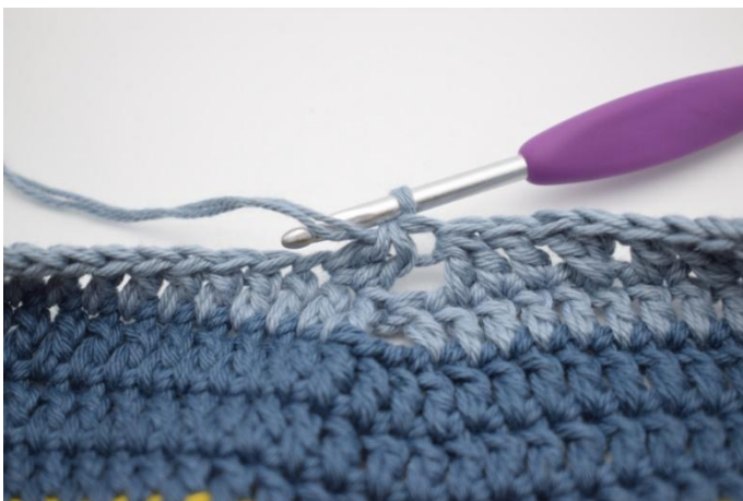
11. Hekle 2 stv sm.