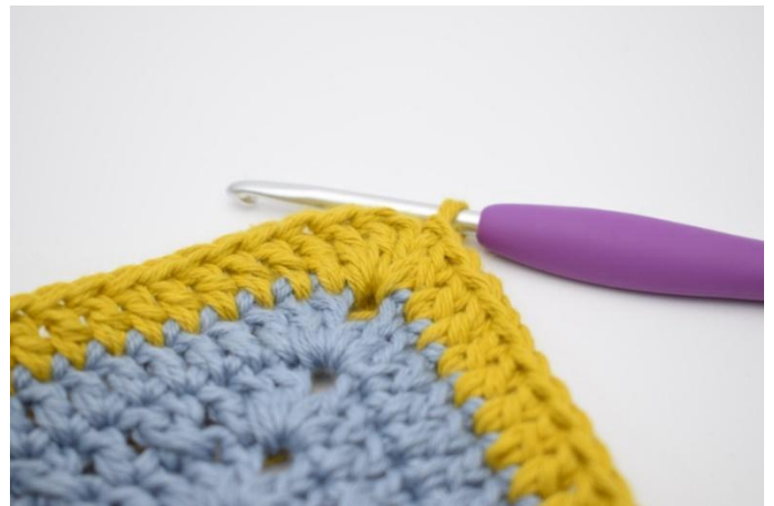
8. Gjenta på alle 4 sider. Hekle 1 stv i lm-buen fra omgangens start. Avslutt med 1 km i 3. lm.