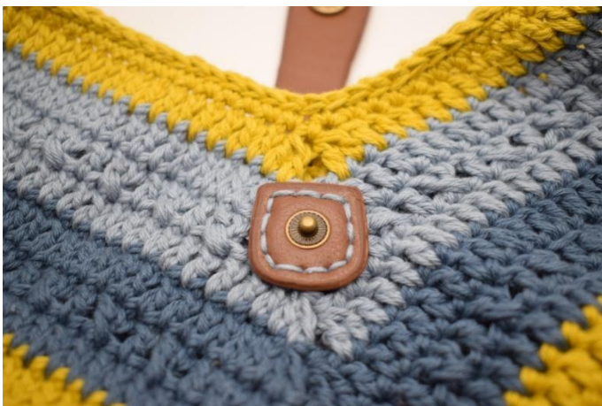
Sy den andre flapp delen fast på forsiden.