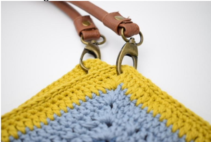
Montere hankene med karabinkrokene i "Spissene"