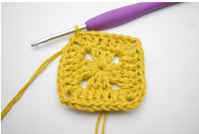
5. Hekle 1 stv i de neste 3 m og 1 stv i lm-buen fra omgangens start. Avslutt med 1 km i 3. lm.