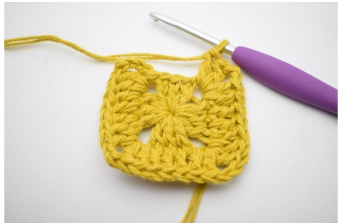
4. Gjenta *til* i alt 3 ganger.