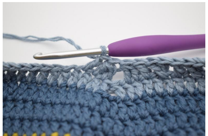
12. Hekle 1 stv i neste m.