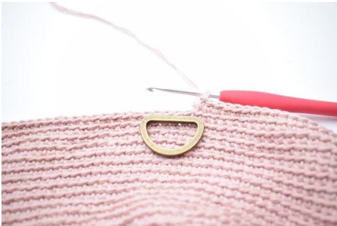
5. Hekle d-ringen fast med fm i gjennom begge ledd bort over 5 masker.