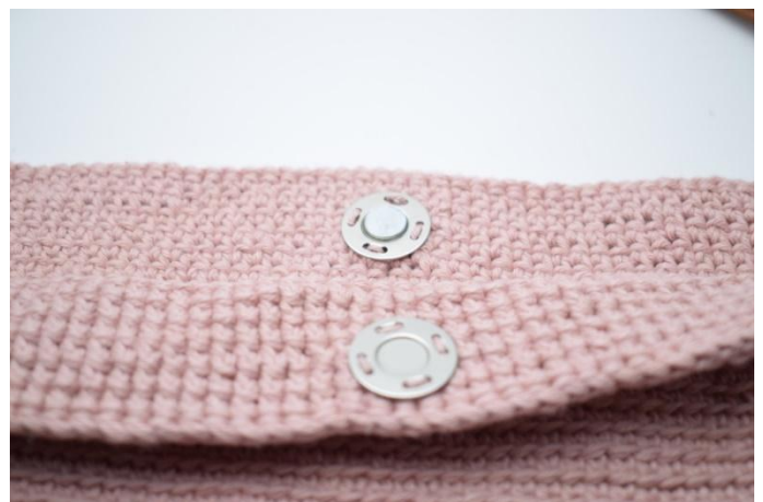
10. Sy fast trykklåsen på innsiden i midten.