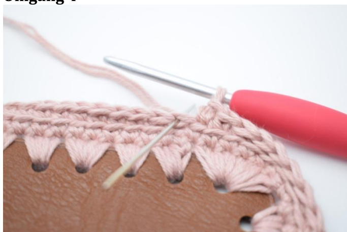
1. Gjenta fremgangsmåten som omgang 3. Hekle 1 fm i bml.