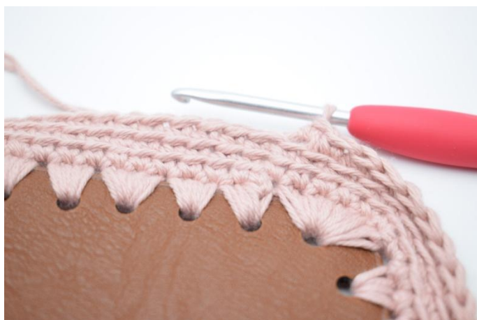
3. Gjenta omgangen rundt.