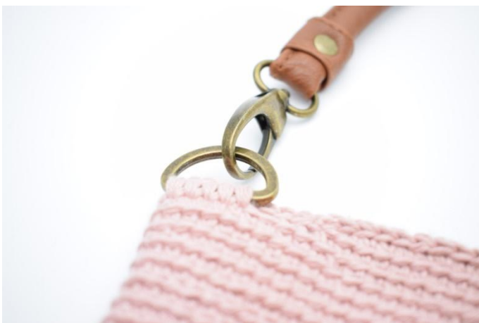
9. Hasp hankene på d-ringene.