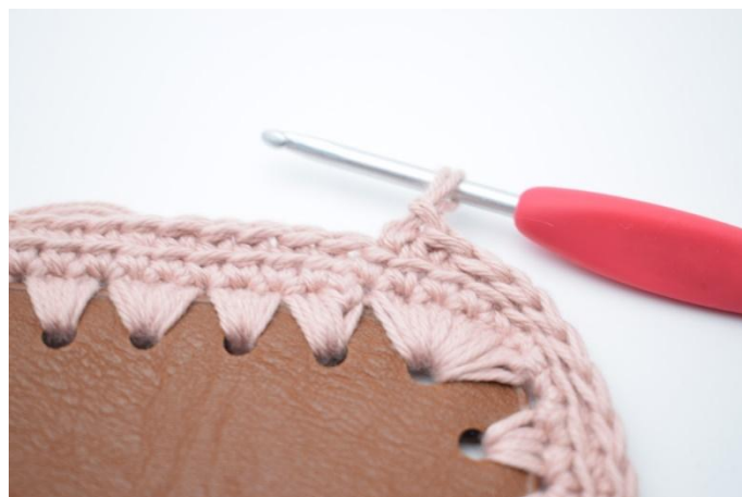
6. Gjenta omgangen rundt.