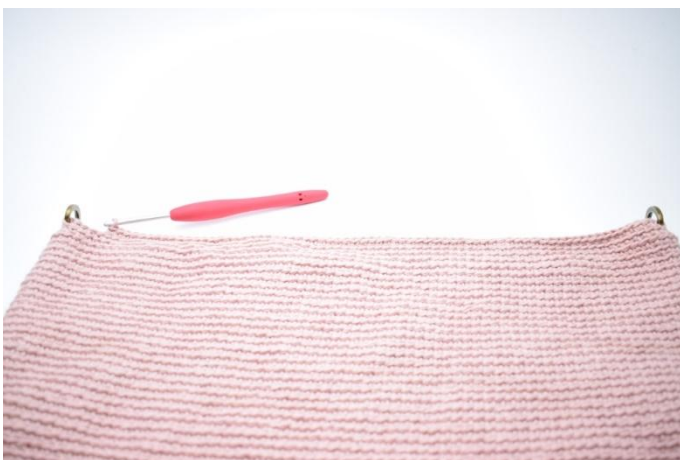
7. Hekle fm i bml frem til omgangens start.