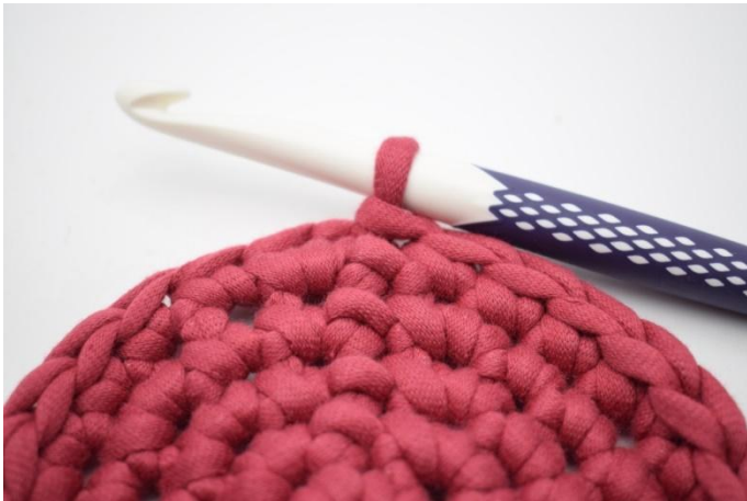
1. Her din bunn nettopp avsluttet.