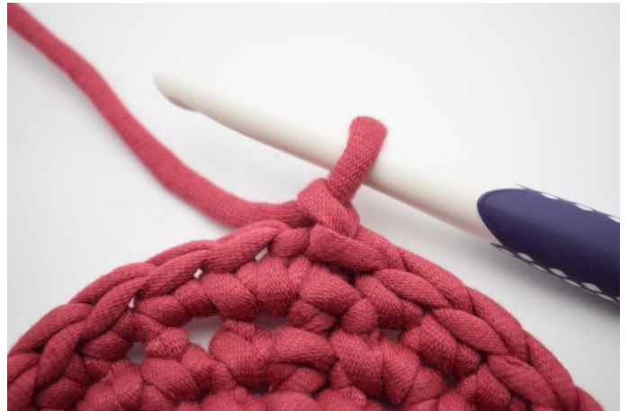
2. Lag 1 lm.