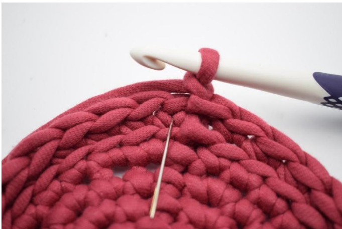
9. Denne omgangen hekles med ks. Ks er en alm. fm men som hekles i "V"et i stedet for som normalt i masken. Nålen her markerer det "V" din ks skal hekles i.