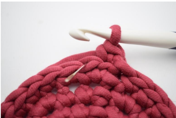
5. Hekle 1 fm i bml i neste m. Nålen her markerer det leddet som din fm skal hekles i.