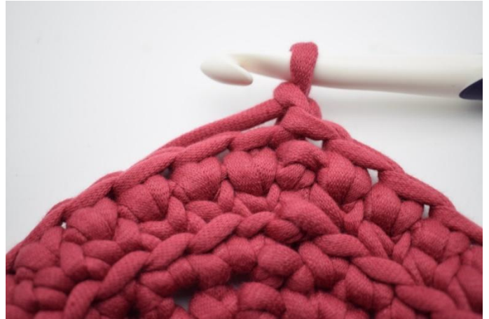
14. Slik gjentas omgangene. Lag 1 lm.