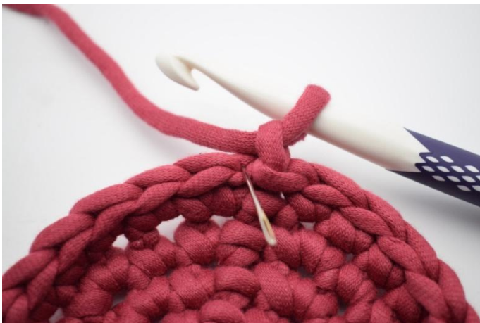
3. Denne omgangen hekles som fm i bml. Nålen her markerer det leddet som din første fm skal hekles i.