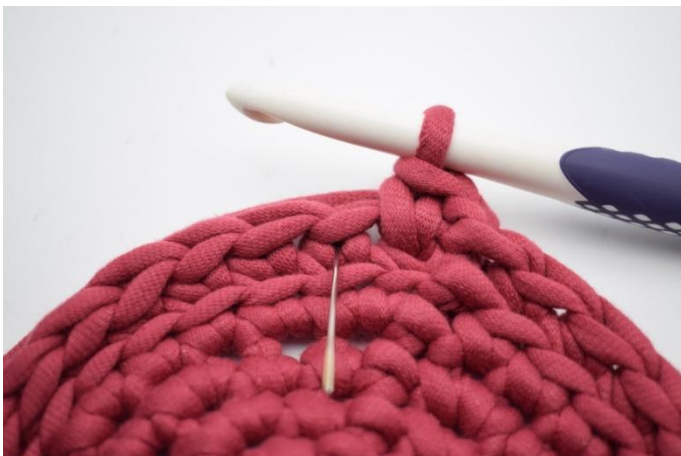
11. Hekle 1 ks i neste "V". Nålen her markerer hvor din ks skal hekles.