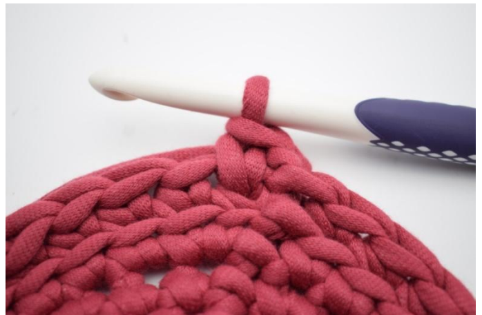
10. Slik. Det er nå heklet en ks.