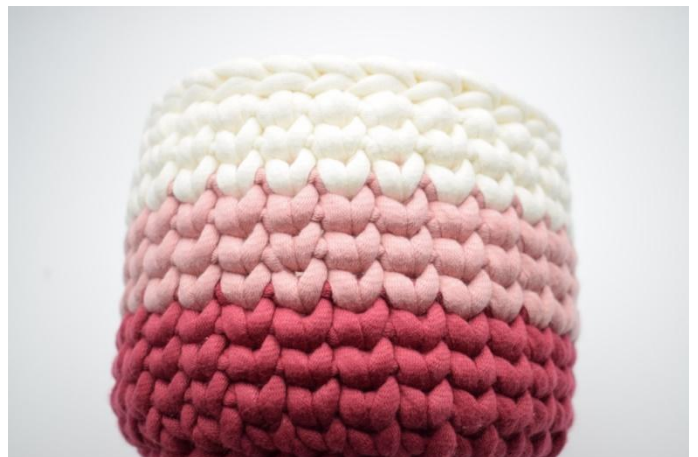
18. Gjenta denne fremgangsmåten som beskrevet i oppskriften med fargeskift. Avslutt med 1 omgang km. Klipp av garnet og fest ender.