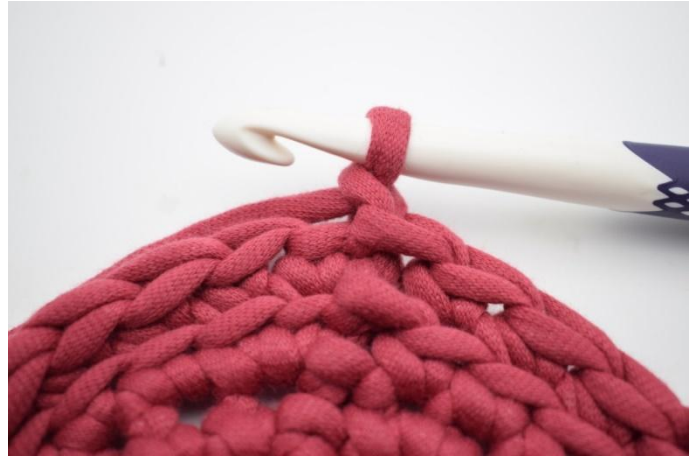
8. Lag 1 lm.