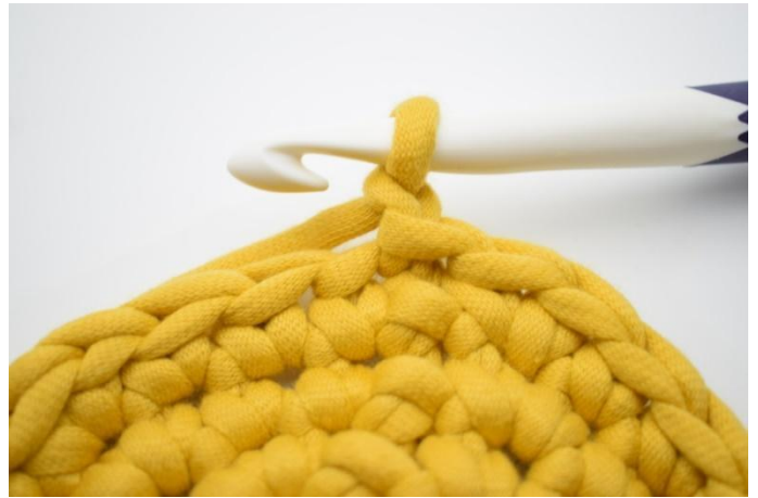
2. Lag 1 lm.