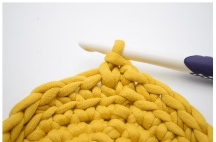
10. Slik. Det er nå hekle en ks.