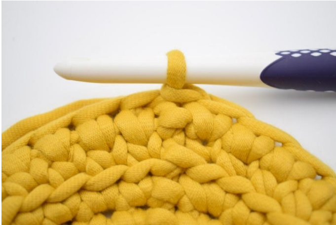
13. Gjenta omgangen rundt og avslutt med 1 km.