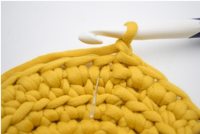
15. Hekle 1 ks i første "V".