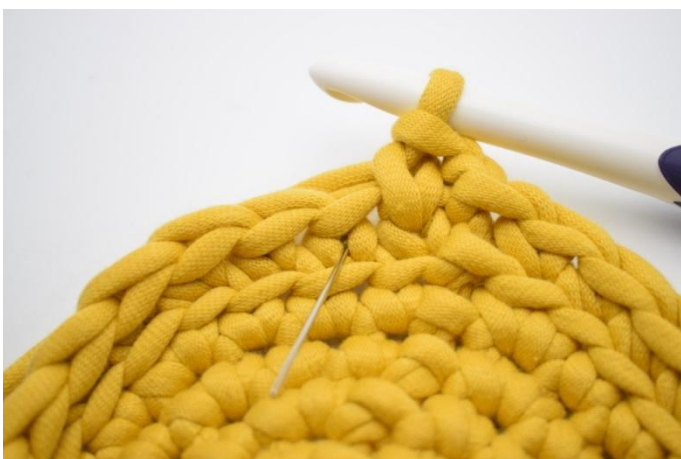
11. Hekle 1 ks i neste "V". Nålen her markerer hvor din ks skal hekles.