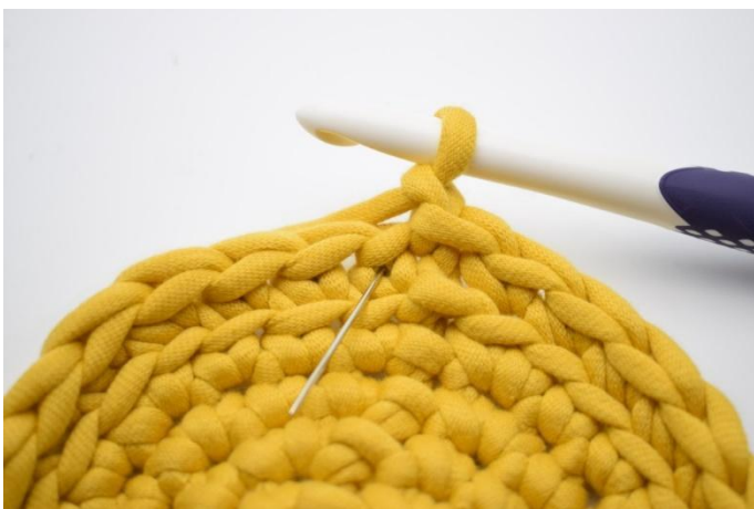
9. Denne omgangen hekles med ks. Ks er en alm. fm men som hekles i "V"et i stedet for som normalt i masken. Nålen her markerer det "V" din ks skal hekles i.