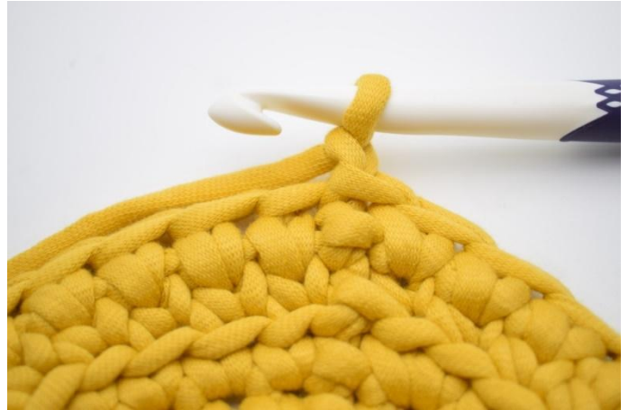
14. Slik gjentaes omgangene. Lag 1 lm.