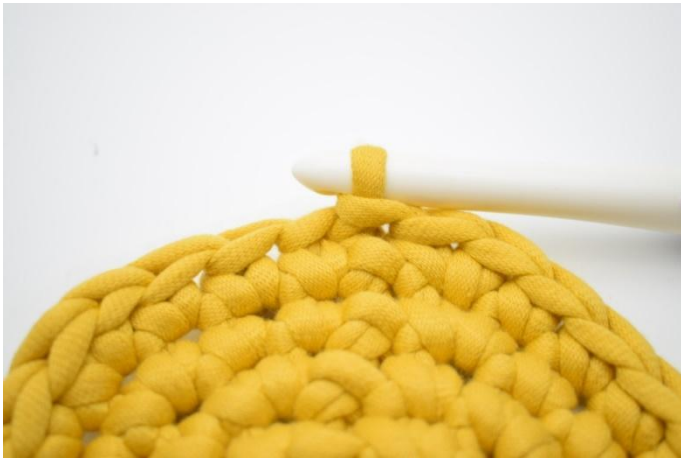
1. Her er din bunn nettopp avsluttet.