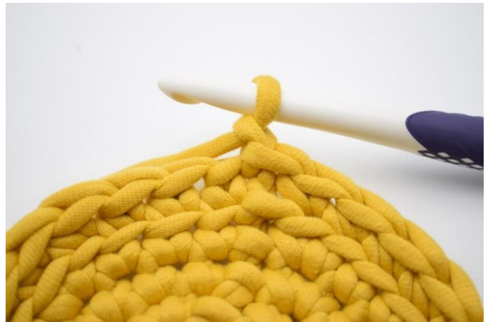
8. Lag 1 lm.