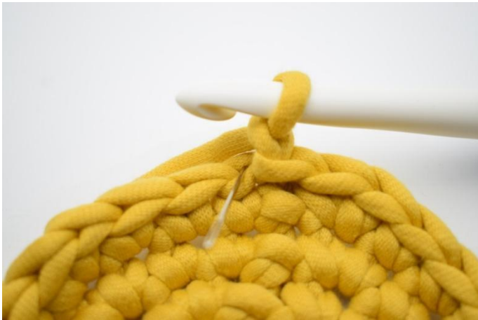
3. Denne omgang hekles som fm i bml. Nålen her markerer det leddet din første fm skal hekles i.