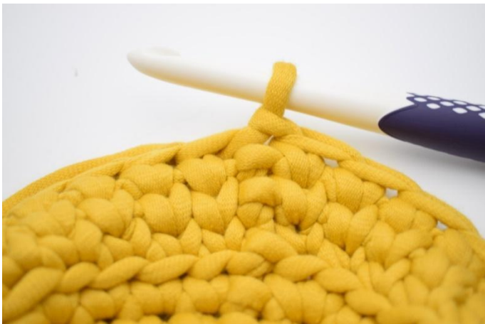
17. Gjenta omgangen rundt og avslutt med 1 km.