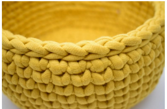
18. Gjenta denne fremgangsmåten som beskrevet i oppskriften. Avslutt med 1 omgang km. Klipp av garnet og fest ender.