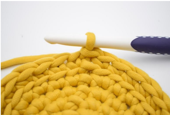
7. Gjenta omgangen rundt og avslutt med 1 km.