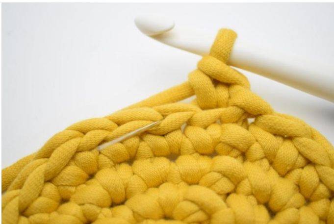
5. Hekle 1 fm i bml i neste m. Nålen her markerer det leddet som din fm skal hekles i.