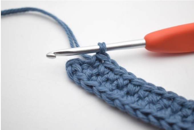
7. I siste lm hekles 4 fm.