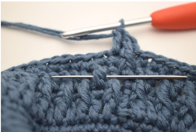
5. Hekle 1 RdstR rundt neste stv-stolpe.