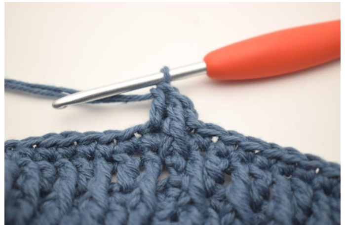
4. Hekle 1 stv i neste m.