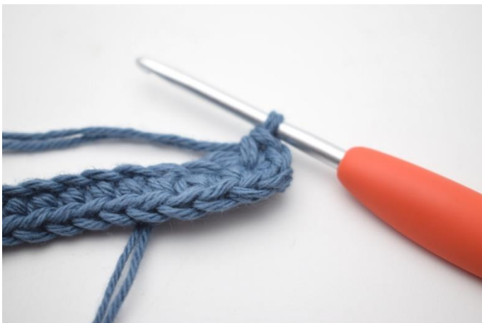
5. I siste m hekles 4 fm.