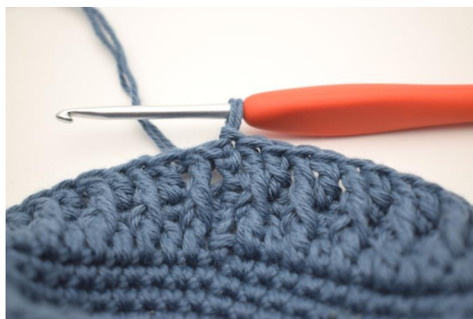
8. Gjenta "til" omgangen rundt. Avslutt med 1 kjm i 3. lm fra omgangens begynnelse. (92)