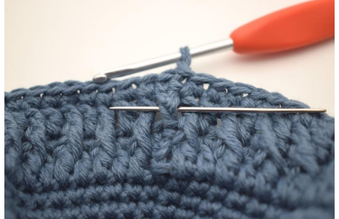
2. Hekle 1 RdstR rundt første stv-stolpe.