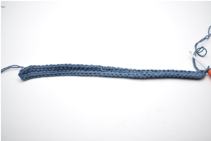
Omgang 2 - 9