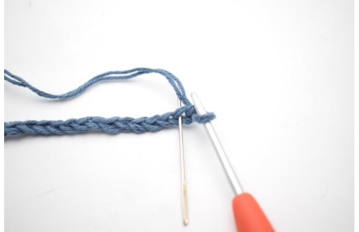
2. I 2. lm fra nålen hekles 1 fm.