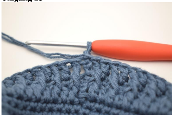
1. Lag 1 lm.