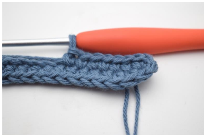
6. Deretter hekles det på den motsatte siden av lm-raden din. Hekle 1 fm i de neste 42 lm.