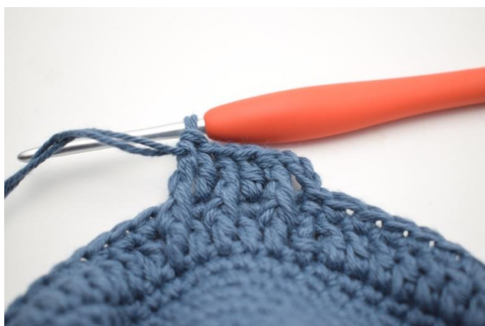
7. "Hekle 1 stv i neste maske, 1 RdstR rundt neste stv under forrige omgang."