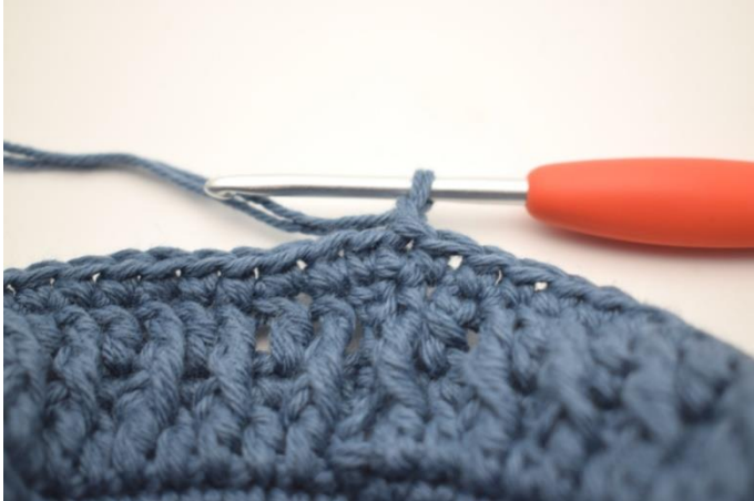
1. Lag 1 lm.