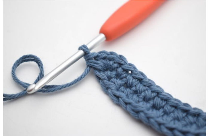
8. Slik. (92)