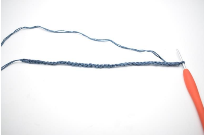
1. Legg opp 44 lm.