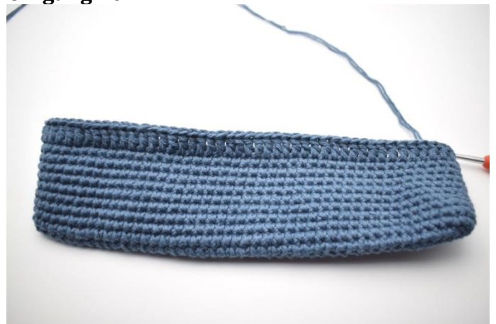
1. Lag 3 lm (erstatte 1.stv). Hekle stv omgangen rundt. Avslutt med 1 kjm. (92)