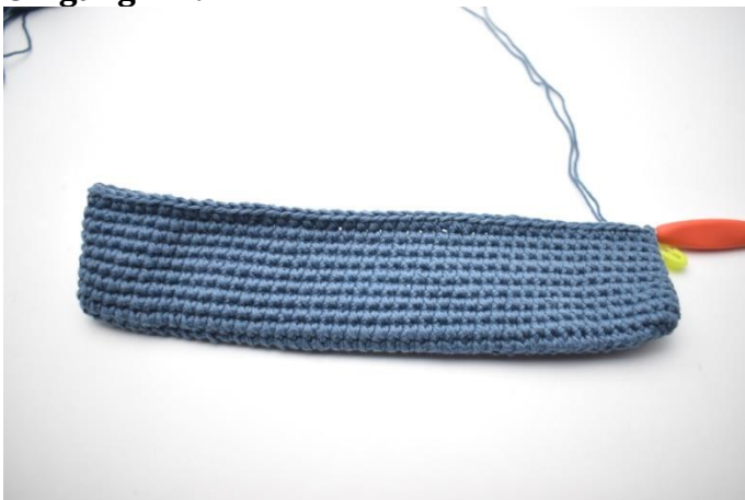
1. Gjenta omgang 2 til du har i alt 9 omganger med fm. Siste omgang avsluttes med 1 kjm.