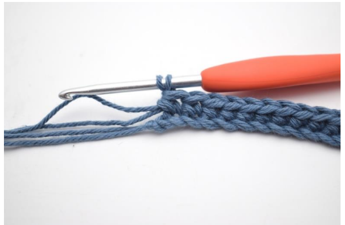
4. Hekle 1 fm i de neste 41 m.