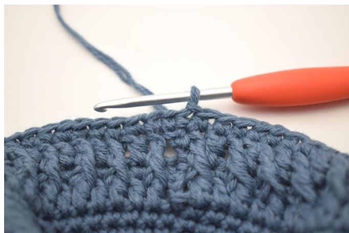
2. Hekle fm omgangen rundt og avslutt med 1 kjm. (92)