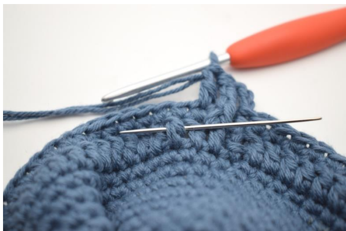
5. Hekle 1 RdstR rundt neste stv-stolpe.