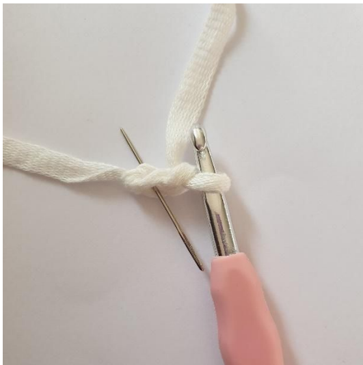
1. Lag 2 lm, start i 2. lm fra nålen.

Avslutt med 2 kjm. Klipp av garnet og fest endene.