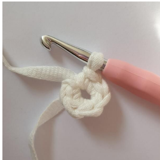
2. Hekle 6 fm i 2.lm fra nålen.