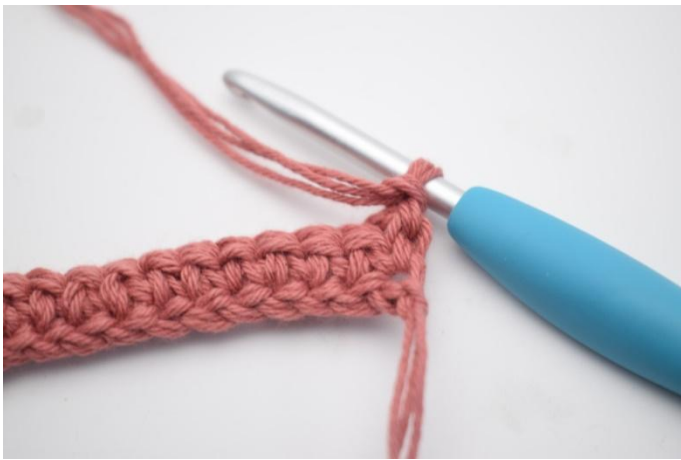
7. Vend med 1 lm.