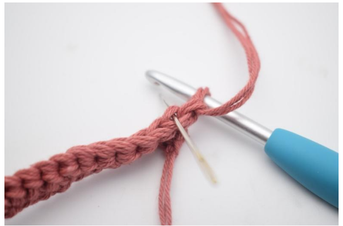
8. Fra nå av hekles det kun i bakerste maskeledd. Hekle 1 fm i bml i neste m. Nålen her markerer hvor din fm skal hekles.