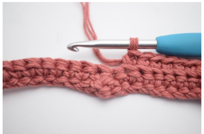
10. Hekle fm i bml i de neste 31 m.