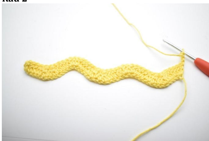
1. Vend med 3 lm.