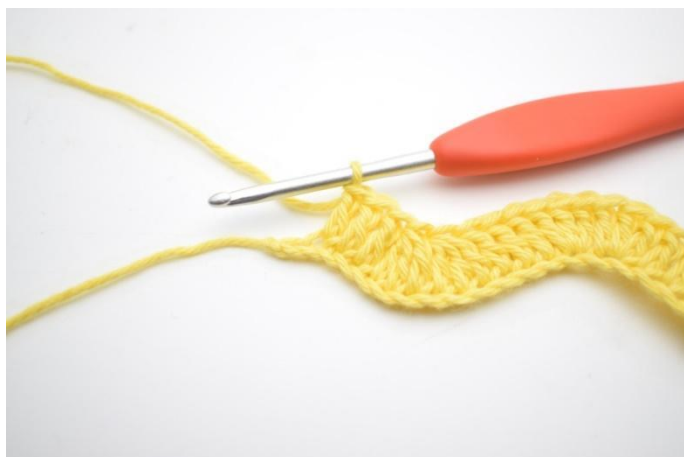
13. Hekle 1 stv i de neste 3 lm.