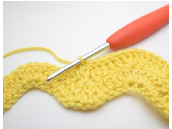
10. Hekle 1 stv i de neste 3 m. *Hekle 3 stv sm over de neste 3 m*. Gjenta *til* i alt 2 ganger.