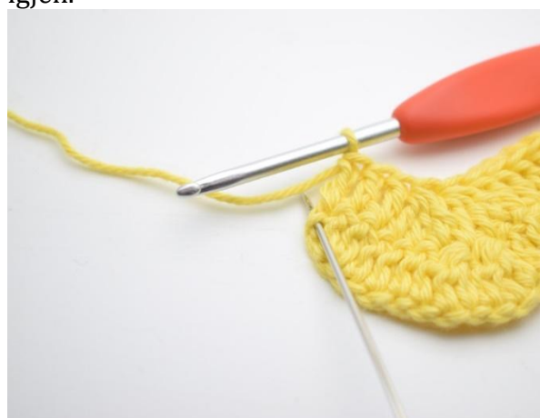
14. I siste m hekles 3 stv.