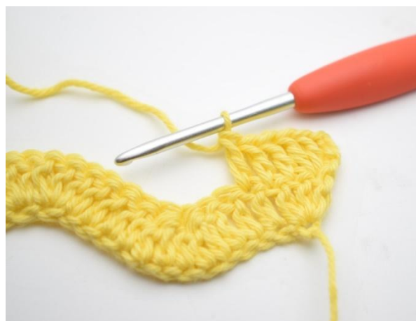
4. Hekle 1 stv i de neste 3 m.