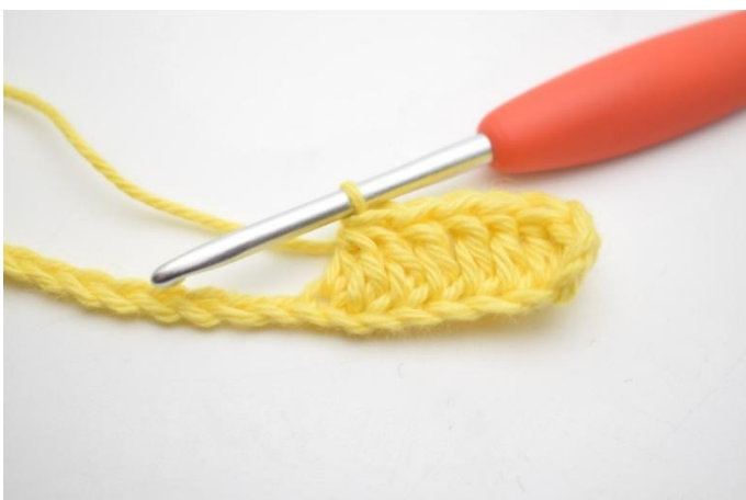
5. Hekle 3 stv sm over de neste 3 lm. (Det betyr at du skal hekle 3 stv sammen til 1)