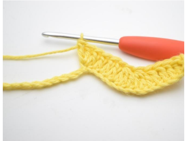
8. Hekle 3 stv i neste lm.