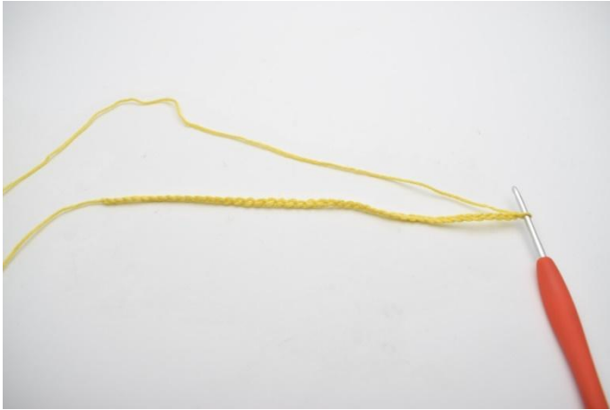
1. Lag opp 72 lm.