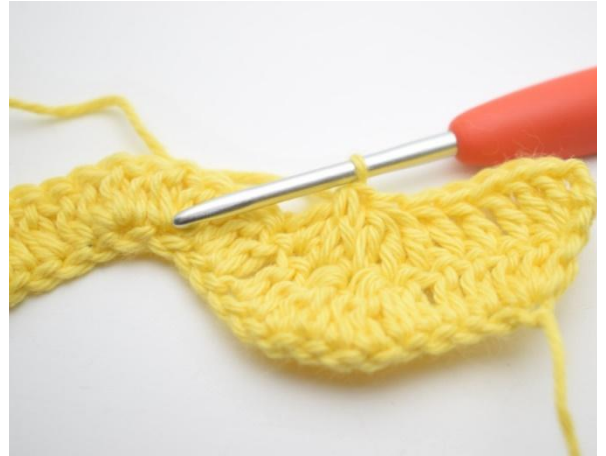
6. Gjenta og hekle 3 stv sm over de neste 3 m.