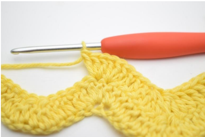
9. Gjenta og hekle 3 stv i neste m.