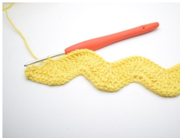
12. Slik gjentas raden ut til du har 4 lm igjen.