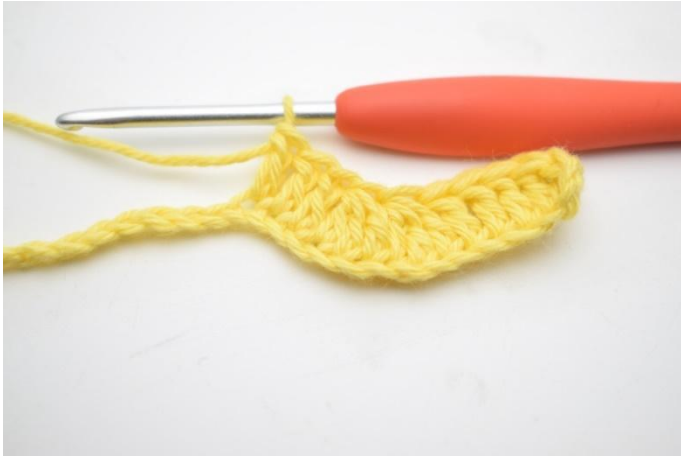
7. Hekle 1 stv i de neste 3 lm.