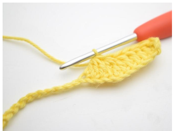
6. Gjenta og hekle 3 stv sm over de neste 3 lm.