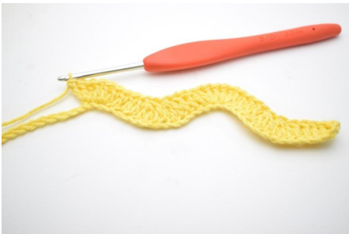
11. Hekle 1 stv i de neste 3 lm. Hekle 3 stv i de neste 2 lm.