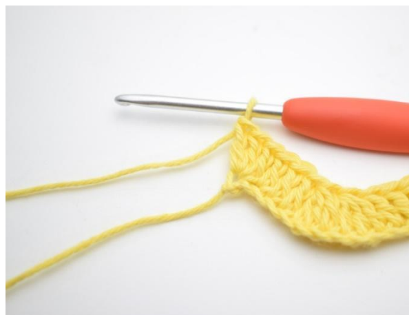
14. I siste lm hekles 3 stv.