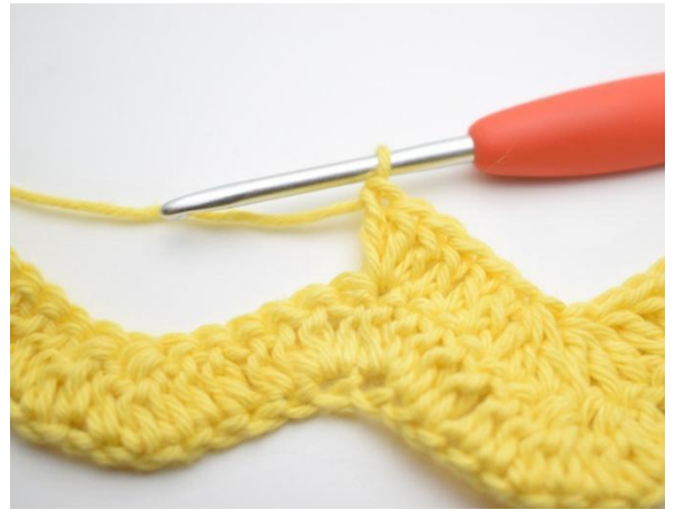
8. Hekle 3 stv i neste m.