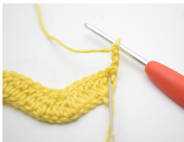
2. Hekle 2 stv i første m.