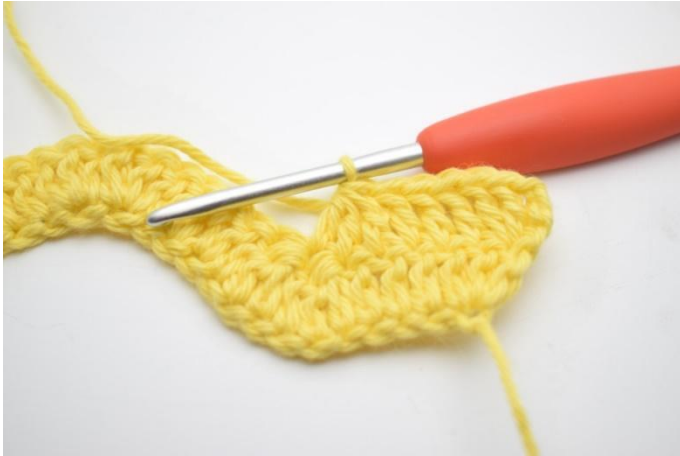
5. Hekle 3 stv sm over de neste 3 m.