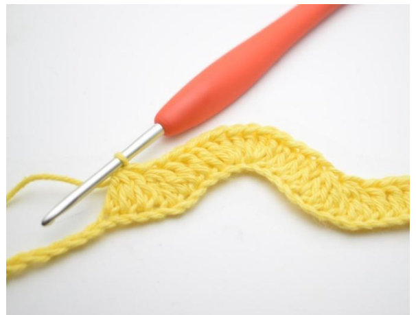
10. Hekle 1 stv i de neste 3 lm. *Hekle 3 stv sm over de neste 3 lm*. Gjenta *til* i alt 2 ganger.