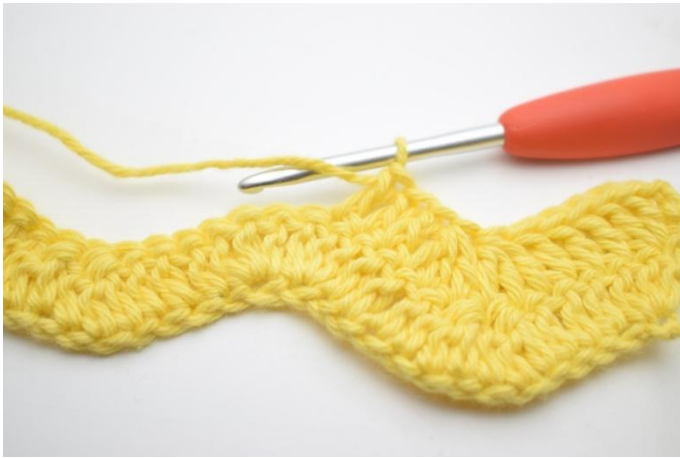
7. Hekle 1 stv i de neste 3 m.