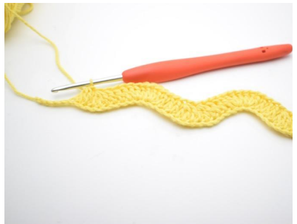
12. Slik gjentas rekken ut til du har 4 lm igjen.