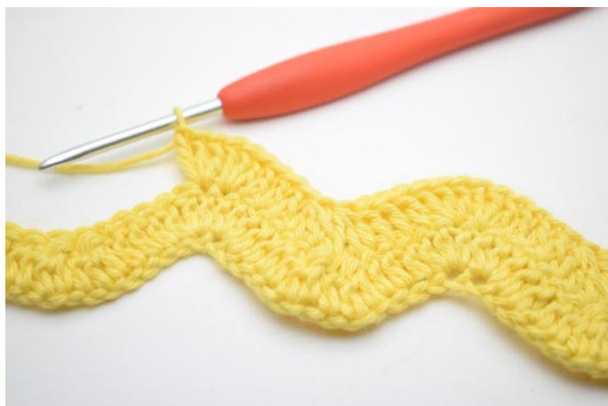
11. Hekle 1 stv i de neste 3 m. Hekle 3 stv i de neste 2 m.