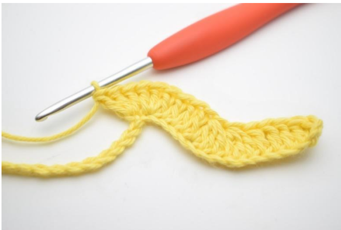
9. Gjenta og hekle 3 stv i neste lm.