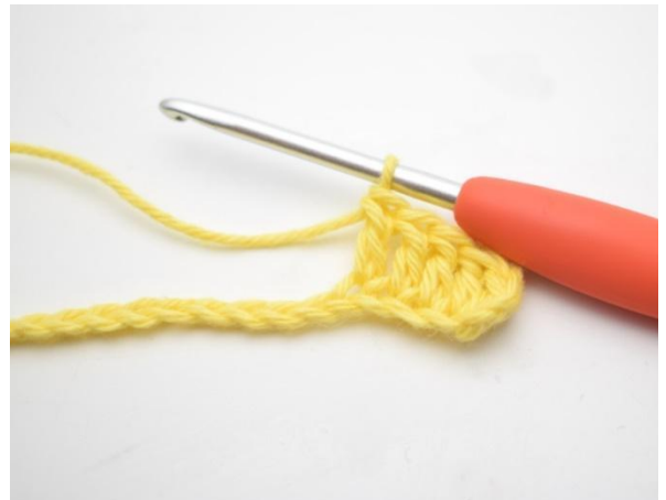
4. Hekle 1 stv i de neste 3 lm.