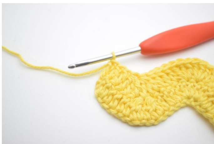
13. Hekle 1 stv i de neste 3 m.