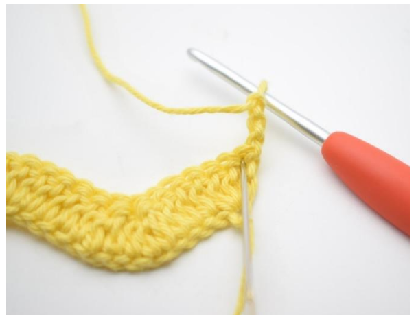
2. Hekle 2 stv i første m.