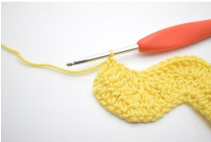
13. Hekle 1 stv i de neste 3 m.