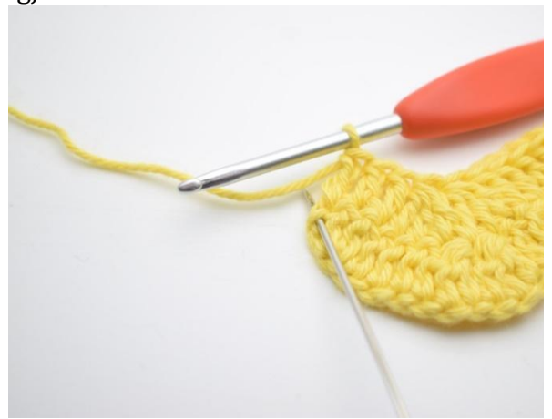
14. I siste m hekles 3 stv.