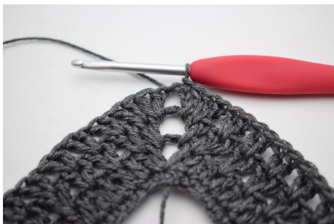
11. Avslutt med 1 kjm.