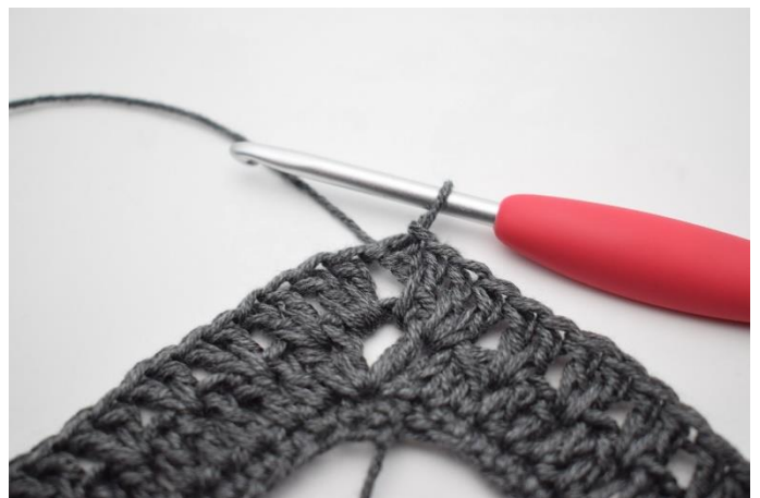
16. Avslutt med 1 kjm.