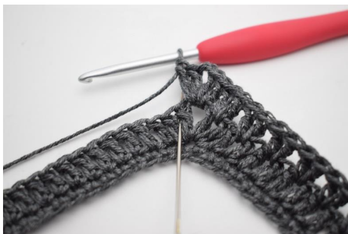
9. Hekle 2 stv imellom de første 2 stv. Nålen her markerer hvor dine stv skal hekles.