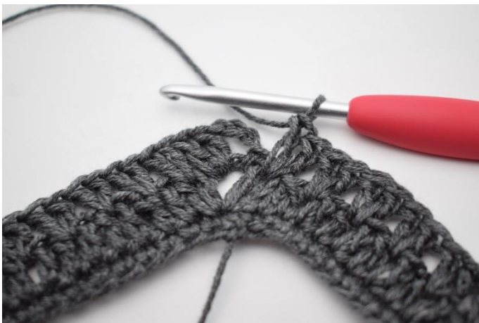
13. Hekle "2 stv imellom de neste 2 stv, hopp over 1 m". Gjenta "til" i alt 34 ganger.