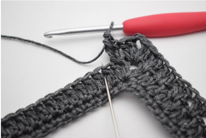
11. Hopp over 1 m og hekle 2 stv imellom de neste 2 stv.