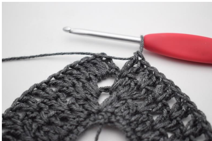
8. Hekle "2 stv imellom de neste 2 stv, hopp over 1 m". Gjenta "til" i alt 36 ganger.