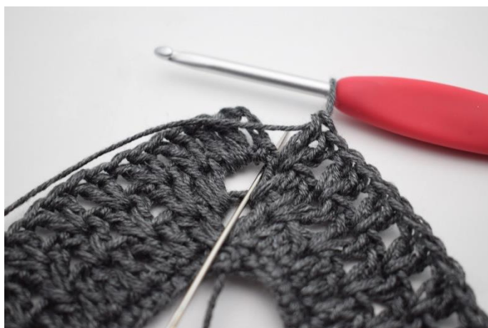
9. Hekle 1 stv i lm-buen fra omgangens begynnelse.