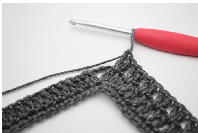
7. Hekle "2 stv imellom de neste 2 stv, hopp over 1 m". Gjenta "til" i alt 34 ganger.