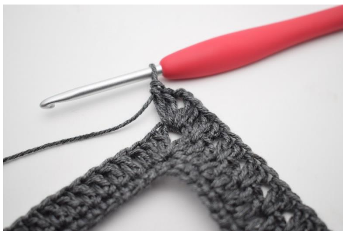
8. Hekle 2 stv, 2 lm, 2 stv i lm-buen.