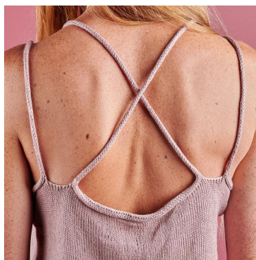
Bilde 2: I-cord-stropper