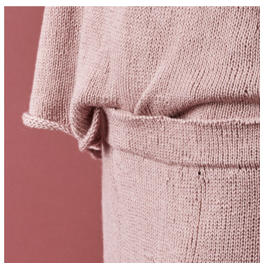
Bilde 1: Linning