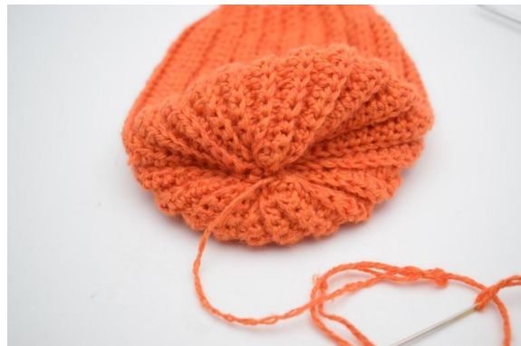
14. Klipp av garnet og sy nå hullet helt igjen.