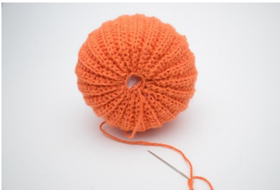
19. Klipp av garnet og sy hullet helt igjen.