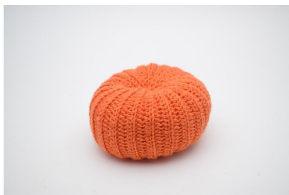
22. Stram lett til og fest enden.