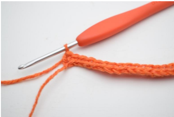
7. Heckle 1 fm i de siste 4 (5) lm.