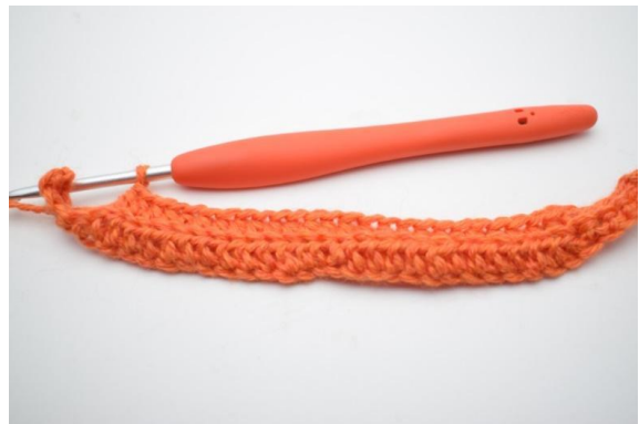
4. Hekle 1 hstv i de neste 20 (25) m