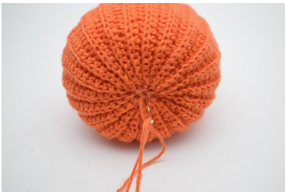
21. Trekk nå garnet opp gjennom gresskaret og tilbake igjen.