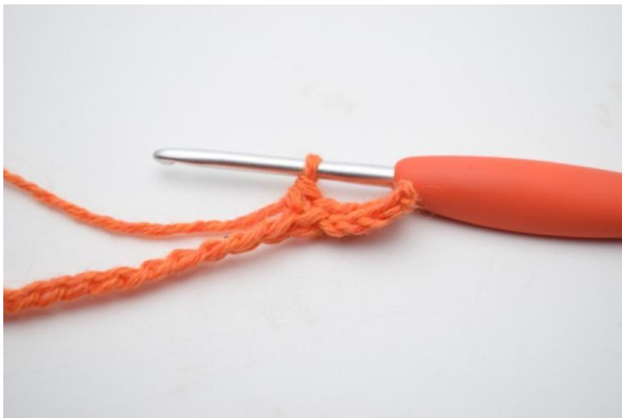
5. Hekle 1 fm i de neste 3 (4) lm.