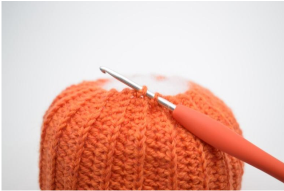
17. Gjenta nå med kjm gjennom 2 av de ytterste vrangbordene omgangen rundt på bunnen.