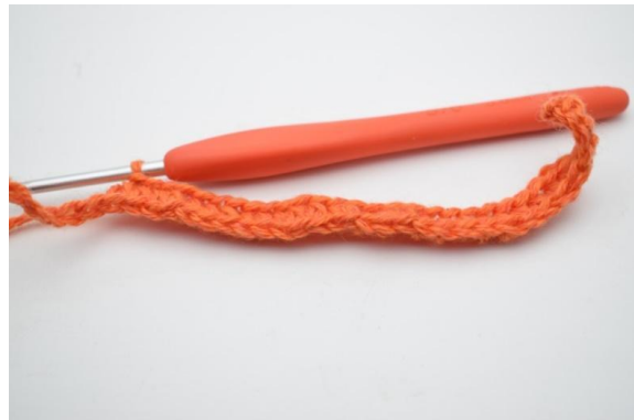
6. Heckle 1 hstv i de neste 20 (25) lm.