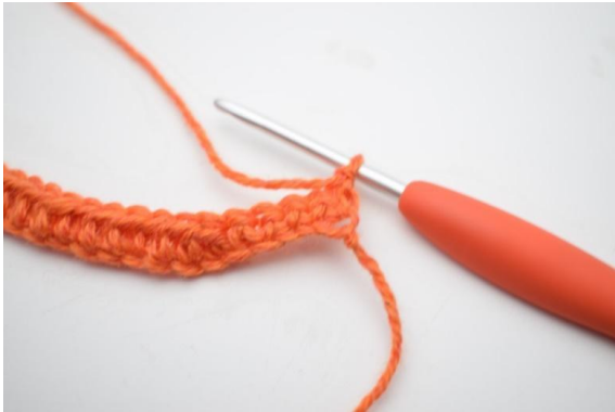
1. Snu med 1 lm