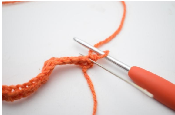
2. Fra nå av hekles det KUN i bml.