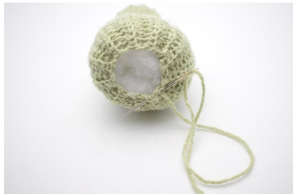
8. Ri rundt i kanten på bunnen og trekk maskene sammen så hullet blir lukket.