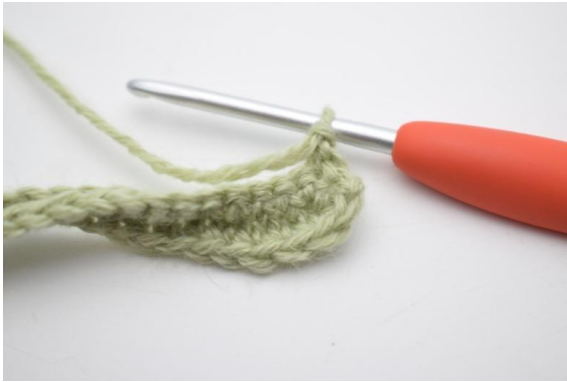
1. Snu med 1 lm.