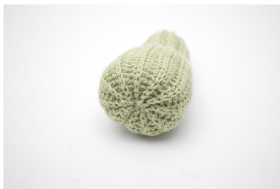
10. Fest enden.