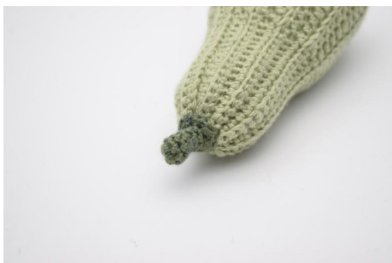
11. Sy stilken på toppen. Fest ender.