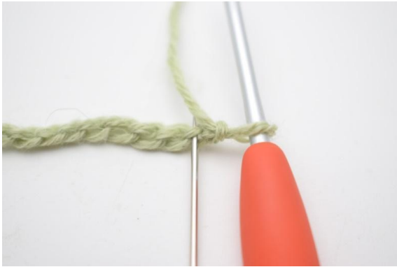
3. I 2. lm fra nålen hekles 1 fm.