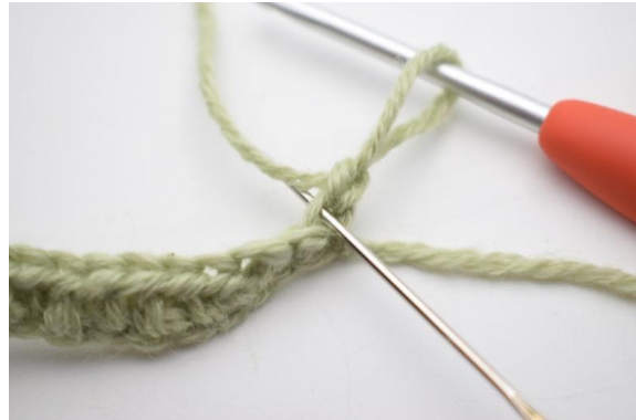
2. Fra nå av hekles det KUN i bml.