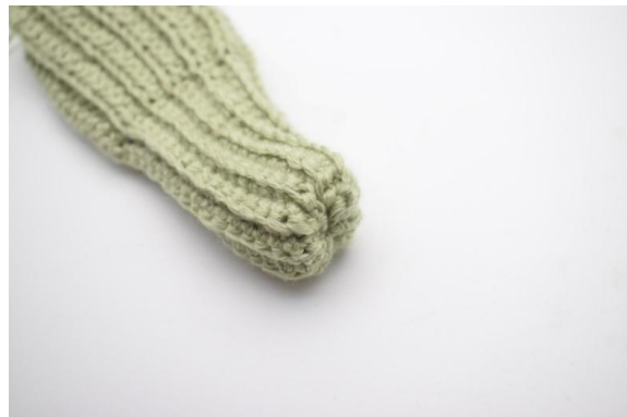
6. Fest enden. Snu nå vrang-siden innover.