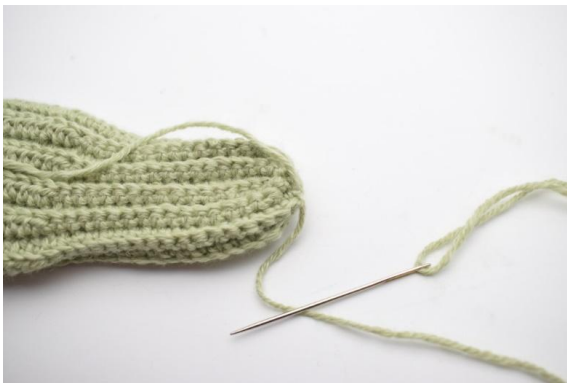
5. Trekk maskene sammen så hullet blir helt lukket.