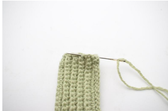
4. Nå skal toppen sys sammen. Ri rundt i kanten.