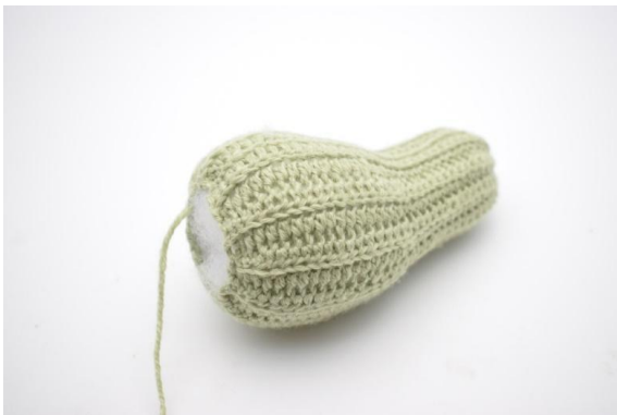
7. Legg i fyll og form den.