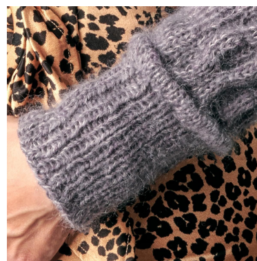
Bise og vrangbord