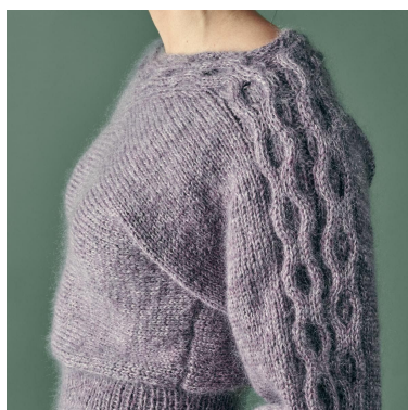
Fletting langs ermet