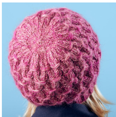
Fellinger i toppen