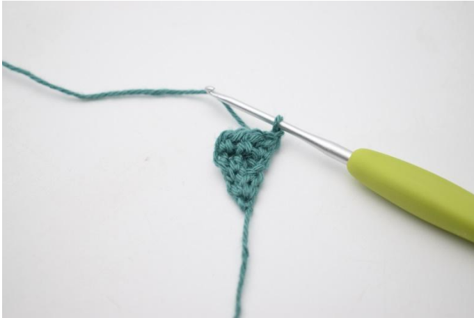
7. Snu med 1 lm.