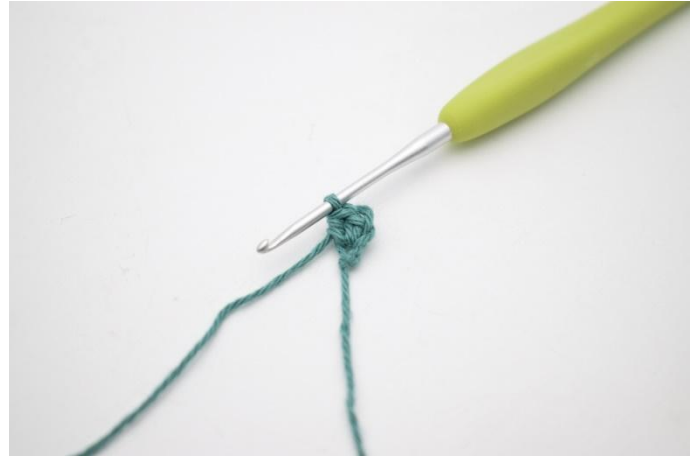
2. Hekle 2 hstv i 2.lm.