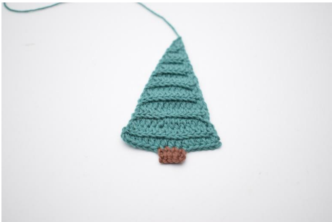
15. Klipp av garnet og fest ender.