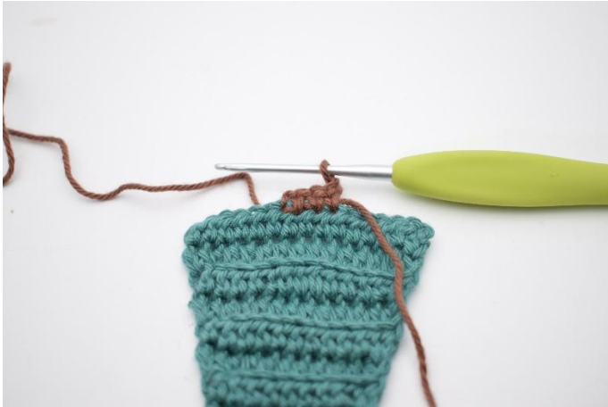
13. Snu med 1 lm.