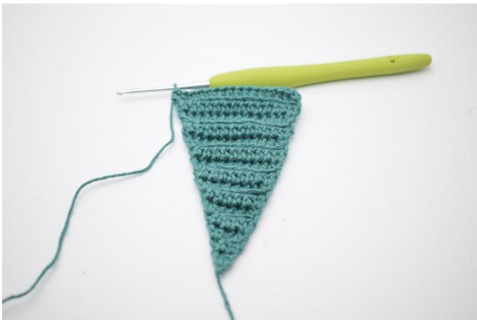
9. Gjenta radene til du har 16 hstv.