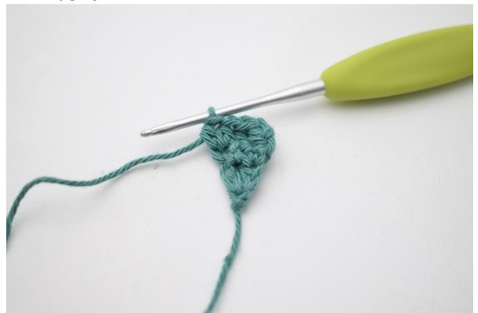
6. Hekle 1 hstv i de neste 2 m, og 2 hstv i siste maske.