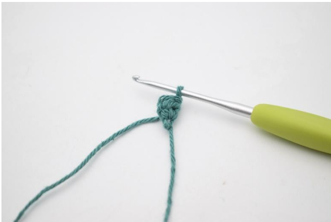
3. Snu med 1 lm.