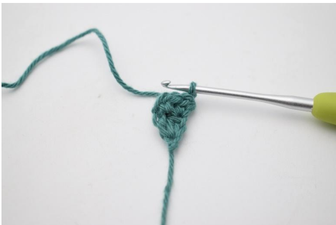
5. Snu med 1 lm.