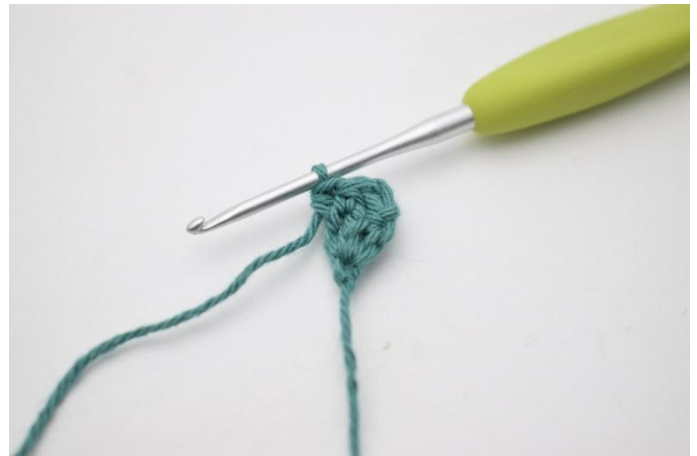
4. Nå hekles alle radene i bakerste maskeledd. Hekle 1 hstv i første maske, og 2 hstv i siste maske.