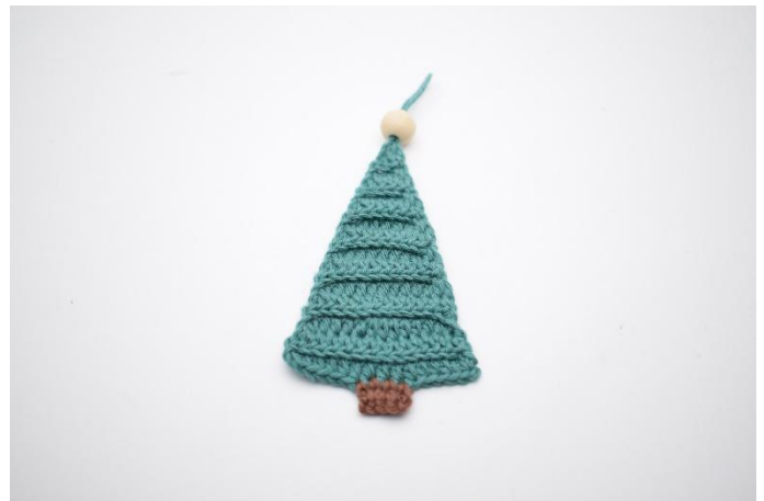
16. Sett evt. en perle av tre i toppen.