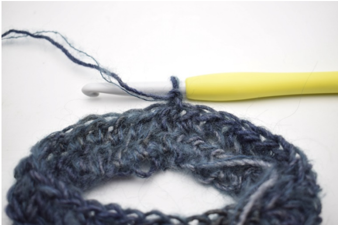
1. Lag 1 lm. Snu arbeidet.