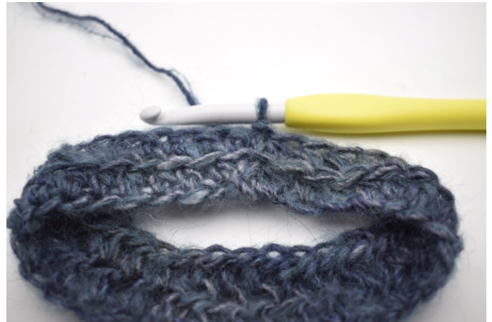
4. Hekle hstv i bml omgangen rundt. Avslutt med 1 kjm i første hstv. (190)