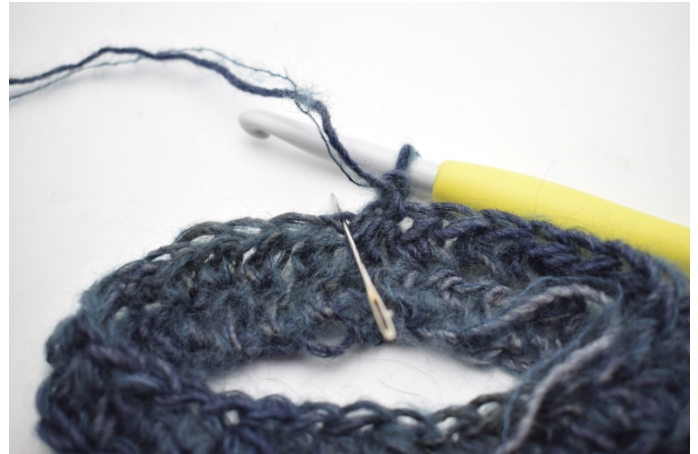
2. Hekle 1 hstv i bml. Nålen her markerer det leddet din hstv skal hekles i.