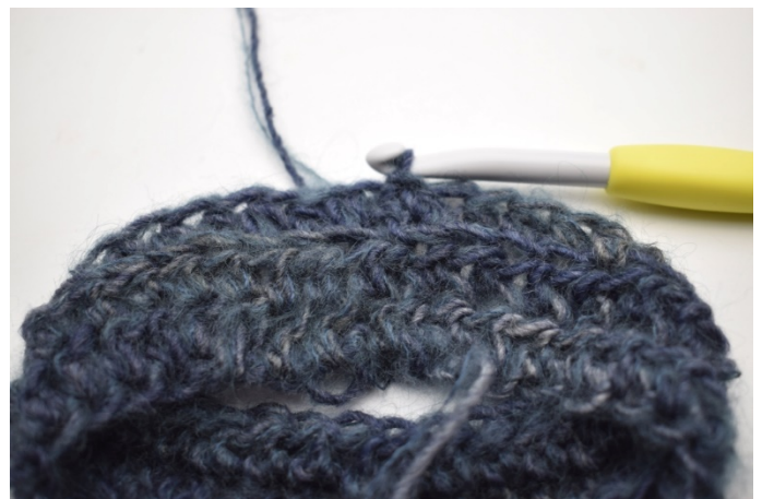
4. Hekle hstv i bml omgangen rundt. Avslutt med 1 kjm i første hstv. (190)