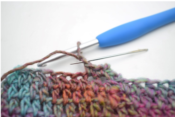
9. Hekle 1 kjm i 2. lm fra nålen.