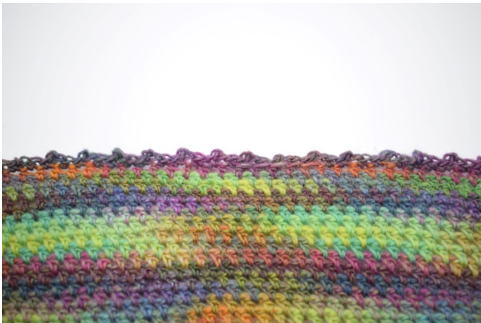
13. Hekle også kanten på motsatt side av tubeskjerfet.