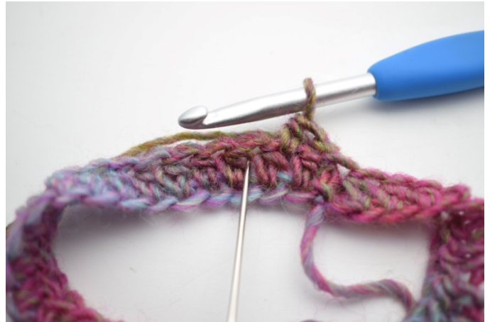
4. Hekle 1 hstv mellom de neste 2 hstv fra forrige rad.