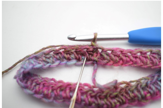
2. Hekle hstv mellom de første 2 hstv fra forrige rad. Nålen her markerer hvor din hstv skal hekles.