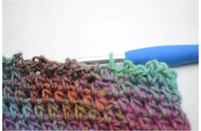
12. "Hekle 1 fm i neste m, lag 2 lm, hekle 1 kjm i 2. lm fra nålen. Hekle 1 fm i neste m på tubeskjerfet". Gjenta "til" omgangen rundt. Avslutt med 1 kjm i første fm. Klipp av garnet og fest endene.