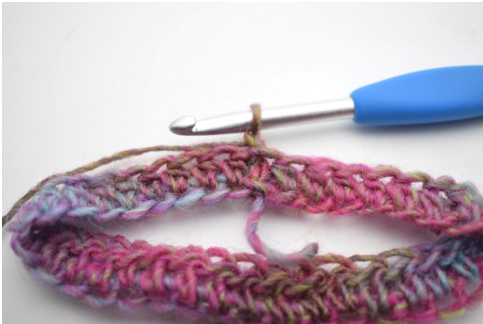
1. Lag 1 lm.