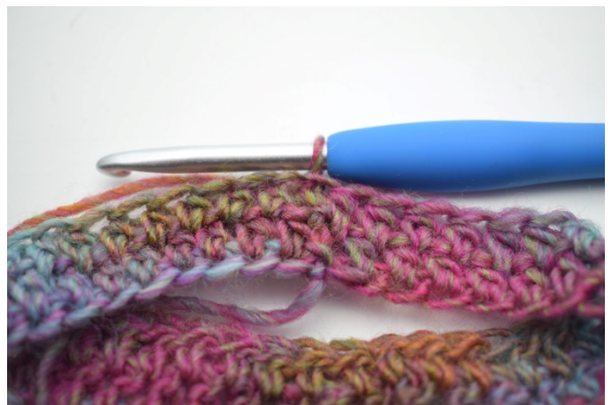
6. Hekle hstv mellom alle maskene omgangen rundt. Avslutt med 1 kjm i første hstv. (200)