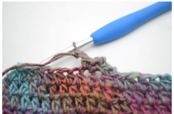
8. Lag 2 lm.