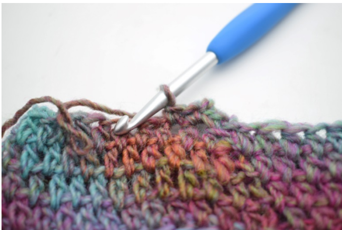
7. Hekle 1 fm i neste m.