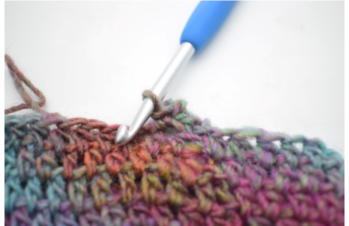
6. Hekle 1 fm i neste m.