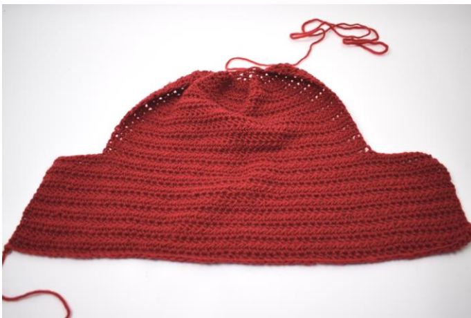
1. Slik vil det nå se ut.

NB Toving varierer fra maskin til maskin. Tov i maskinen ved 40 grader igjen, hvis de ikke er tovet nok. Disse har fått 2 x 40 grader i vaskemaskinen og ble deretter formet/utvidet med selve foten eller papir mens de var våte, og deretter tørket i fasong.