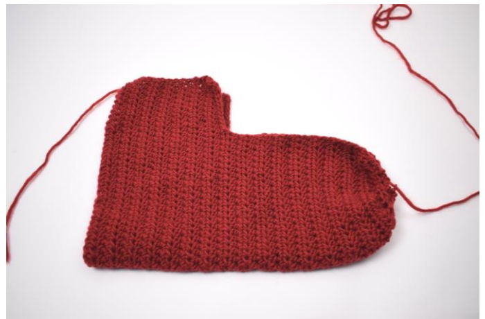
2. Brett stykket som på bildet ovenfor.