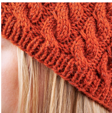
Kant med flettinger