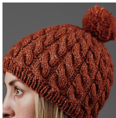
Refleks ved lys i mørket