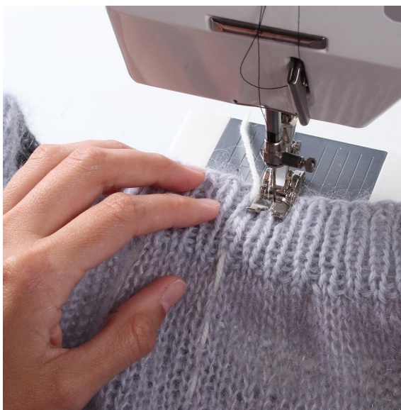
2- Sy sikksakk på maskinen på hver side av kontrasttråden.