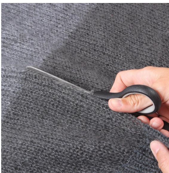
4- Fjern kontrasttråden og klipp opp langs den midterste masken.