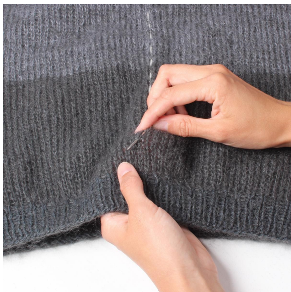
1- Marker hvor det skal klippes opp. Sy en kontrasttråd langs hele kanten.