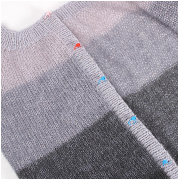
7- Marker hvor knappene skal sitte.