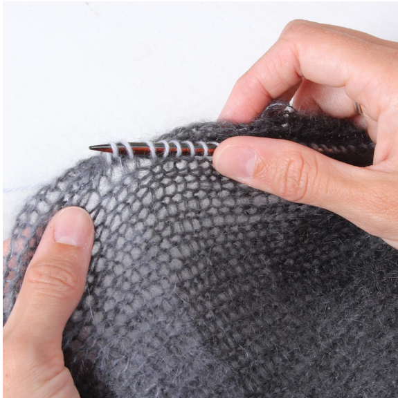
6- Strikk masker langs kanten fra rett-siden.