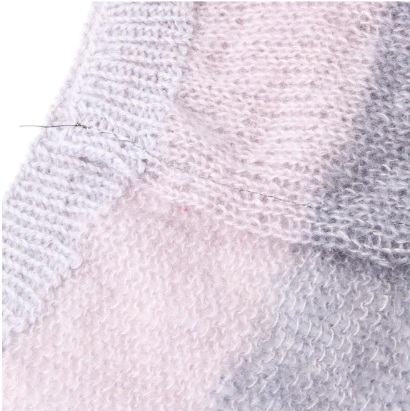
5- Kanten ser nå slik ut.