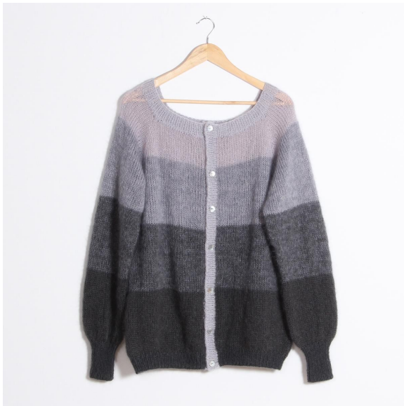
8- Ferdig montert.