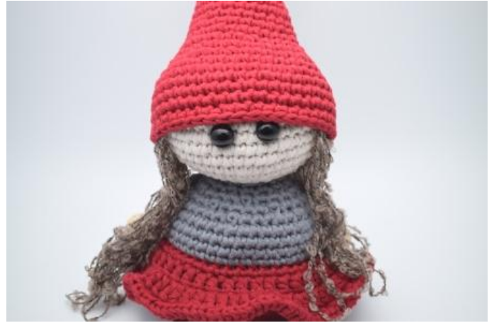
Sett nå luen på hodet, og fest rundt i kanten.