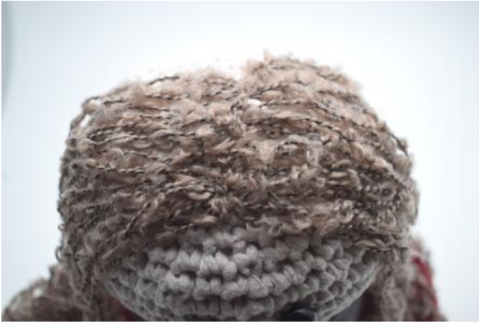
Sy et par sting i midten bortover håret i midten.