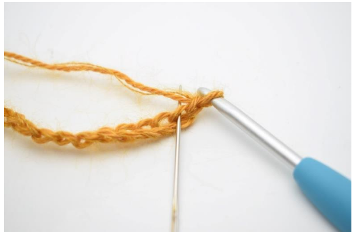
2. Hekle 1 hstv i 2. lm fra nålen.