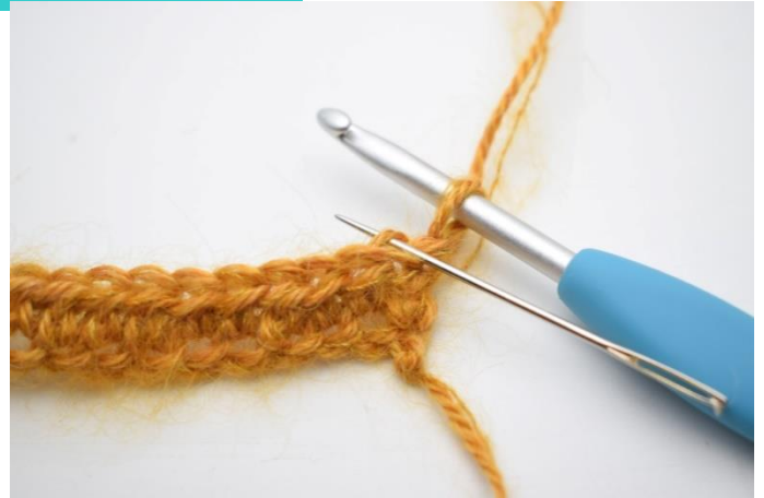
2. Hekle 1 hstv i bml. Nålen her markerer det leddet din hstv skal hekles i.