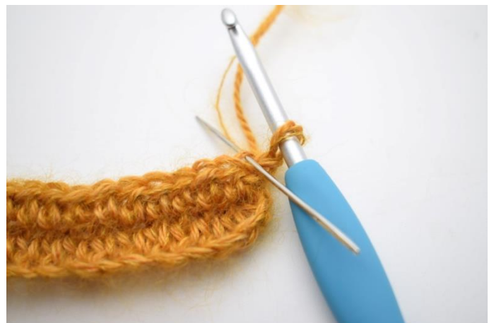
2. Hekle 1 hstv i bml. Nålen her markerer det leddet din hstv skal hekles i.