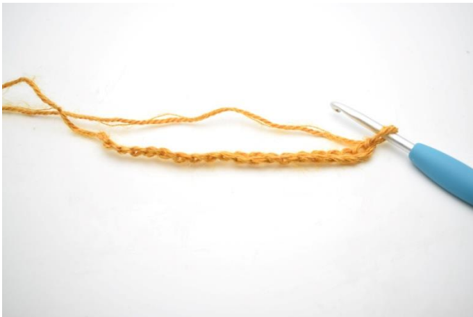
1. Legg opp 78(84)90 lm.