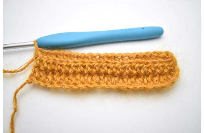
4. Hekle hstv i bml ut raden = 77(83)89 m.