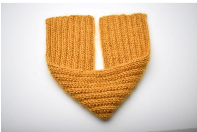
1. Legg stykket som på bildet her.