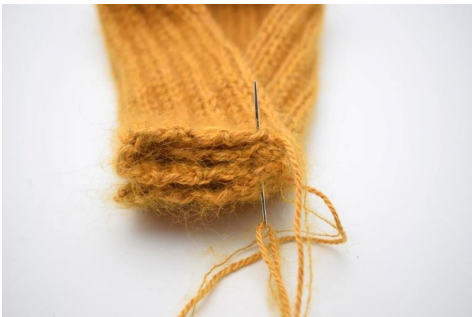
7. Sy gjennom alle 4 lagene på endene av stykkene så de sys sammen.