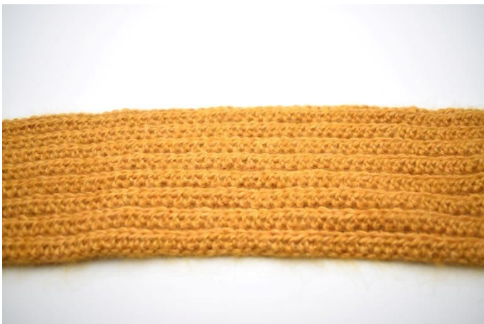
5. Gjenta fremgangsmåten i rad 2 til du har i alt 16 rader med hstv. Klipp av garnet og fest endene.