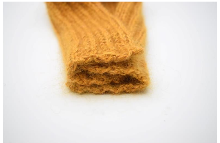
6. Endene på stykkene er nå brettet inn i hverandre som man ser på bildet her.