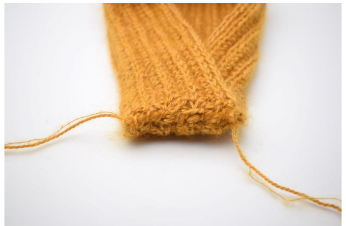
8. Slik. Klipp av garnet og fest endene.