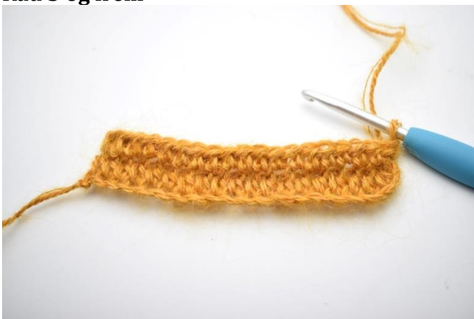
1. Rad 3 hekles som rad 2. Snu med 1 lm.