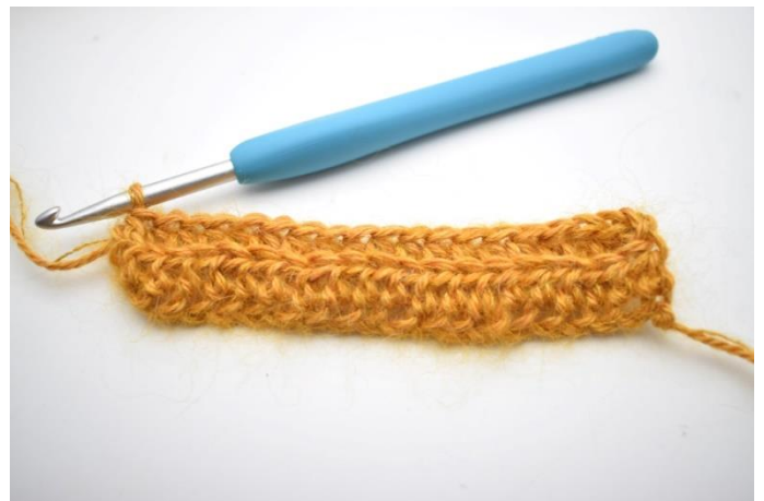
3. Hekle hstv i bml ut raden = 77(83)89 m.