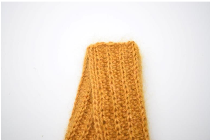
5. Brett den andre halvdelen av høyre del over venstre del.