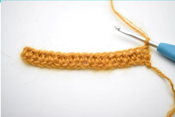
1. Snu med 1 lm.