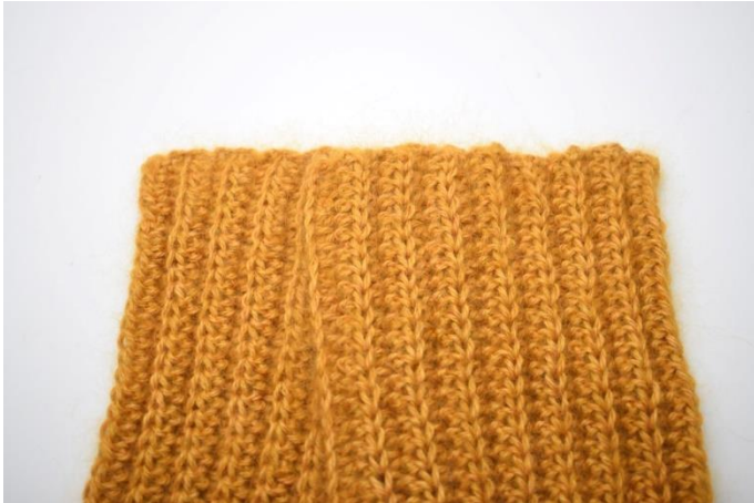
3. Legg høyre del over venstre del så den overlapper halvparten av venstre del.