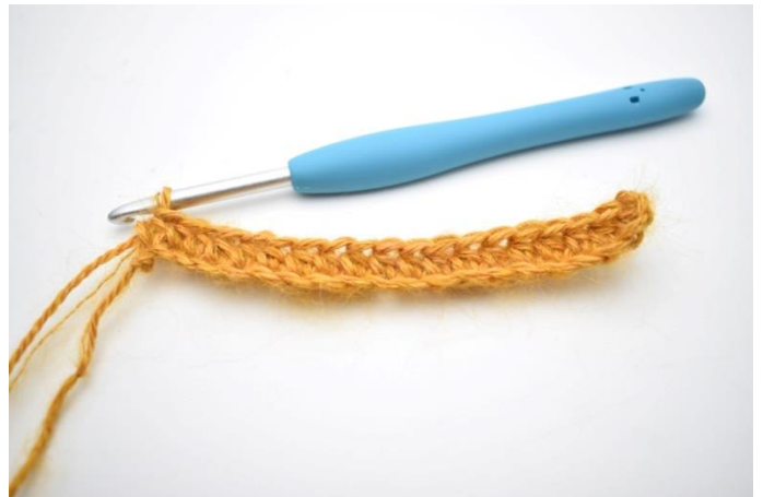
4. Hekle hstv ut raden. = 77(83)89 m.