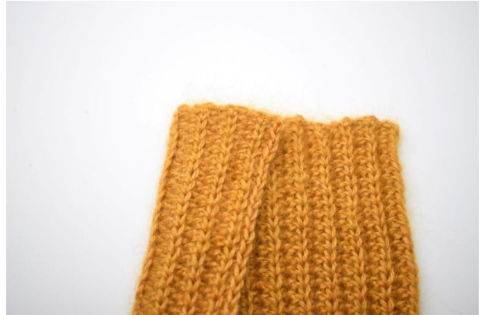
4. Brett den andre halvdelen av venstre del som ikke overlappes over høyre del.