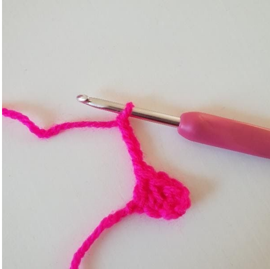
1. Lag 5 luftmasker