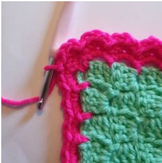
7. Fortsett med å hekle rundt hjørnet . *3 hstvi i den samme m, hopp over 1 m, 1 kjm*