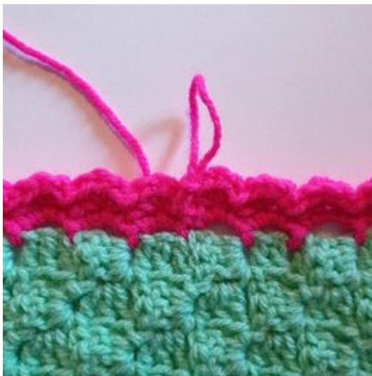
9. Avslutt med 1 kjm.