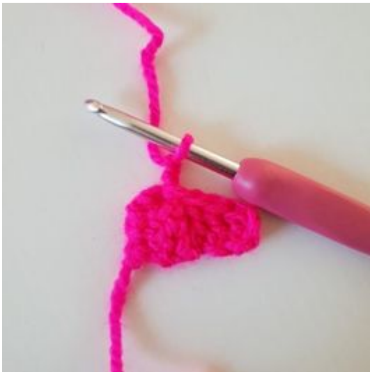
5. Lag 2 lm (erstatter den første stv)