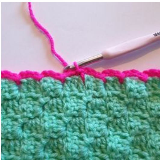
11. Avslutt omgangen med en kjm ved omgangens start.