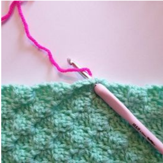
1. Du kan starte hvor du vil på teppet.