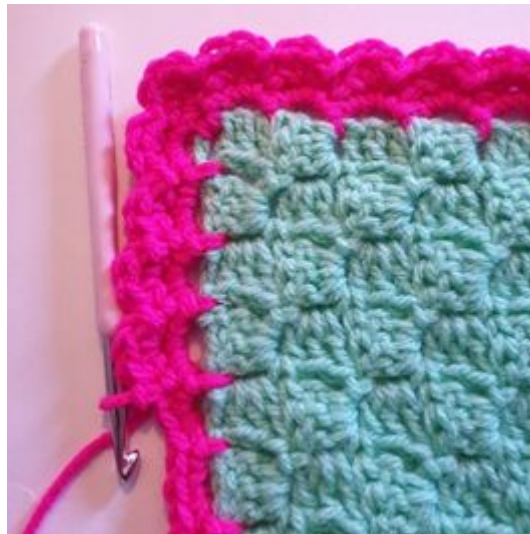
8. Fortsett med å hekle ut omgangen.