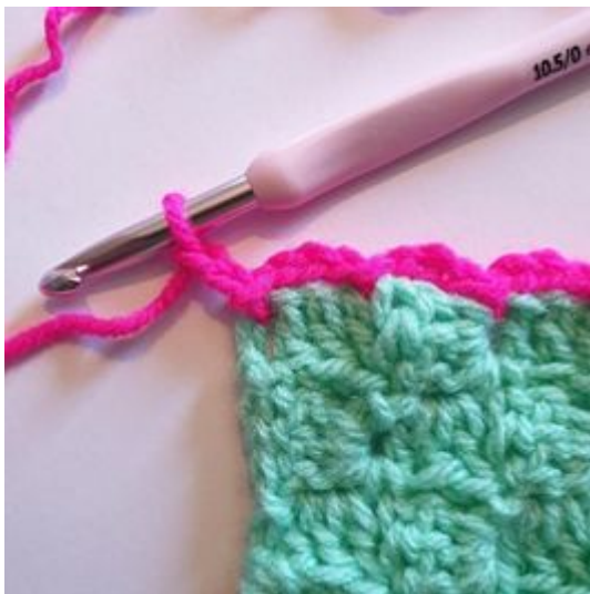
7. Lag 2 lm.