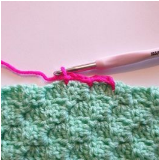
5. Hekle 1 kjm mellom de neste 2 pixelene.