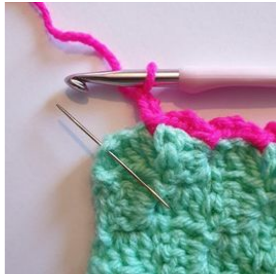
6. Når du kommer til hjørnet hekles 1 kjm i hjørnet.