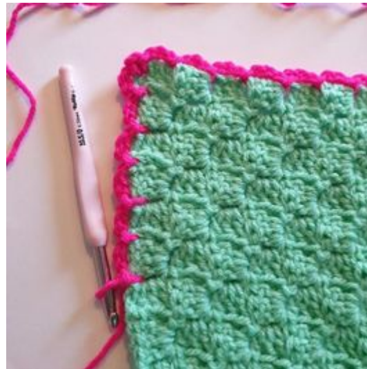
10. Fortsett med å hekle ifølge tidligere mønster rundt teppet .