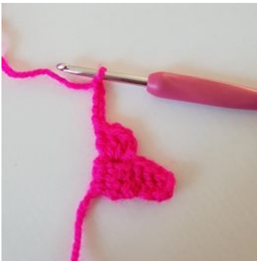
1. Lag 5 lm