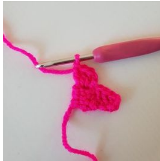
6. Hekle 3 stv i den lm-buen som du nettopp heklet en kjm i. Du har nå 2 pixler på omgang 2.