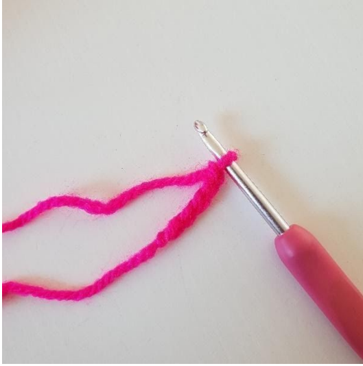
1. Start med å lage 5 luftmasker