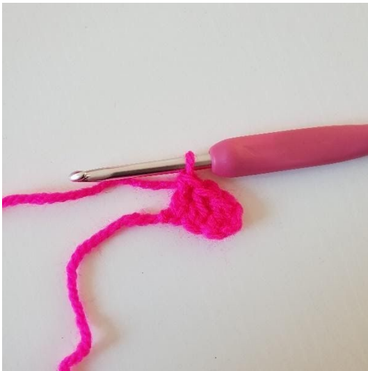
3. Hekle stv i de neste 2 lm. Du har nå heklet din første pixel.