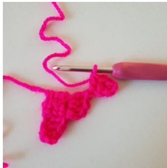
2. Hekle 1 stv i tredje lm fra nålen og deretter 1 stv i de siste 2 lm.