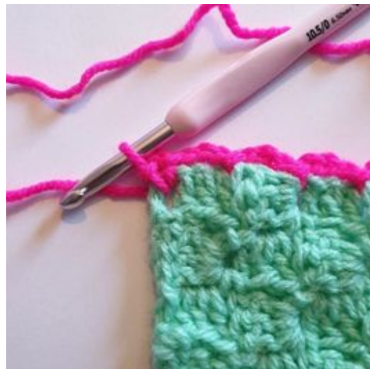
8. Hekle enda 1 kjm i hjørnet.