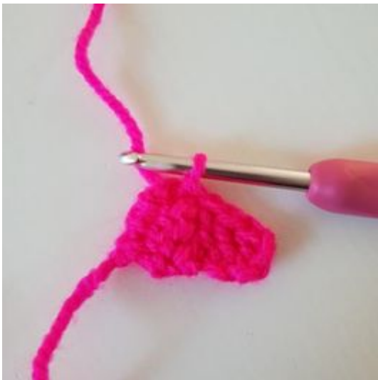
3. Hekle 1 stv i de neste 2 lm. Nå har du enda en pixel.