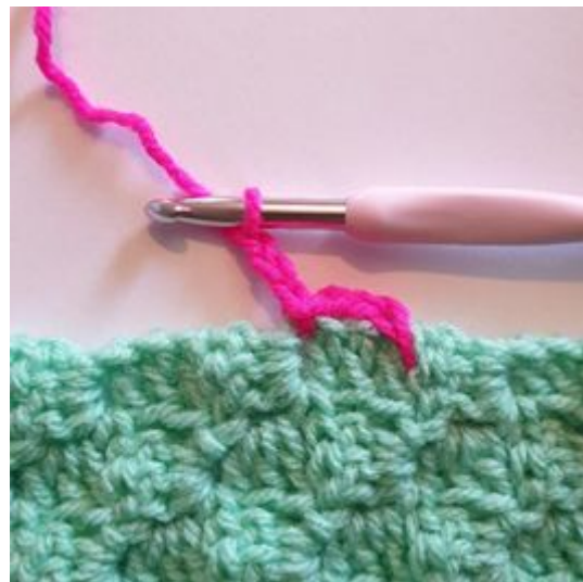
4. Lag 3 lm.