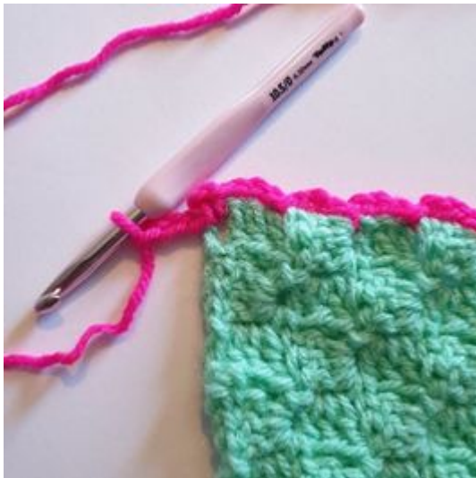
9. Lag 3 lm.