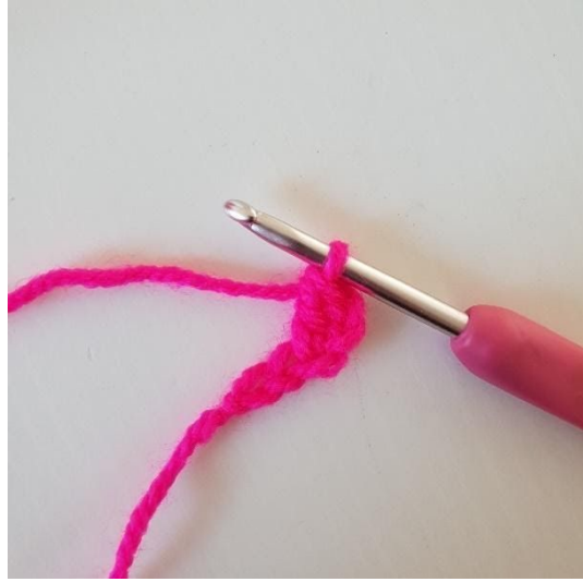
2. I tredje luftmaske hekles 1 stv