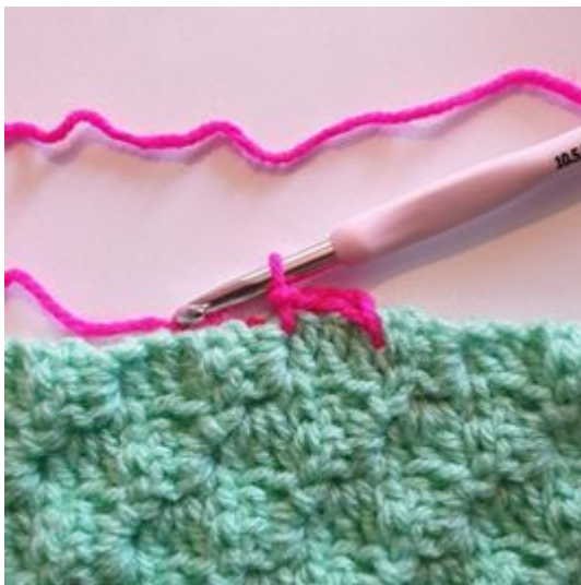
3. Hekle 1 kjm mellom de neste 2 pixelene.