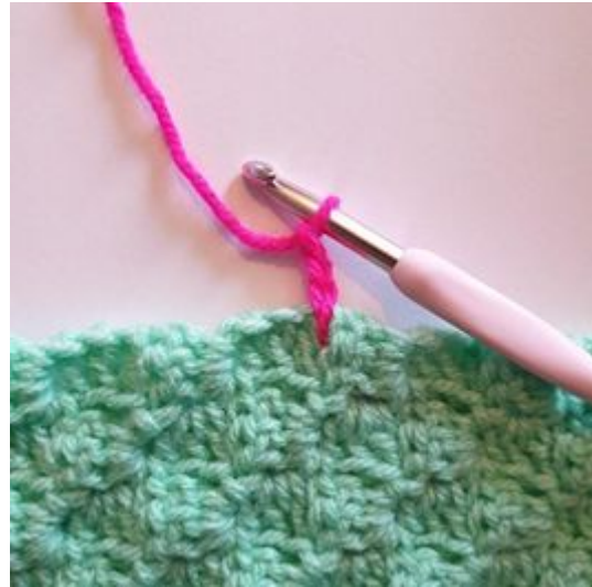
2. Lag 3 lm.