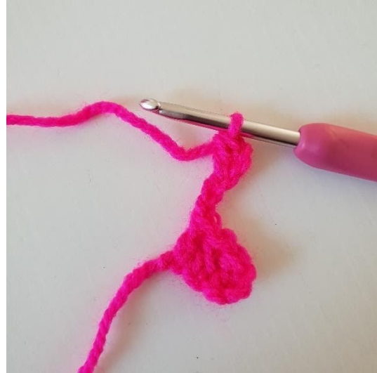
2. Hekle 1 stv i tredje lm fra nålen