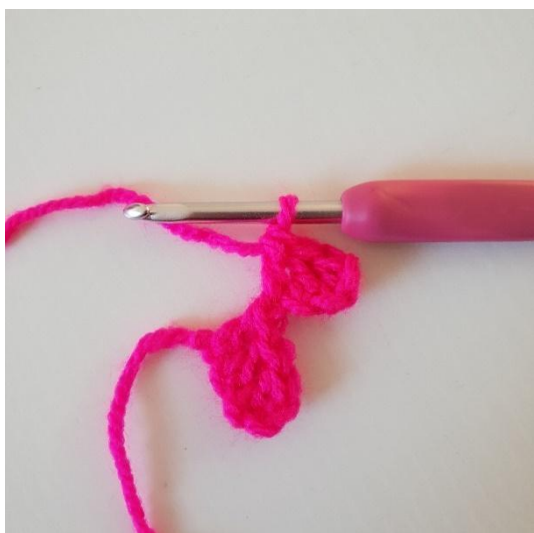
3. Hekle stavmasker i de neste 2 lm. Nå har du laget en pixel til.