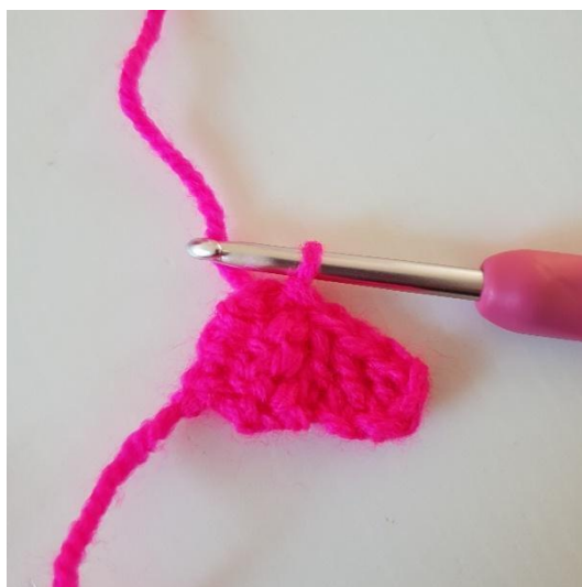
4. Nå skal pixelen hekles sammen med den første pixelen. Det gjør du ved å vende pixelen og hekle en km på venstre side av den første pixelen. Bildet viser hvordan de er heklet sammen.