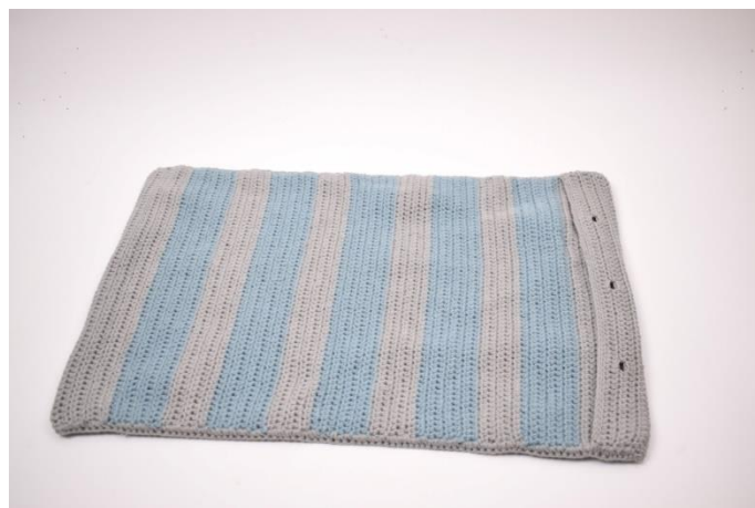
6. Gjenta på begge sidene. Klipp av garnet og fest endene.