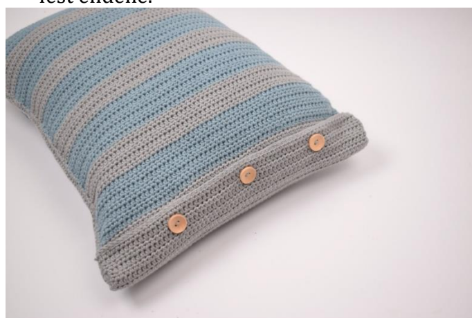
8. Legg i puten og lukk puten.