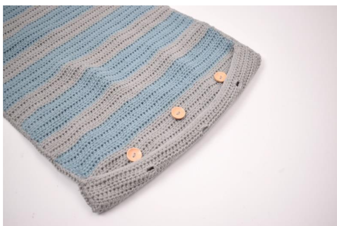
7. Sy de 3 knappene fast så det passer med knapphullene.