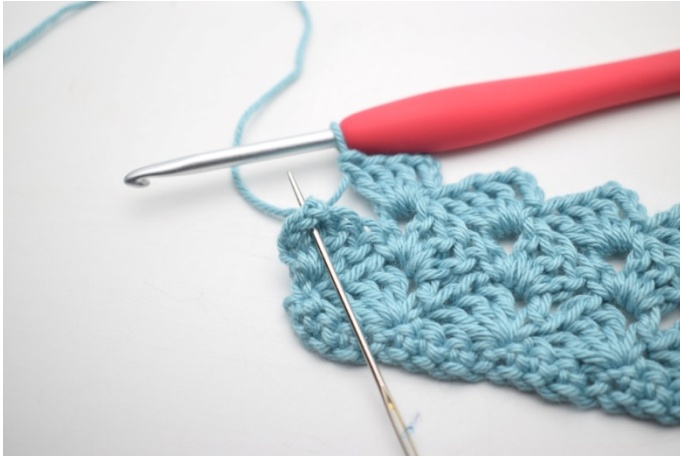
31. Hekle 1 fm i siste lm-bue.