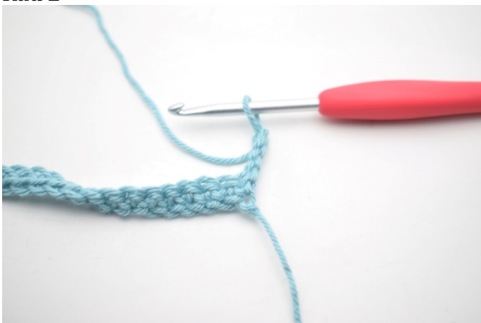
5. Snu med 4 lm.