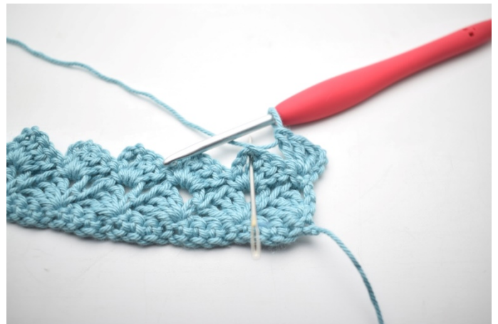
28. "Hekle 1 fm, 3 lm og 3 stv i neste lm-bue".