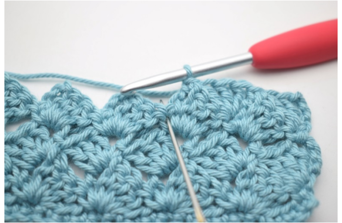
43. Hekle 3 stv i fm fra forrige rad”.