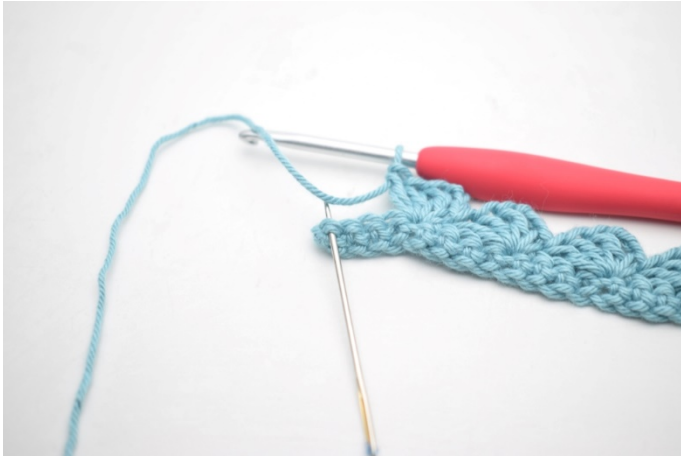
13. Hopp over 3 m og hekle 1 fm i siste m.