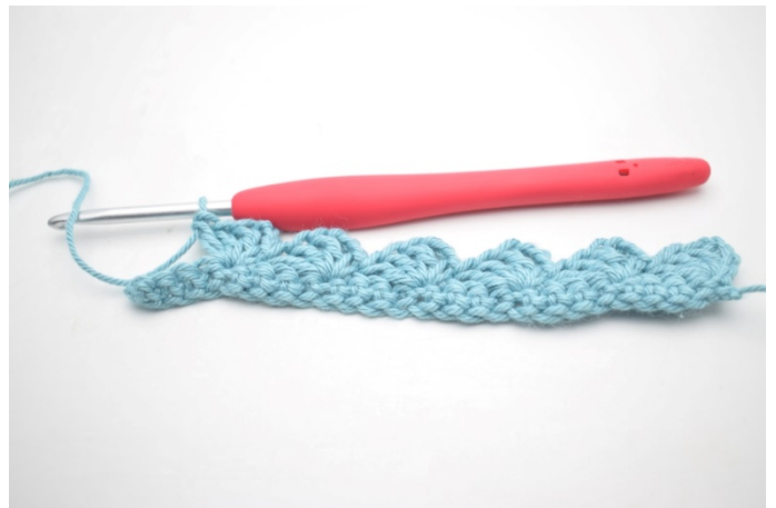
12. Gjenta "til" til du har 4 m igjen.