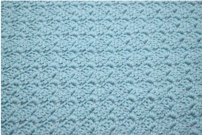
33. Gjenta fremgangsmåten for rad 3 til du har i alt 24 rader.