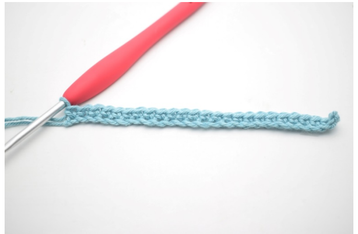
4. Hekle fm ut raden.