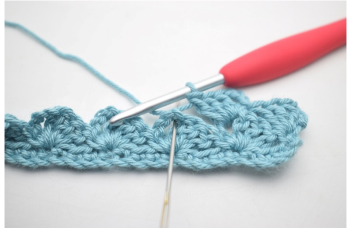
20. "Hekle 1 fm, 3 lm og 3 stv i neste lm-bue".