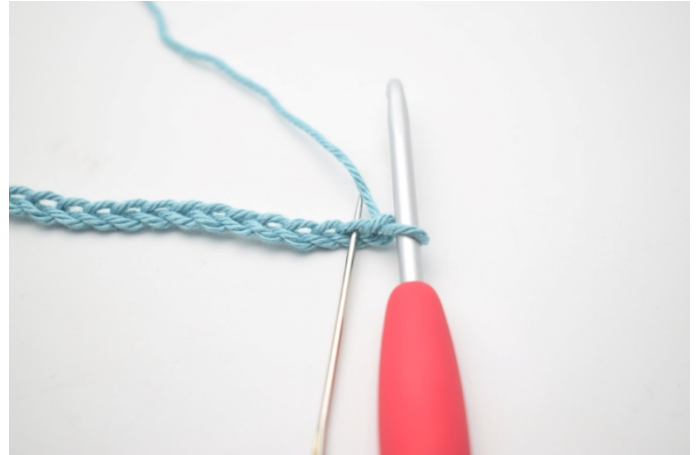
2. Hekle 1 fm i 2. lm fra nålen.