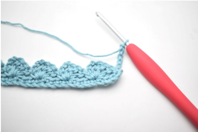
15. Snu med 4 lm.