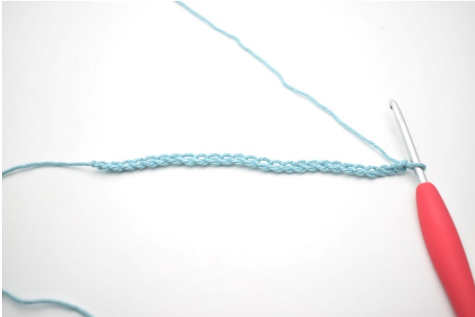
1. Legg opp 58 lm.