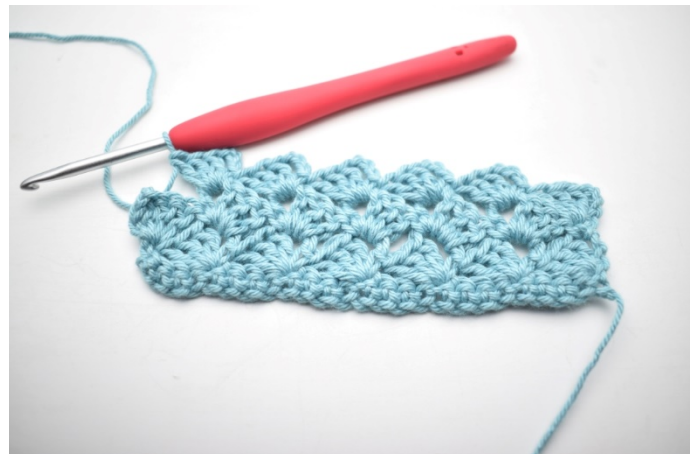
30. "Hekle 1 fm, 3 lm og 3 stv i neste lm-bue". Gjenta "til" i alt 13 ganger.