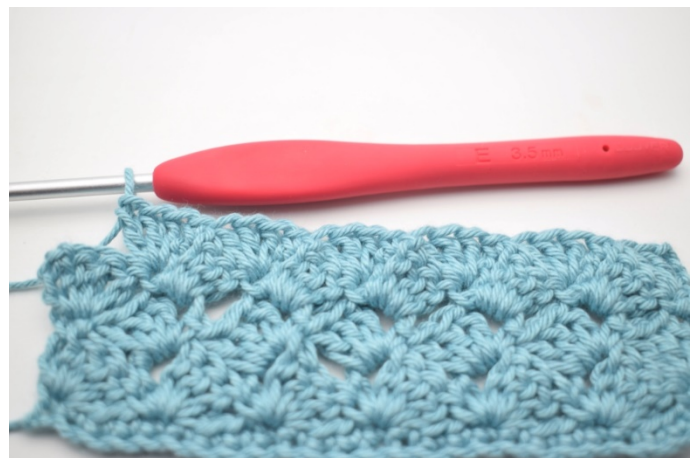
45. Gjenta ”til” i alt 13 ganger.