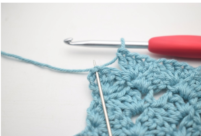
46. Hekle 1 fm i siste lm-bue.