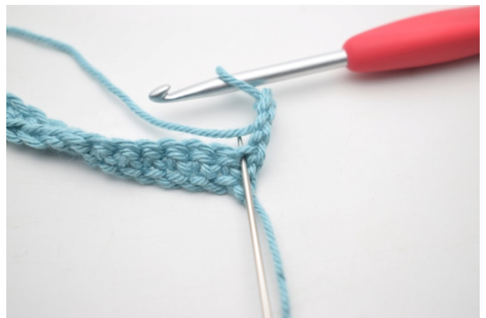
6. Hekle 3 stv i første m.