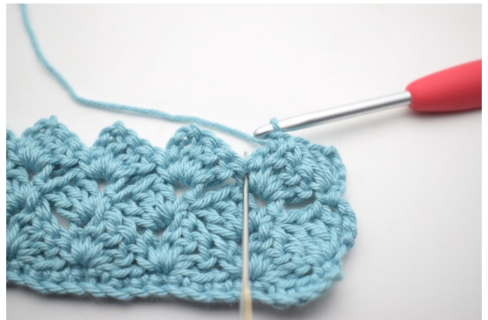
39. Hekle 3 stv i fm fra forrige rad".