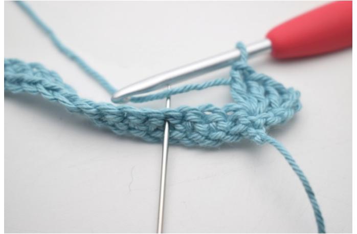
8. "Hopp over 3 m, hekle 1 fm, 3 lm og 3 stv i neste m".