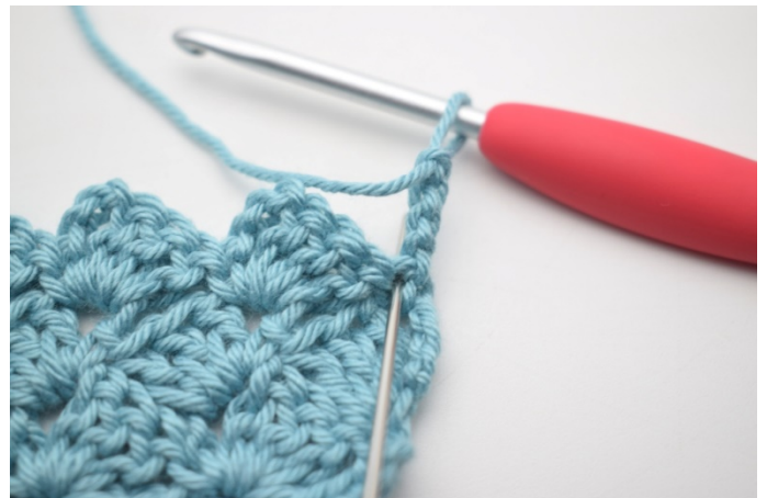
35. Hekle 2 stv i første m.