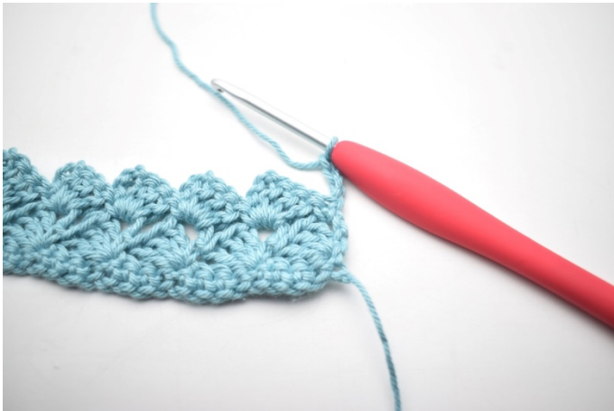
25. Hekles som rad 3. Snu med 4 lm.