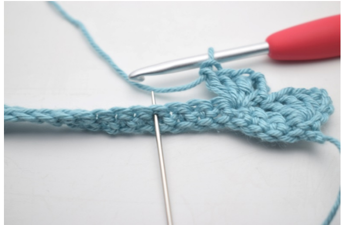
10. "Hopp over 3 m, hekle 1 fm, 3 lm og 3 stv i neste m".