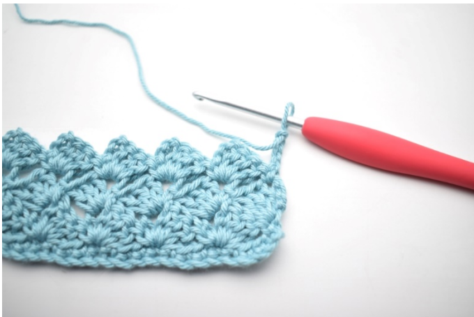
34. Snu med 4 lm.