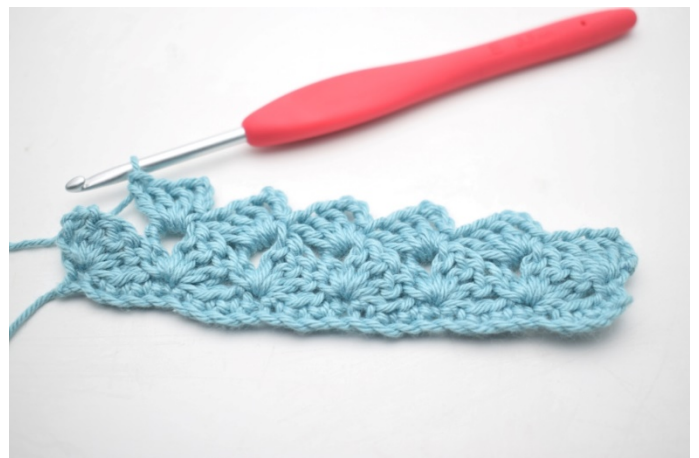
22. Gjenta "til" i alt 13 ganger.