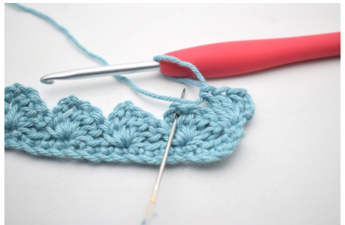
18. "Hekle 1 fm, 3 lm og 3 stv i neste lm-bue".