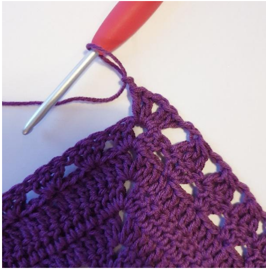
[2 stv, 2 lm, 2 stv] i spissen