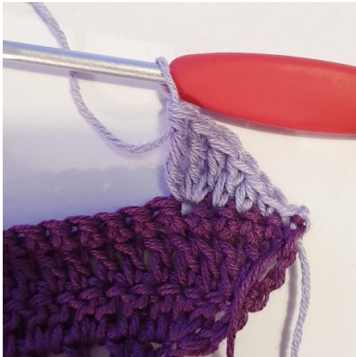
3 dstv i samme m,