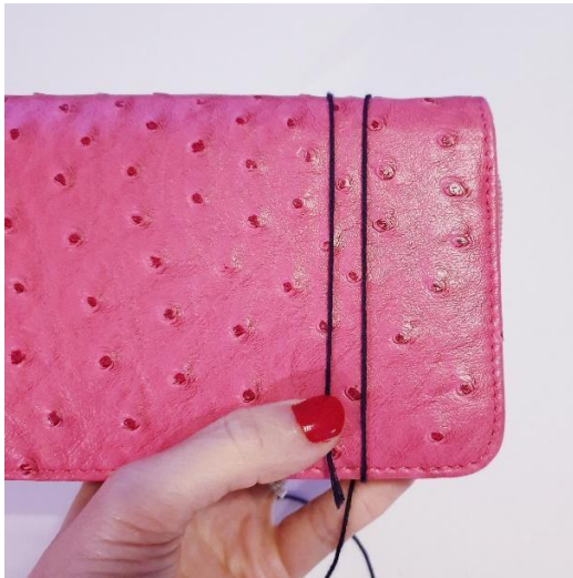
Snurr garnet rundt etuiet