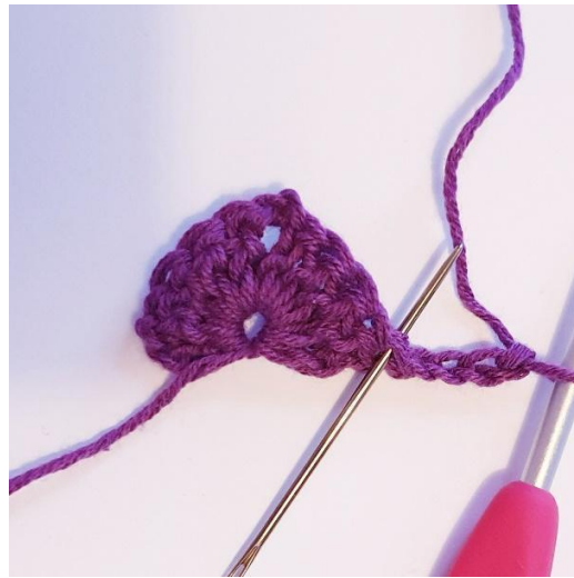
4 lm og snu