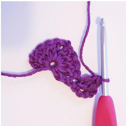
Omgang 2: 2 stv i første m,