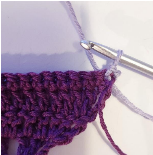
1 lm, 1 kjm i første m