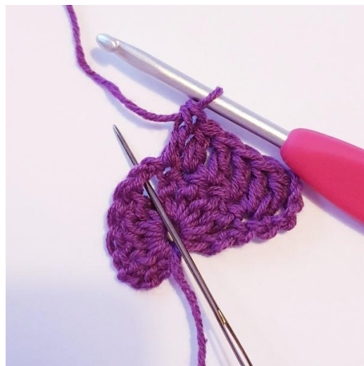
1 stv i de neste 4 m