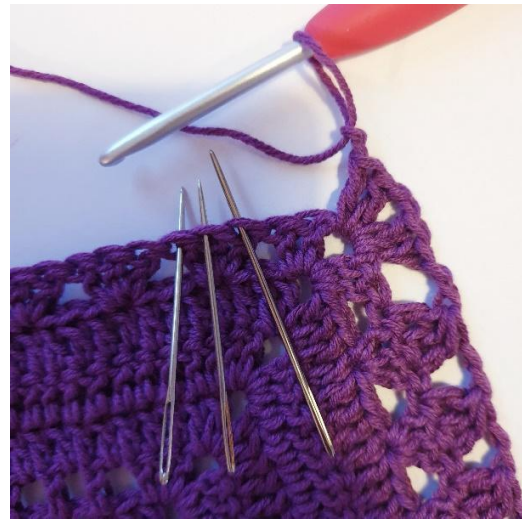
[2 lm, 3 stv sammen, 2 lm]