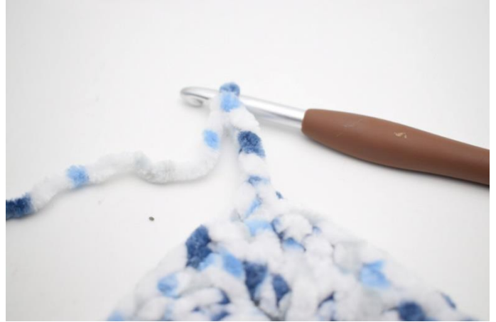
27. Lag 4 lm og hekle 1 fm i 2. lm fra nålen. Hekle 1 fm i de siste 2 lm.