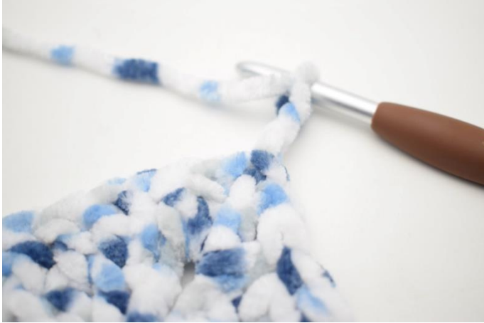
21. Lag 1 kjm i lm-buen. Lag 3 lm.