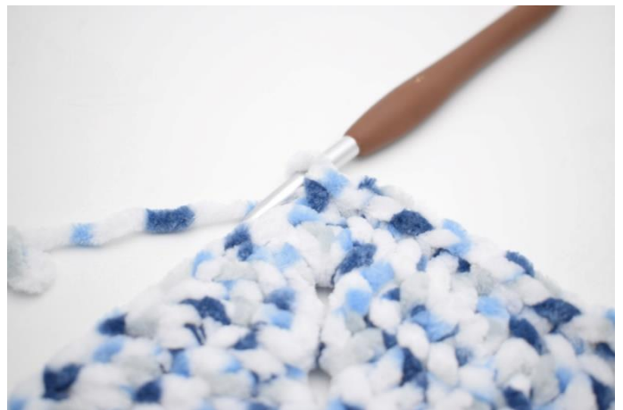
35. Hekle 1 fm i de neste 32 m.