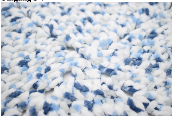
20. Slik gjentas fremgangsmåten og omgangene til du har i alt 7 omganger.