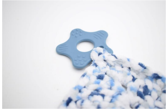
6. Brett hjørnet rundt åpningen og sy den fast.