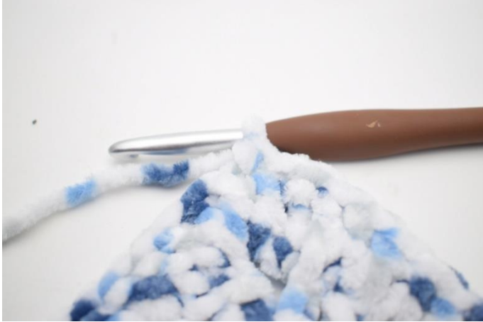
26. Lag 1 lm. Hekle 1 fm i første m.