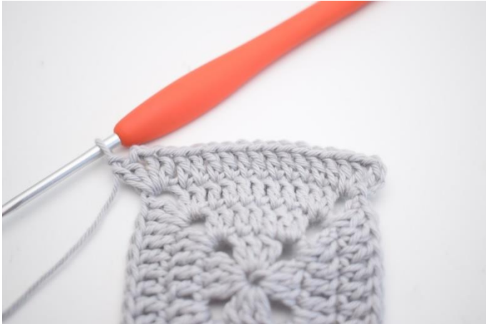
17. Hekle "1 stv i de neste 11 m, 2 stv, 2 lm og 2 stv i neste lm-bue".