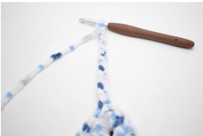
36. Lag 15 lm. Hekle 3 fm i 2. lm fra nålen. Hekle 3 fm i hver av de siste 12 lm.