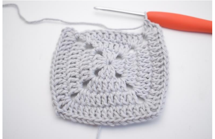
18. Gjenta "til" i alt 3 ganger.