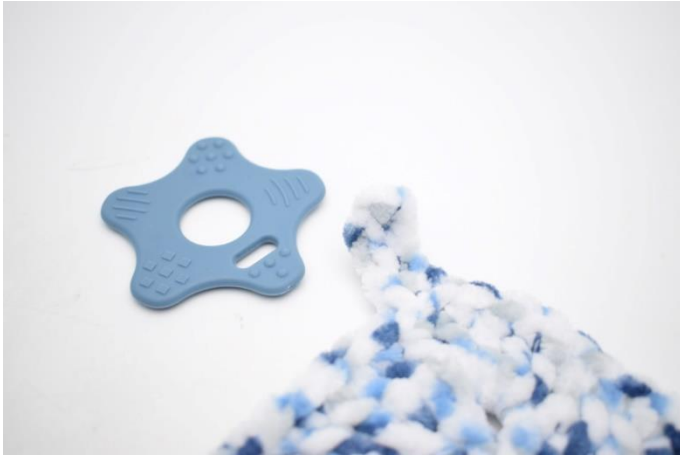
5. I hjørne 3 monteres biteringen.