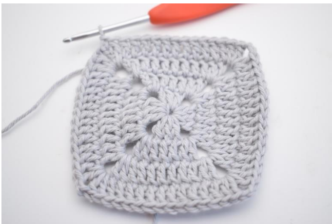
19. Hekle 1 stv i de neste 11 m og 1 stv i lm-buen fra omgangens start. Avslutt med 1 kjm i 3. lm.