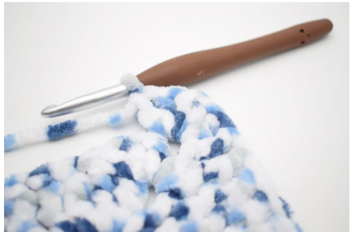
24. Hekle 5 stv i neste lm-bue".