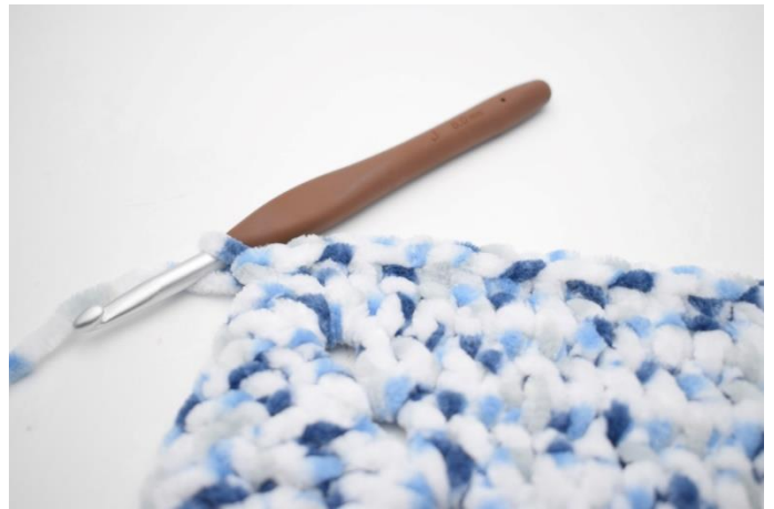
29. Hekle 1 fm i de neste 32 m.