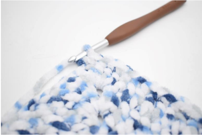
32. Hekle 1 fm i de neste 32 m.