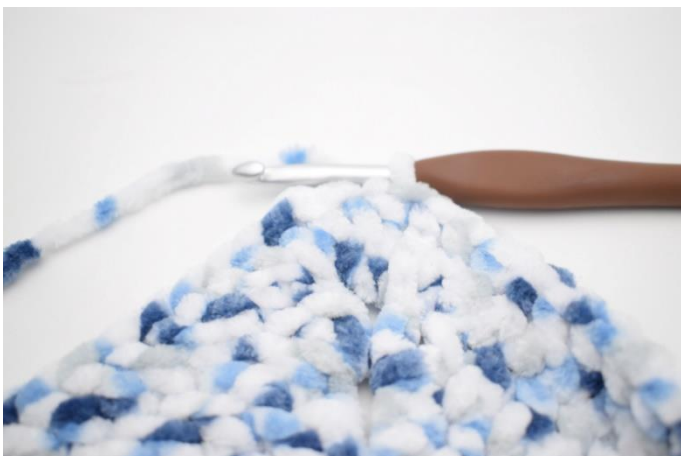
25. Gjenta "til" i alt 3 ganger. Hekle 1 stv i de neste 27 m og 1 stv i lm-buen fra omgangens start. Avslutt med 1 kjm i 3. lm.