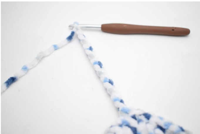
30. Lag 15 lm. Hekle 1 stv i 3. lm fra nålen. Hekle 1 stv i de siste 12 lm.