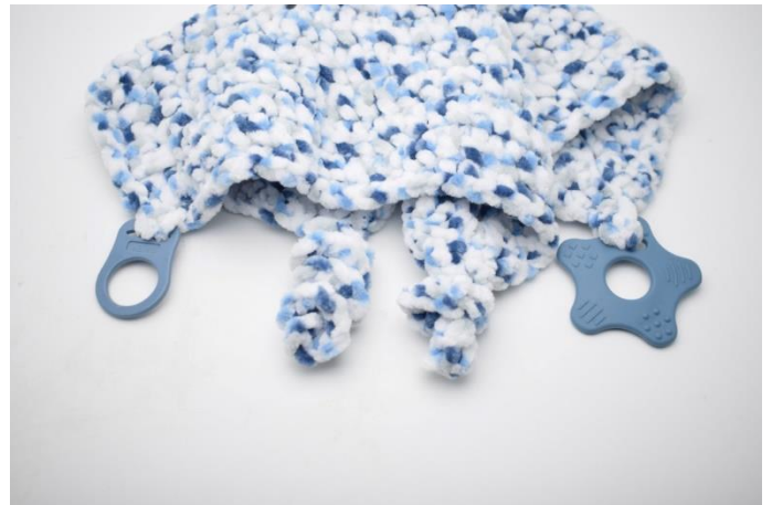
8. Din Nuzzle-klut er nå klar til å bli kost, klemmt og lekt med 😊