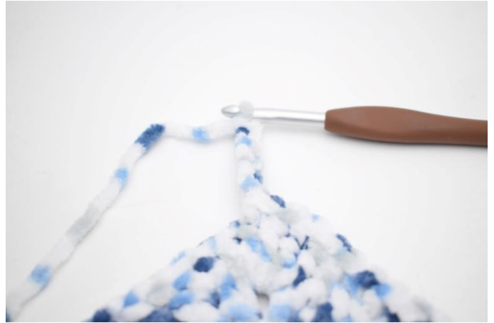
33. Lag 6 lm og hekle 1 fm i 2. lm fra nålen. Hekle 1 fm i de siste 4 lm.