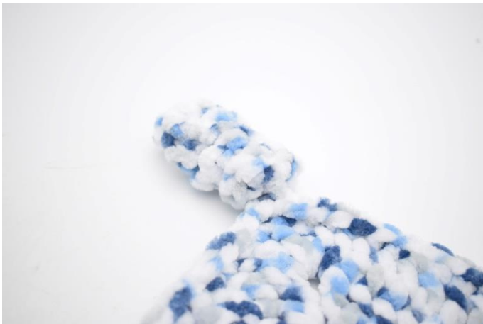
7. Det siste hjørnet er som det skal være.