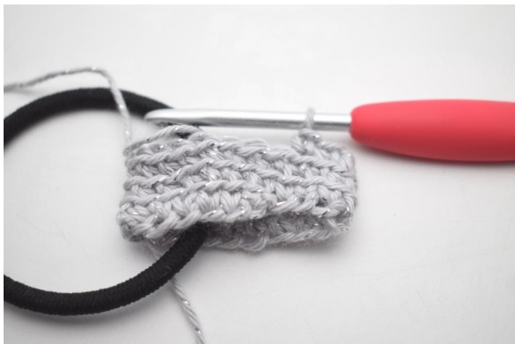
9. Gjenta fremgangsmåten for omgang 2.