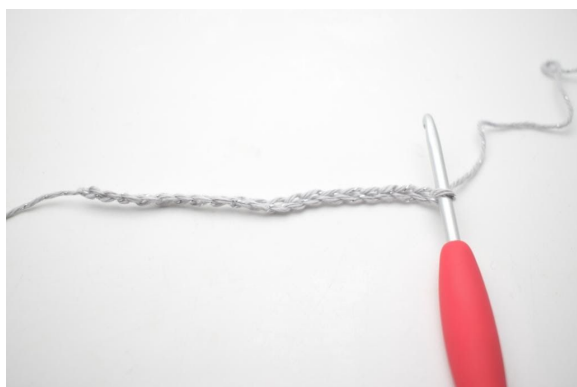
1. Legg opp 20 lm.