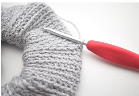
12. Slik. Det er nå heklet 1 kjm.