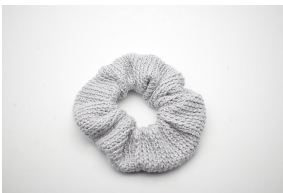
16. Klipp av garnet og fest ender.