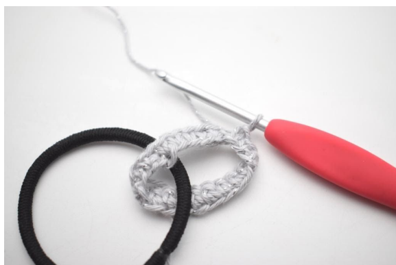
3. Lag 1 lm og hekle fm omgangen rundt. Avslutt med 1 kjm i første fm. (20)