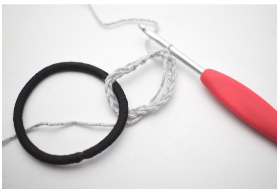
2. Samle de til en ring rundt hårstrikken din med 1 kjm.