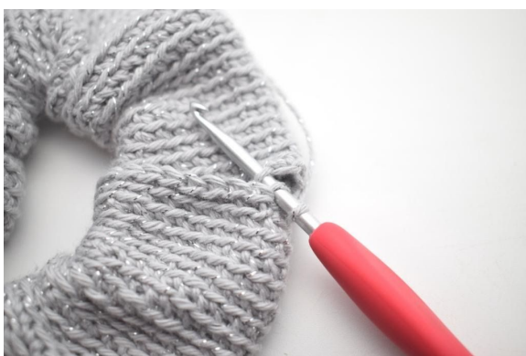
11. Hekle ringen sammen ved å hekle kjm gjennom bml og leddet i oppleggskanten.