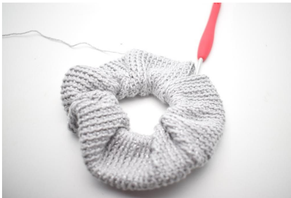
10. Gjenta fremgangsmåten til du har ca. 95 omganger.