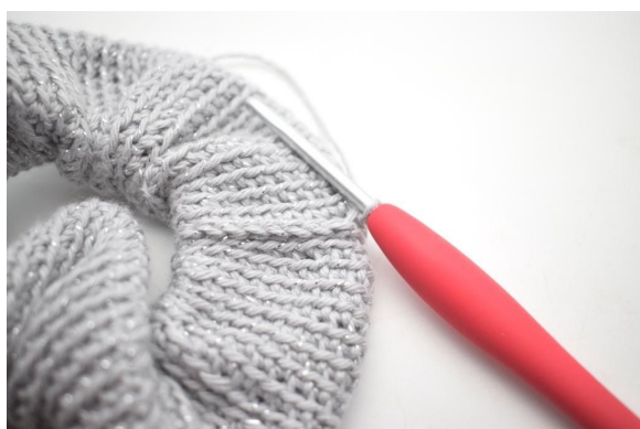
15. Gjenta hele veien rundt.