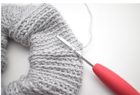
13. Hekle 1 kjm gjennom neste bml og neste ledd i oppleggskanten.