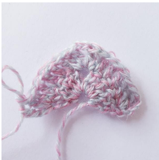
Etter omgang 2