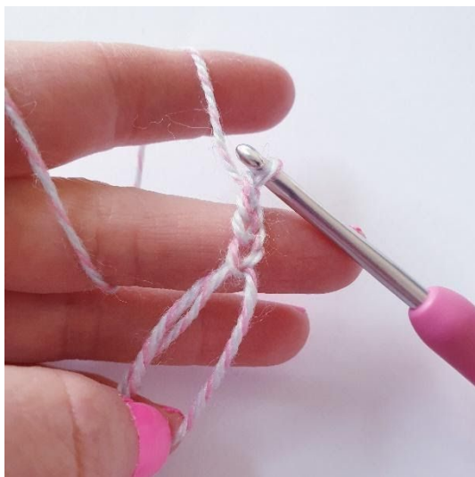
Omgang 1: 4 lm

Lag en magisk ring, men ikke samle den helt.