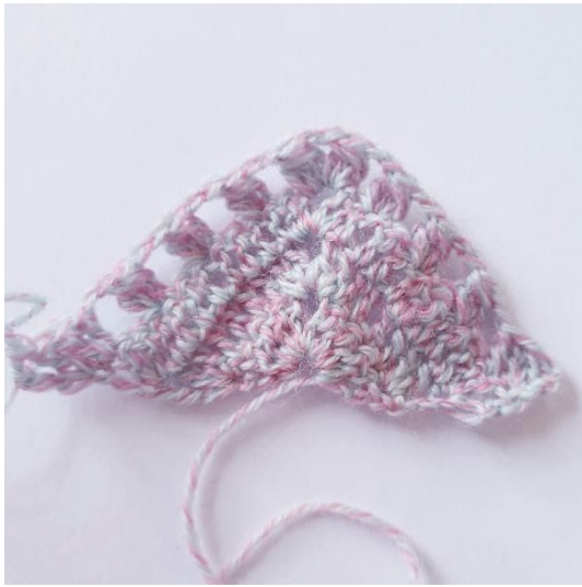
Etter omgang 4