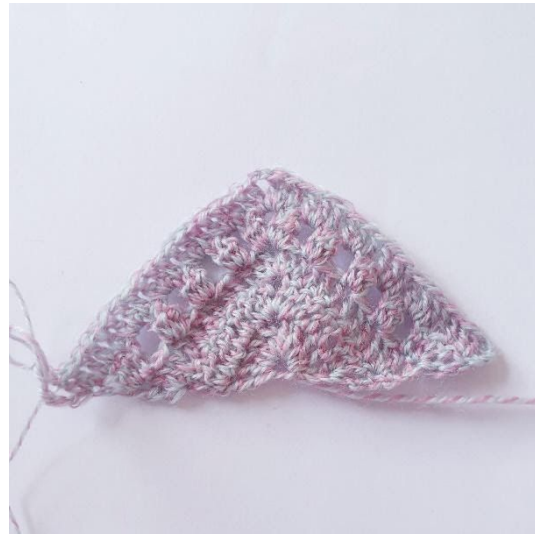
Etter omgang 5