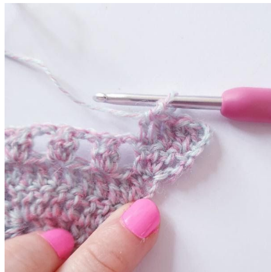
1 stv i de neste 3 m