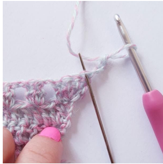
Omgang 5: Lag 4 lm og snu