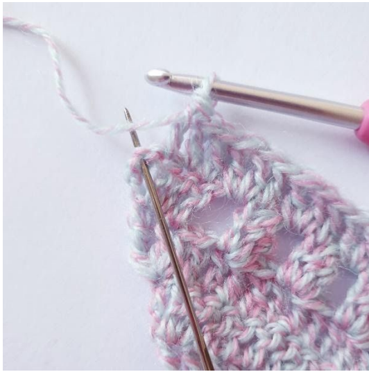
[2 stv, 1 dstv] i slm