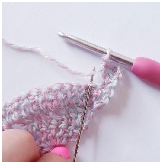
1 stv i neste m