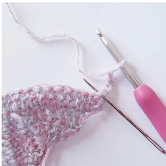
Omgang 4: 2 stv i første m