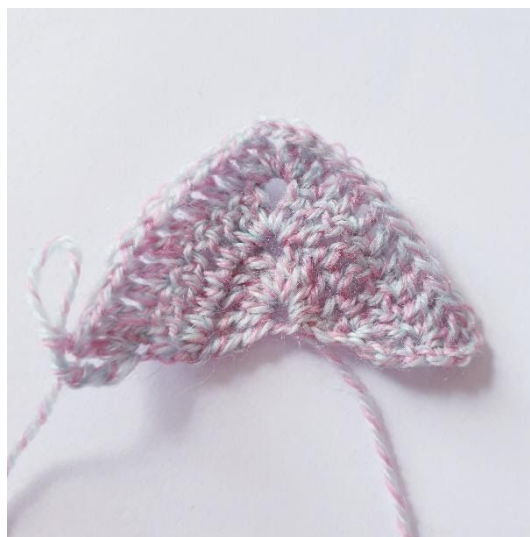
Etter omgang 3