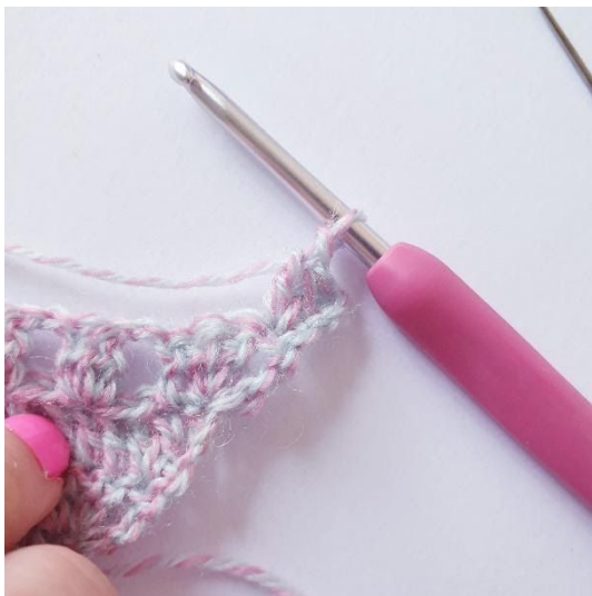
2 stv i første m