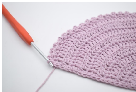
14. "Lag 2 lm, hekle 1 kjm i 2. lm fra nålen, hopp over 1 m og hekle 1 fm i neste m". Gjenta "til" ut omgangen og avslutt med 1 kjm i første m.