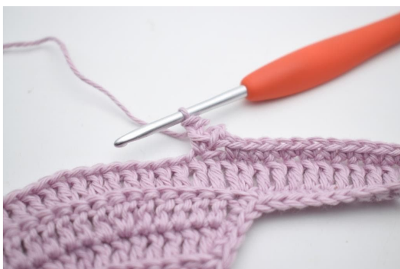
11. Hopp over 1 m.