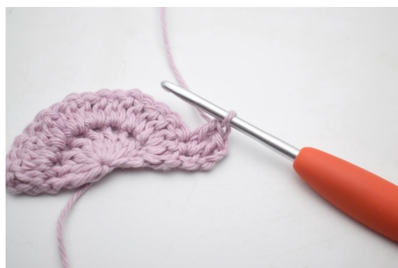
4. Hekle 1 stv i neste m.