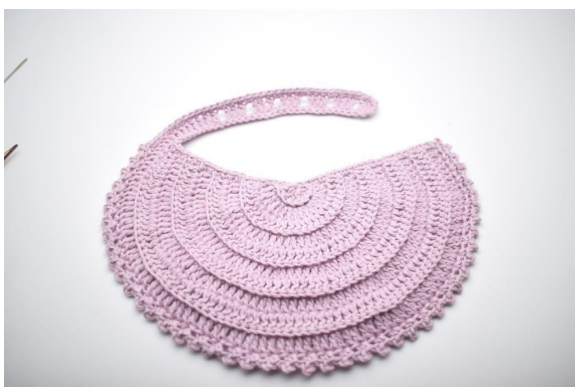
15. Slik. Klipp av garnet og fest ender.