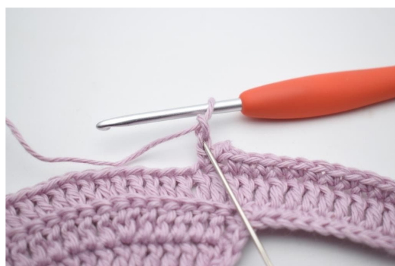
10. Hekle 1 kjm i 2. lm fra nålen.