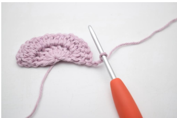
1. Snu med 3 lm.