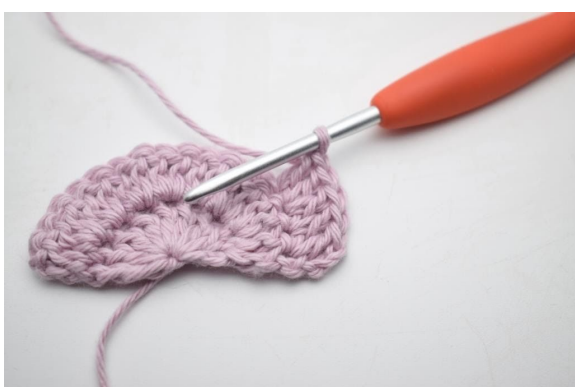
5. "Hekle 2 stv i neste m, 1 stv i den etterfølgende m".