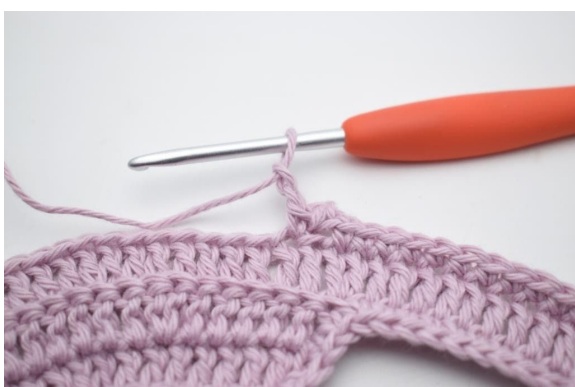
9. Lag 2 lm.