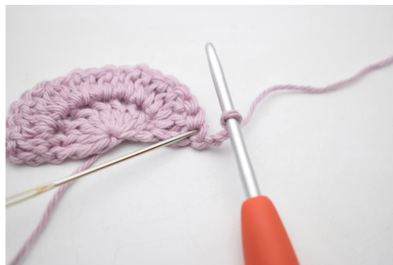
2. Hekle 1 stv i samme m.