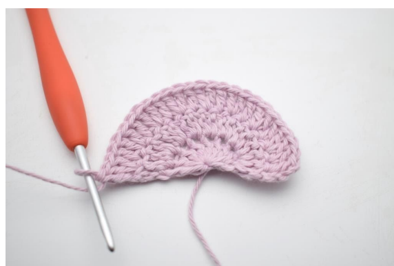
6. Gjenta "til" ut raden. (27)