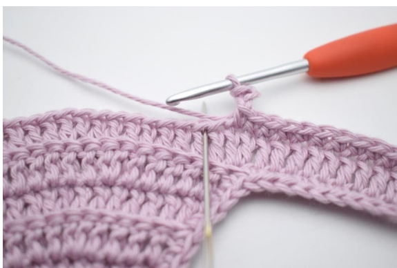
7. Hopp over 1 m og hekle 1 fm i neste m.