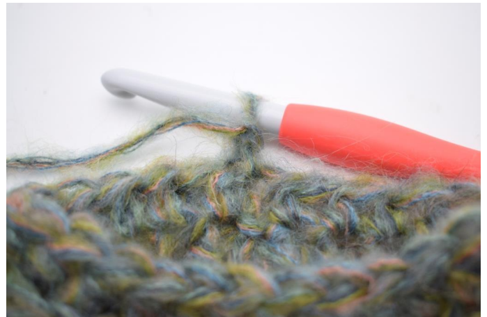
13. Vend arbeidet.