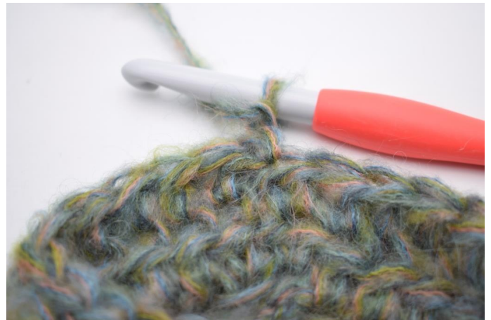
8. Vend arbeidet.