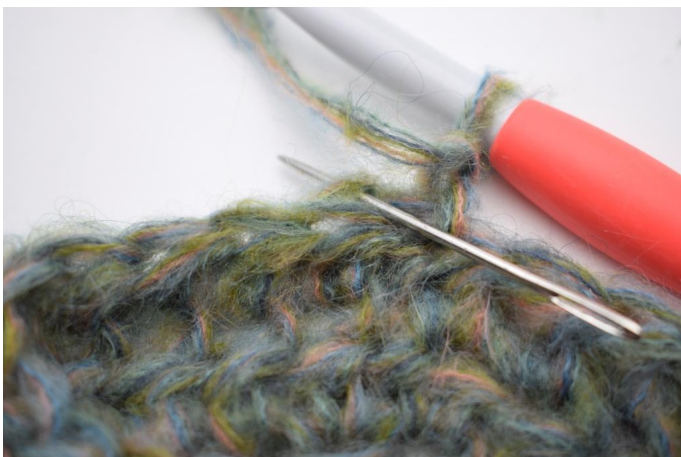
9. Hekle hstm i bml i første m.