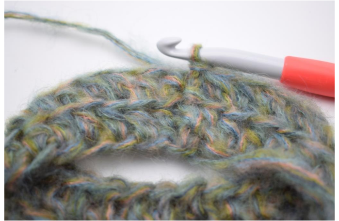
6. Hekle hstm i bml rundt omgangen. Avslutt med 1 km i første hstm. (58)