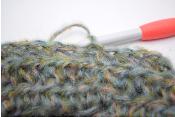
11. Hekle hstm i bml rundt omgangen. Avslutt med 1 km i første hstm. (58)