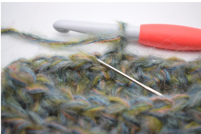
14. Hekle hstm i bml i første m.