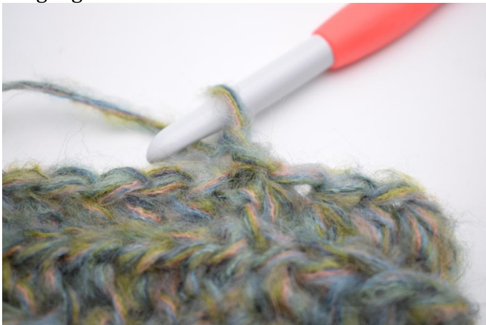
12. Denne omgang hekles som omgang 3. Lag 1 lm.