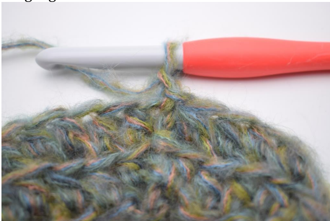
7. Lag 1 lm.