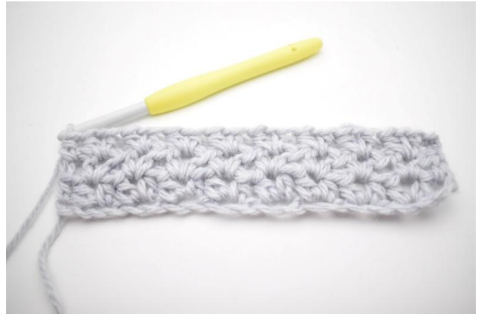
6. Det var omgang 3.