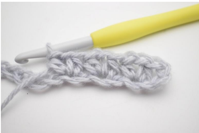
7. Hekle 1 hstm, 1 lm og 1 halvst i neste lm.