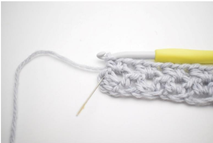
7. Hekle 1 halvst i siste m.