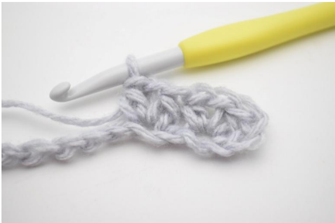
5. Hekle 1 halvst, 1 lm og 1 halvst i neste lm.