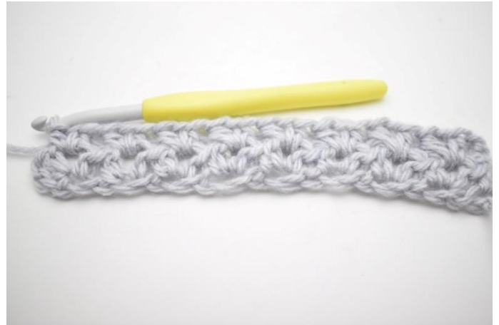
6. Gjenta "til" ut omgangen.