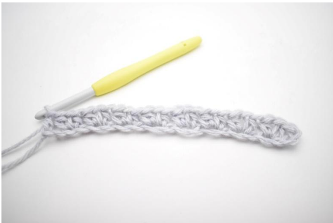
11. Det var første omgang.