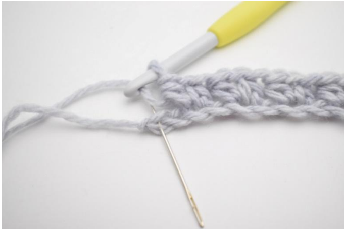
9. Hopp over 1 lm og halvst 1 halvst i siste m.