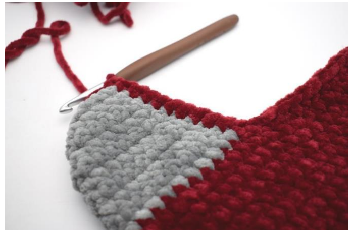
Hekle 10 fm langs den ene siden av hælen