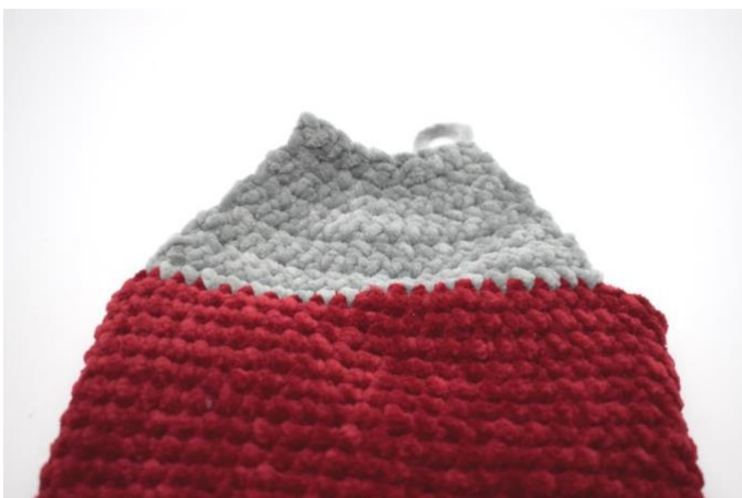
Slik ser hælen ut nå.