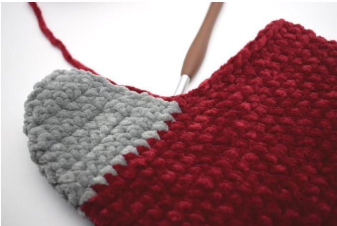
Hekle 1 fm i 28 m frem til der hælen starter.