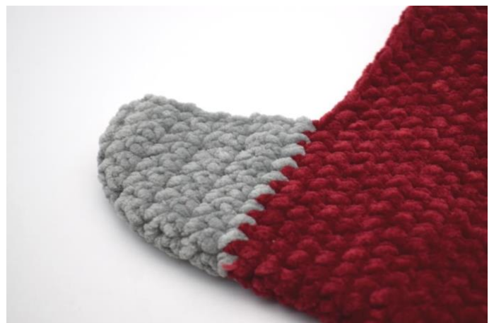
Sy enden sammen på vrangsidan. Hælen er ferdig.