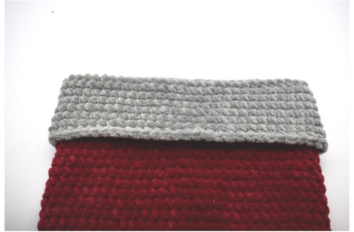
Brett kanten ned over sokken.