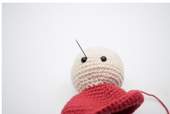
3. Stikk nålen ut på høyre side av det andre øyet.