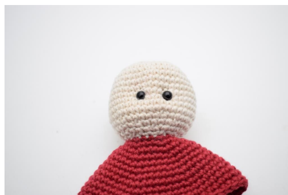
6. Bind en knute og gjem endene inne i hodet.