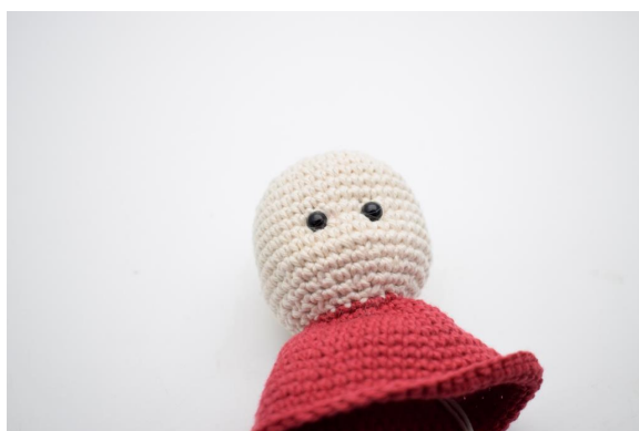
5. Stram lett til du har den ønskede fordypningen.