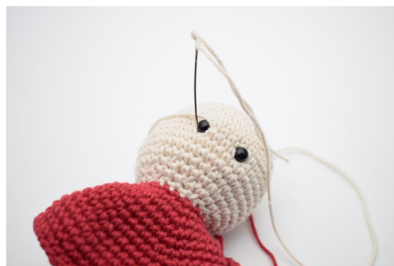
4. Stikk nålen ned på venstre side av øyet.