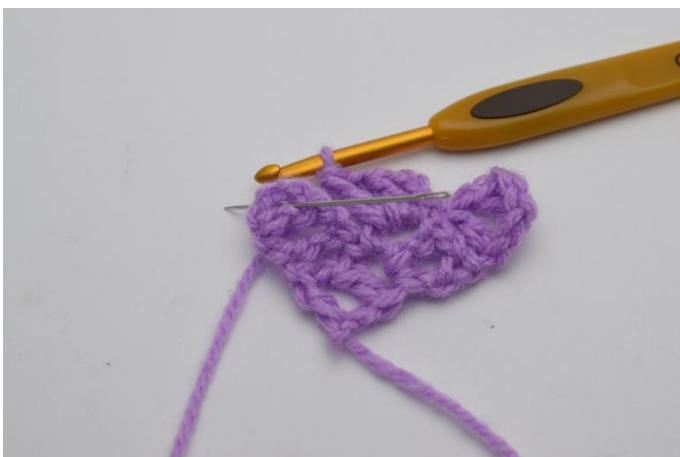
7. Lag nå 1 km i firkanten under. Nålen her viser hvor din km skal hekles.