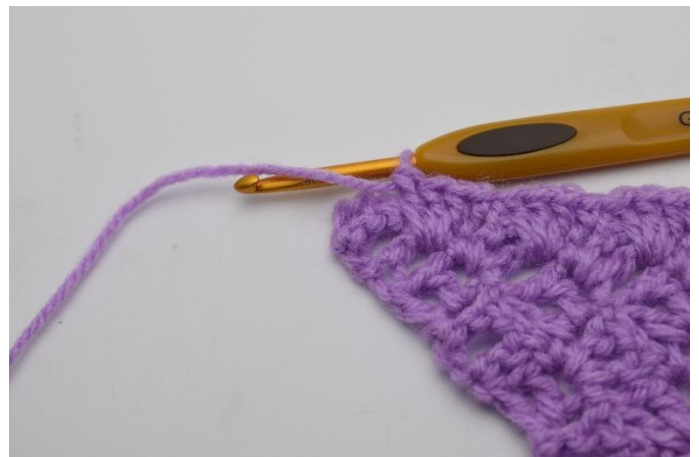
10. Gjenta ut raden.