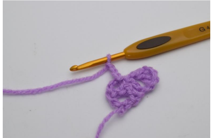
6. Lag 3 lm.