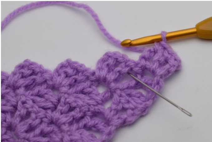
3. Nå hekles det imellom "firkantene" på de 2 foregående radene. Nålen her viser hvor du skal hekle.