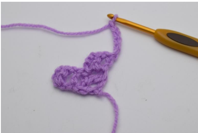
1. Vend arbeidet og lag 6 lm.