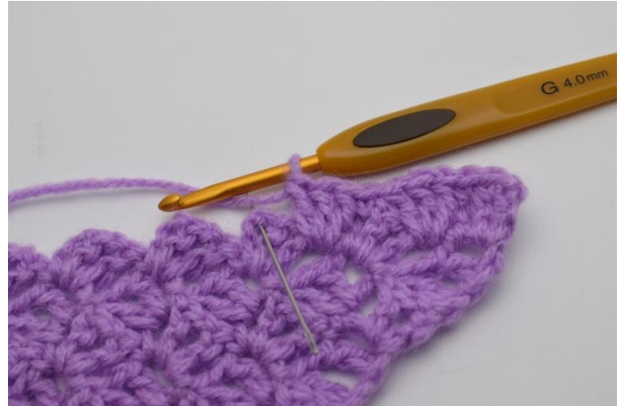
8. Hopp over 2 stm og hekle 1 fm i lm-buen.