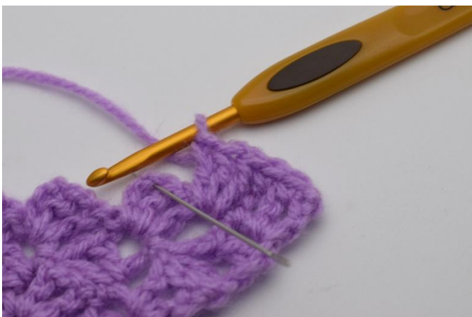
5. Hopp over 2 stm og hekle 1 fm i lm-buen.