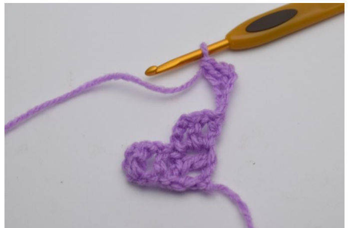
2. Hekle 1 stm i 4. lm fra nålen.