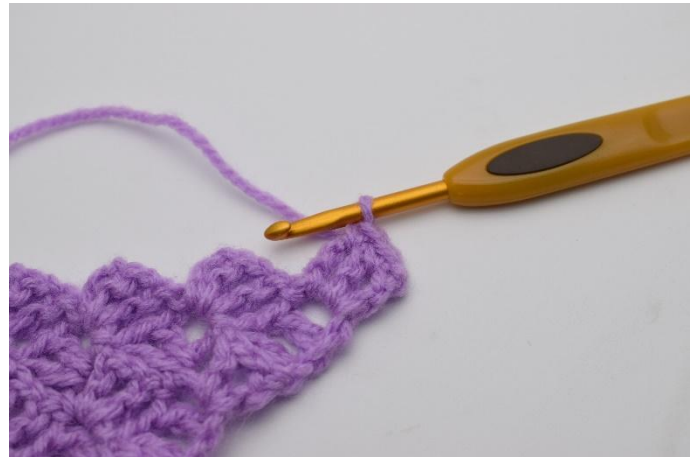
2. Hekle 1 fm i de 2 stm.