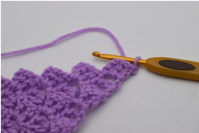
1. Vend arbeidet med 1 lm.