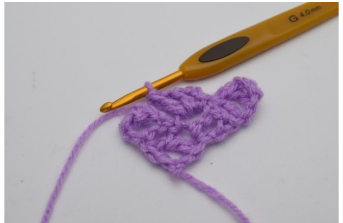
6. Hekle "1 stm, 1 lm og 1 stm" ned i den lm-bue du nettopp har laget 1 km i.