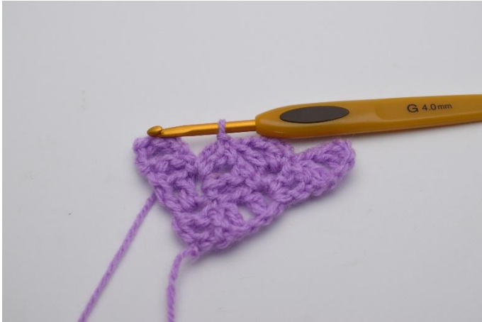
5. Lag 1 km i firkanten under.