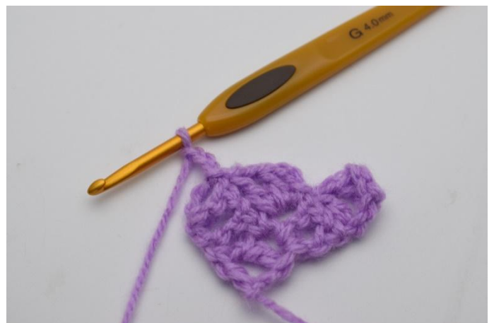
8. Lag 3 lm.