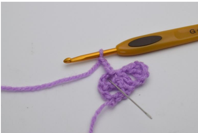
7. Hekle "1 stm, 1 lm og 1 stm" ned i den lmbuen du nettopp har laget 1 km i.