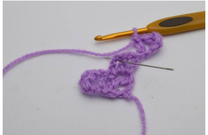
4. Lag nå 1 km i firkanten under. Nålen her viser hvor din km skal hekles.