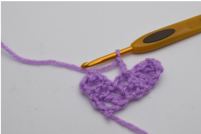
5. Lag 3 lm.