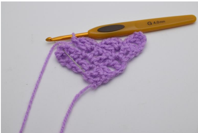
7. Lag 1 km i firkanten under.