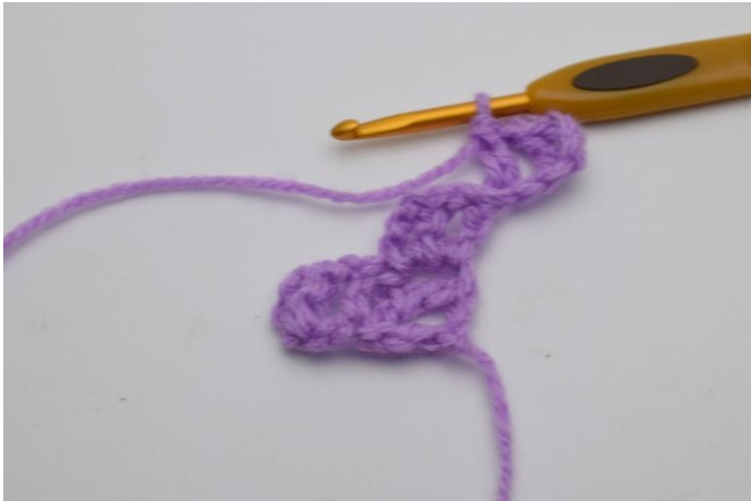
3. Lag 1 lm, og hekle 1 stm i den siste lm.