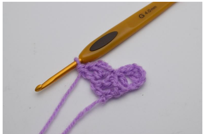
8. Det er nå dannet enda en "firkant". Og rad 2 har nå 2 "firkanter".