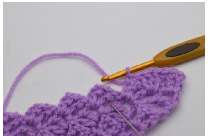
6. Slik. Hekle 3 stm mellom "firkantene" på de 2 foregående radene. Nålen her viser hvor du skal hekle.