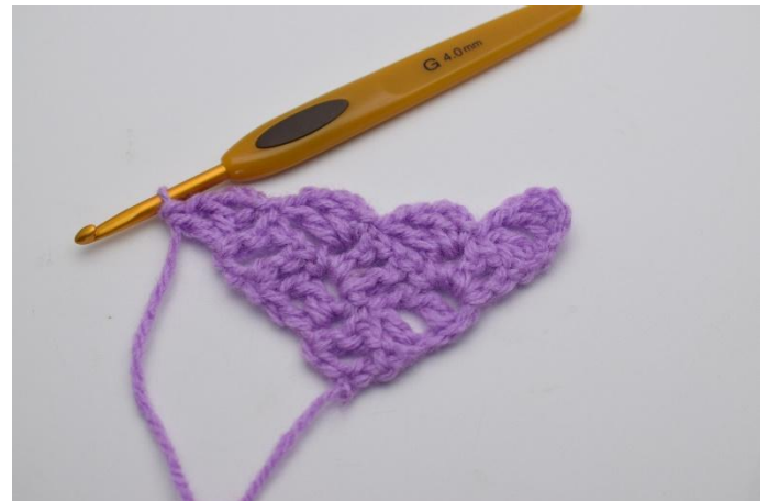
8. Lag 3 lm, og hekle 1 stm, 1 lm og 1 stm ned i den lm-bue du nettopp har laget 1 km i.