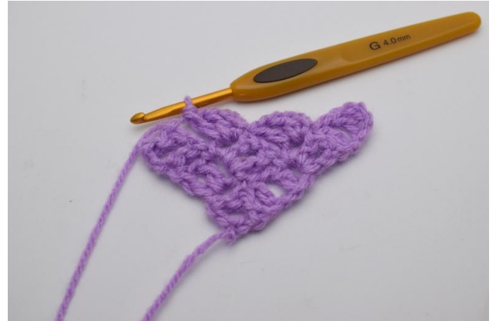
6. Lag 3 lm og hekle 1 stm, 1 lm og 1 stm ned i den lm-bue du nettopp har laget 1 km i.